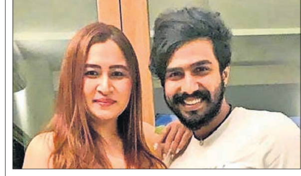
ବିଷ୍ଣୁ ବିଶ୍ୱାଳଙ୍କ ସହ ବ୍ରାଜ୍ମା ରୁଜା। ନୂଆଦିଲ୍ଲୀ, ୭ା୯