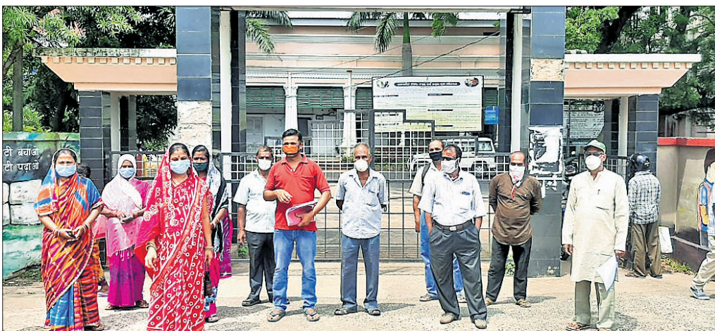
ଜିଲ୍ଲାପାଳଙ୍କୁ ଅଭିଯୋଗ କରିବାକୁ ଆସିଥିବା ପଞ୍ଚାୟତବାସୀ ।

ହାତୀ ଉପଦ୍ରବ ଲାଗି ରହିଛି । ଗତ ୫ ବର୍ଷରେ ଏଠାରେ ହାତୀ ଆକ୍ରମଣରେ ୨୦ରୁ ଅଧିକ ଲୋକ ପ୍ରାଣ ହରାଇଛନ୍ତି । ୫୦ରୁ ଉର୍ଦ୍ଧ୍ଵ ଘର ଭାଙ୍ଗିଥିବାବେଳେ ବହୁ ଏକର ଜମିରେ ଫସଲ ନଷ୍ଟ ହୋଇଛି । ଅଞ୍ଚଳବାସୀ ଆତଙ୍କିତ ସମସ୍ୟା ସମାଧାନ କରାଯିବାକୁ ବନ୍ଦ ହୋଇଯାଇଛି । ହାତୀ ଯାତାୟତ ପଥ ନିର୍ମାଣ ହେଉଥିବା ଘ୍ନାନ ନିକଟରେ