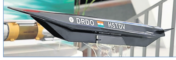
ନୂଆଦିଲ୍ଲୀ, ୭।୯ (ପି.ଟି.)