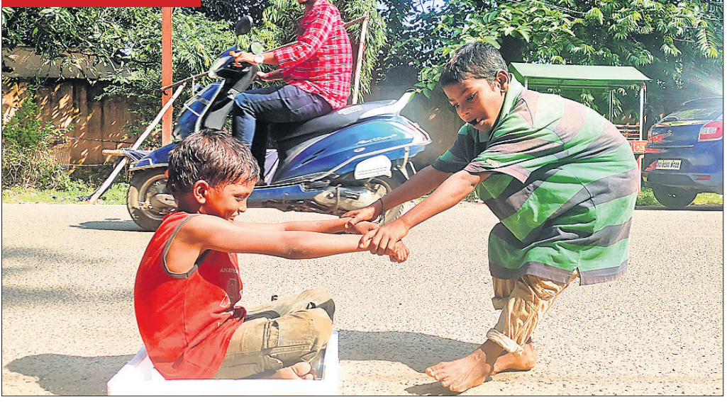
ଅନୁଗୋଳ ସହରରେ ଜଣେ ପିଲା ଶୋଳ ଉପରେ ବସିଥିବାବେଳେ ଅନ୍ୟଜଣେ ତାହାକୁ ଗାଡ଼ି ଭଳି ଆଗକୁ ଟାଣି ଖେଳୁଛନ୍ତି ।