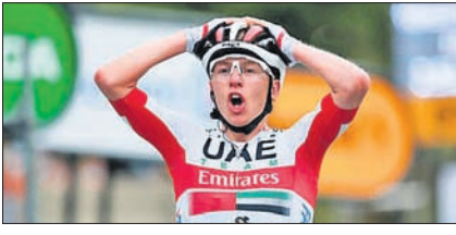
୧୫ତମ ସ୍ଥାନରେ ରହିବା ବ୍ୟତୀତ ଅଲ୍‌ଷ୍ଟ୍ରେରେ ୮ମ ସ୍ଥାନକୁ ଖସି ଆସିଛନ୍ତି। ସୋମବାର ହେଉଛି ଦିଶ୍ୱାମ ବିଦ୍ୟା ମଙ୍ଗଳବାର ଇଲେଡି' ଓଲେନ୍‌ରୁ ଇଲେ ଟି' ରେ ପର୍ଯ୍ୟନ୍ତ ୧୬୮.୫ କିଲୋମିଟର ଦୂରତା ବିଶିଷ୍ଟ ରେସ୍‌ର ୧୦ମ ଷ୍ଟେଜ୍ ଅନୁଷ୍ଠିତ ହେବ।

ଲାହୁର (ଫ୍ରାନ୍ସ), ୭।୯ (ଏସି) ରବିବାର ଏକ ଶ୍ରେଣ୍ଟ୍ ପିନିଶରେ ରଗଲିକ୍ ଓ ମାର୍କ ହିରସ୍ (ଟିମ୍ ସନ୍‌ଡ୍ରେକ୍)କୁ ପଛରେ ପକାଇ ଗାଡେକ୍ ପୋଗାକାର (ୟୁଏଲ ଟିମ୍ ଏମିରେଟ୍ସ) ରୁର ଟି' ଫ୍ରାନ୍ସ ସାଇକେଲ ରେସ୍‌ର ନବମ ଷ୍ଟେଜ୍ ଜିତିଛନ୍ତି। ଅନ୍ୟପକ୍ଷରେ ପ୍ରିମୋକ୍ ରଗଲିକ୍ (କ୍ଲେୟା-ଭିଷ୍ଟା)ବ୍ରିଟେନର ଆଡାମ୍ ଯେଟ୍ସ୍ (ମିଟେଲଟେନ୍ ସ୍‌ର୍)କଠାରୁ ଯୁଦ୍ଧ କରି ବଜ୍ରା କରି ନେଇଛନ୍ତି। ଜଗାନ ବର୍ନାଲ୍ (ଇନିଅସ୍ ଗ୍ରେନାଡିଅର୍) ଏବଂ ମିକେଲ ଲାଷ୍ଟା (ବାହାରିନ୍ ମ୍ୟାକଲରେନ) ସମାନ ସମୟରେ ରେସ୍ ଶେଷ କରିଥିଲେ। ରେସ୍‌ରେ ଆଡାମ୍ ଯେଟ୍ସ୍