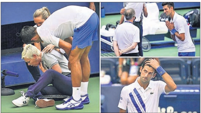
ଲାଇନ୍ ଜିଜ୍ଞୁ ବଲ୍‌ରେ ଆଘାତ ପରେ ଜୋକୋଭିଚ୍‌ଙ୍କ ପ୍ରତିକ୍ରିୟା।