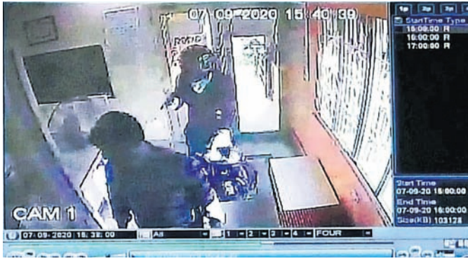
ସିସିଡିଭିରେ ଲୁଟ୍ ସମୟର ଦୃଶ୍ୟ।

ଭୁବନେଶ୍ୱର, ୭।୯ (ବ୍ୟୁରୋ) ରାଜଧାନୀ ଭୁବନେଶ୍ୱରରେ ଧର୍ଷଣ ପରେ ପୁଣି ଏକ ବ୍ୟାଙ୍କ ଲୁଟ୍ ହୋଇଛି। ଜଣେ ଲୁଟେରା କର୍ମଚାରୀଙ୍କ ମୁଣ୍ଡରେ ଖେଳଣା ବନ୍ଧୁକ ଲଗାଇ ୨ଲକ୍ଷ ୮୦ହଜାର ଟଙ୍କା ଲୁଟି ନେଇଛନ୍ତି। ଲୁଟପୋସ୍ତି ଆନା ଅନ୍ତର୍ଗତ ନନ୍ଦନବିହାରସ୍ଥିତ ଇଣ୍ଡିଆନ୍ ଓଭରସିଜ୍ ବ୍ୟାଙ୍କରେ ଯୋଗଦାନ ଅପରାହ୍ଣରେ ଏହି ଘଟଣା ଘଟିଛି। ଖବରପାଇ ଲୁଟପୋସ୍ତି ଆନା ଅଧିକାରୀ ଘଟଣା ସ୍ଥଳରେ ପହଞ୍ଚି ତଦନ୍ତ ଆରମ୍ଭ କରିଛନ୍ତି। ବ୍ୟାଙ୍କରେ ଲାଗିଥିବା ସିସିଡିଭି ଫୁଟେଜ ଯାଞ୍ଚ କରିବା ସହ କର୍ମଚାରୀଙ୍କ ବୟାନ ରେକର୍ଡ କରିଛନ୍ତି। ବ୍ୟାଙ୍କ ପରିଚାଳକ ଏନେଇ ଲୁଟପୋସ୍ତି ଆନାରେ ଅଭିଯୋଗ କରିଥିବା ଜଣାପଡିଛି।