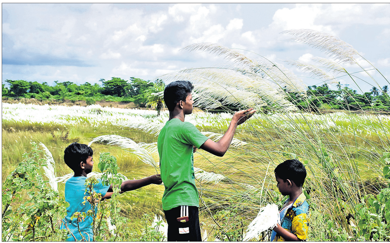
ସୌନ୍ଦର୍ଯ୍ୟର ସର୍ଗ: ଭୁବନେଶ୍ୱର ଉପକଣ୍ଠ ବାଲିକୁଦା ଗାଁ ନିକଟ ଦୟା ନଦୀପାଠରେ ପିଲାମାନେ କାଶତଣ୍ଡା ପୁଲ ସହ ଖେଳୁଛନ୍ତି।