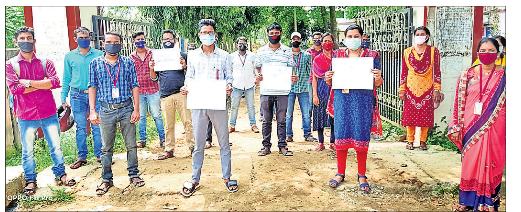
ଅଫିଲାଇନ୍ ପରୀକ୍ଷାକୁ ବିରୋଧ କରୁଛନ୍ତି ବିଏଡ୍ ଛାତ୍ରାଛାତ୍ରୀ ।