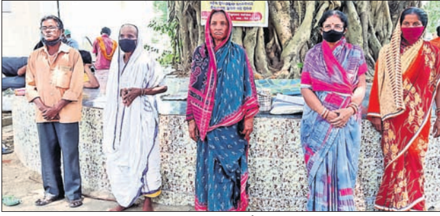
ଜିଲ୍ଲାପାଳଙ୍କ ଅଫିସ୍ ସମ୍ମୁଖରେ ଅବସରପ୍ରାପ୍ତ କର୍ମଚାରୀ ।