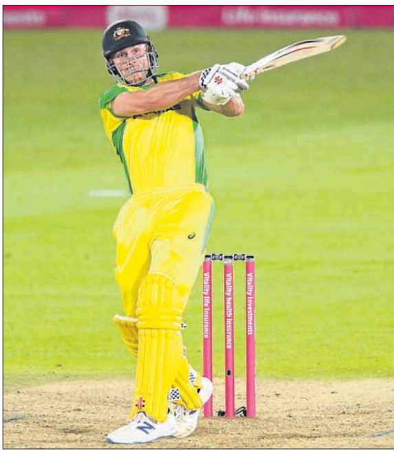
ଘୋର ଅଫ୍ ଦି ମ୍ୟାଚ୍ ମିଡେଲ୍ ମାର୍କ୍