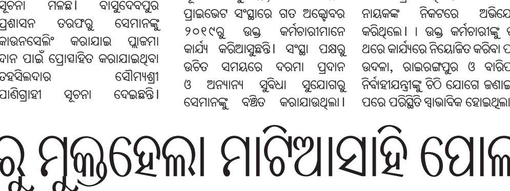
ମାଟିଆସାହି ପୋଲ ମାପ କରାଯାଇଛି ।