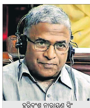
ହରିବଂଶ ନାରାୟଣ ସିଂହ

ହେବାର କାର୍ଯ୍ୟକ୍ରମ ରହିଛି। ପୂର୍ବର ଉଲ୍ଲି ଏଥର ମଧ୍ୟ ଉପାଧ୍ୟକ୍ଷ ନିର୍ବାଚନରେ ବିଜେଡିର ପ୍ରମୁଖ ଭୂମିକା ରହିବ। ରାଜ୍ୟ ସଭା ଉପାଧ୍ୟକ୍ଷ ହରିବଂଶଙ୍କ କାର୍ଯ୍ୟକାଳ ଗତ ଏପ୍ରିଲରୁ ଶେଷ ହେଲାଣି। ଜେଡିଏୁ ତାଙ୍କୁ ପ୍ରାର୍ଥୀ କରିବା ପରେ ଏନ୍ଡିଏ ଏହାକୁ ସମର୍ଥନ କରିଛି। ଅପରପକ୍ଷରେ ସମଭାବପନ ବଳ ଭାବେ ତିନିମନେ ପ୍ରାର୍ଥୀଙ୍କୁ କଂଗ୍ରେସ ସମର୍ଥନ ଜଣାଇଛି। ଏପରିକି କଂଗ୍ରେସ ନେତା ଗୁଲାନଗରୀ