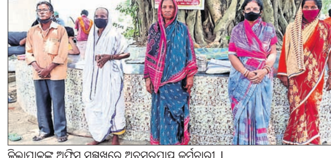
ଜିଲ୍ଲାପାଳଙ୍କ ଅଫିସ୍ ସମ୍ମୁଖରେ ଅବସରପ୍ରାପ୍ତ କର୍ମଚାରୀ।