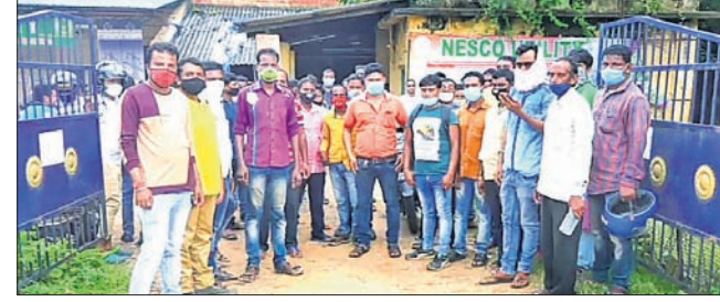
ଠିକା କର୍ମଚାରୀମାନେ ବିକ୍ଷୋଭ ପ୍ରଦର୍ଶନ କରୁଛନ୍ତି।