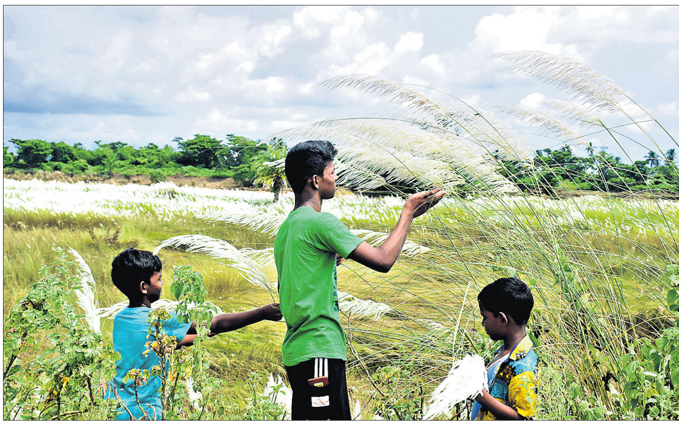
ସୌନ୍ଦର୍ଯ୍ୟର ସର୍ଗ: ଭୁବନେଶ୍ଵର ଉପକଣ୍ଠ ବାଲିକୁଦା ଗାଁ ନିକଟ ଦୟା ନଦୀପାଠରେ ପିଲାମାନେ କାଶତଣ୍ଡା ପୁଲ ସହ ଖେଳୁଛନ୍ତି।

ଓସ୍ଲୋ, ୯।୯ ଆମେରିକା ରାଷ୍ଟ୍ରପତି ଡୋନାଲ୍ଡ ଟ୍ରମ୍ପ ୨୦୨୧ ବର୍ଷ ପାଇଁ ନୋବେଲ ଶାନ୍ତି ପୁରସ୍କାର ପାଇବା ଲାଗି ମନୋନୀତ ହୋଇଛନ୍ତି। ଇସ୍ରାଏଲ ଓ ସଂଯୁକ୍ତ ଆରବ ଏମିରେଟ୍ସ (ୟୁଏଇ) ମଧ୍ୟରେ ଶାନ୍ତି ପ୍ରତିଷ୍ଠା କ୍ଷେତ୍ରରେ ମଧ୍ୟସ୍ଥତା କରିଥିବାରୁ ନରୱେର ଜଣେ ସାଂସଦ