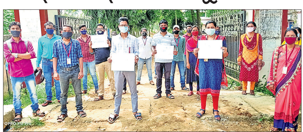
ଅଫ୍‌ଲାଇନ୍ ପରୀକ୍ଷାକୁ ବିରୋଧ କରୁଛନ୍ତି ବିଏଡ୍ ଛାତ୍ରାଛାତ୍ରୀ।

ବାଲେଶ୍ୱର ଅଫିସ, ୯।୯: କୁଳପତିଙ୍କୁ ଦାବିପତ୍ର ଦେଲେ ବିଏଡ୍ ଛାତ୍ରାଛାତ୍ରୀ ଚାରି ହୋଇଛି। ନୋଟିସ୍ ଅନୁସାରେ ଆସନ୍ତା ୨୧ରୁ ୩୦ ତାରିଖ ପର୍ଯ୍ୟନ୍ତ ପରୀକ୍ଷା ଅନୁଷ୍ଠିତ ହେବ। ପ୍ରତ୍ୟେକ ଦିନ ପରୀକ୍ଷା ରହିଛି। ଅଭିଯୋଗ କୁଳପତିଙ୍କୁ ଦାବିପତ୍ର ପ୍ରଦାନ କରିଛନ୍ତି। ବାଲେଶ୍ୱର ବ୍ୟତୀତ ଭଦ୍ରକ, ଅନୁଗୁଳ, କେନ୍ଦ୍ରାପଡ଼ା, ଯାଜପୁର, କଟକ, ଭୁବନେଶ୍ୱରର ପିଲାମାନେ ଅଧୀନରେ ଥିବା ବିଏଡ୍ ପରୀକ୍ଷାକୁ ଅନଲାଇନ୍ ଦ୍ୱାରା କରାଯାଉଥିବା ବେଳେ ବାଲେଶ୍ୱର ବିଏଡ୍ ପରୀକ୍ଷାକୁ ଅଫ୍‌ଲାଇନ୍‌ରେ କରିବାକୁ ନୋଟିସ୍ ପଠାଯାଇଛି।