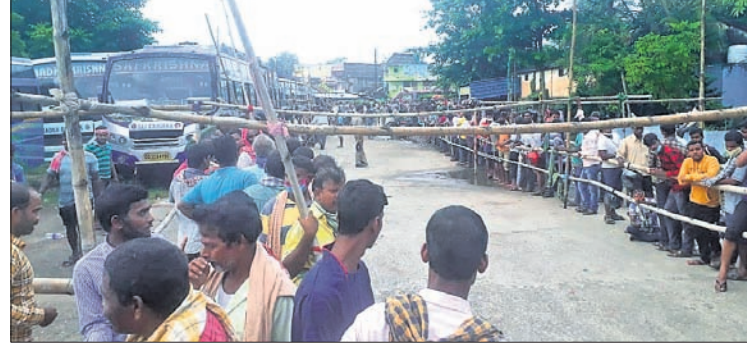
ସାର ନେବା ପାଇଁ ଚାଷୀଙ୍କ ଲାୟା ଧାଡ଼ି