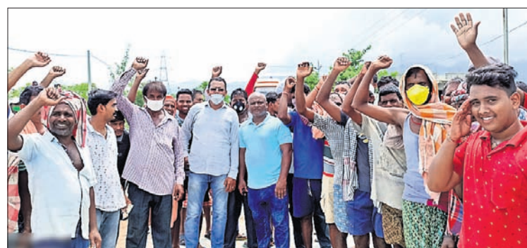
ଭରେଇତ ଚାଷୀଙ୍କ ରାସ୍ତା ଅବରୋଧ