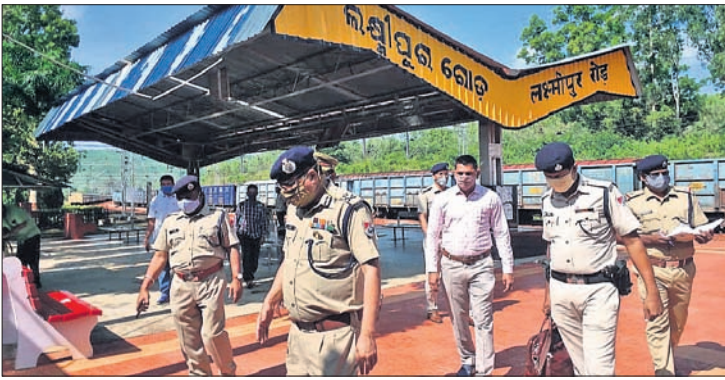
ଲକ୍ଷ୍ମୀପୁର ରେଲ ଷ୍ଟେଶନରେ ଆରପିଏଏ ଆଇଜି ଓ ଅନ୍ୟ ଅଧିକାରୀମାନେ।