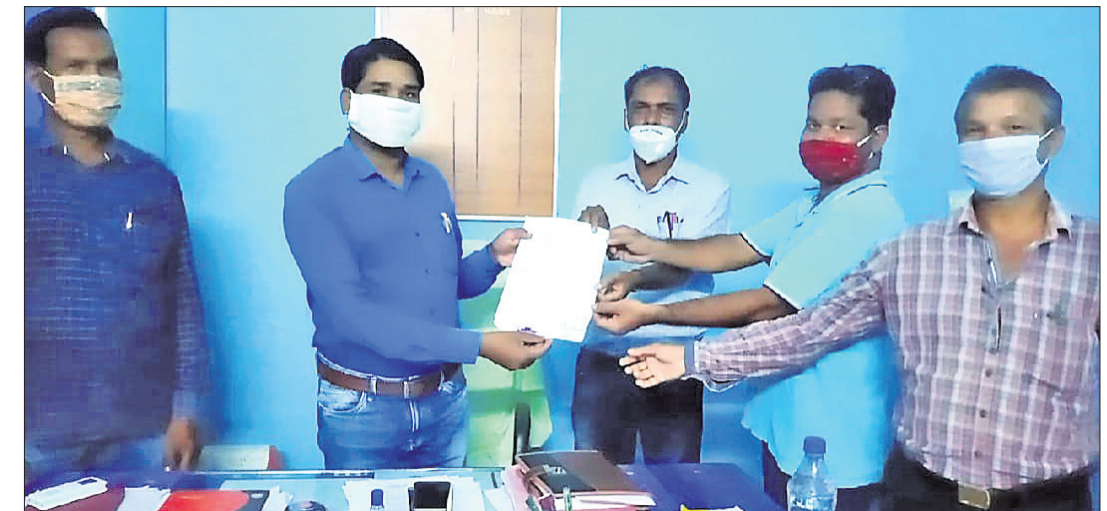
ରଦାହାଣ୍ଡି ଶିକ୍ଷକ ସଂଘ ବିଲ୍‌ଓକୁ ଦାବିପତ୍ର ଦେଉଛନ୍ତି।

ରଦାହାଣ୍ଡି, ୧୦।୯(ଡି.ଏନ୍.ଏ.) ବିଲ୍‌ଓ ଭଙ୍ଗନାଲ ମାଟ୍ରିକୁ ପ୍ରଦାନ କରାଯାଇଛି। ଗତ ୨ତାରିଖରେ ନବରଜାପୁର ଜିଲ୍ଲା ଶିକ୍ଷାଧିକାରୀଙ୍କ କାର୍ଯ୍ୟାଳୟରେ