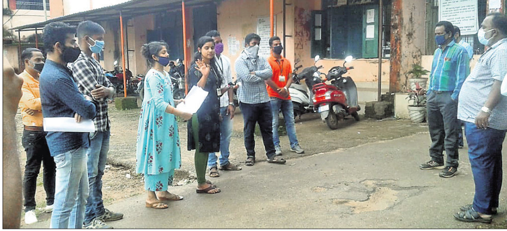
ଛାତ୍ରାଛାତ୍ରୀମାନେ କଲେଜ କର୍ତ୍ତୃପକ୍ଷଙ୍କ ସହ ଆଲୋଚନା କରୁଛନ୍ତି।

କୋରାପୁଟ କଲେଜ ପାଇଁ ଫୁଲ କଲେଜ ବନ୍ଦ ରହିଛି। ଏହା ମଧ୍ୟରେ ସରକାର ବିଭିନ୍ନ ବିଭାଗର ଶେଷ ବର୍ଷ ପରୀକ୍ଷା କରିବାକୁ ପାଇଁ ନିଷ୍ପତ୍ତି ନେଇଛନ୍ତି।