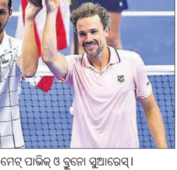
ଟ୍ରଫି ସହ ମେଡ଼ ପାଭିକ୍ ଓ ସୁନା ସୁଆରେସ୍ ।

ସମୟ ଆବଶ୍ୟକ ହୋଇଥିଲା । ସୋଆରେସ୍ ପାଇଁ ଏହା ତୃତୀୟ ଗ୍ରାଣ୍ଡସ୍ଲାମ ଚାକର ଯାଦୁ ହୋଇଛି । ଦୀର୍ଘ ବର୍ଷ ପରେ ଗ୍ରାଣ୍ଡସ୍ଲାମ ଚାକର ଯାଦୁ ହୋଇଛି ।