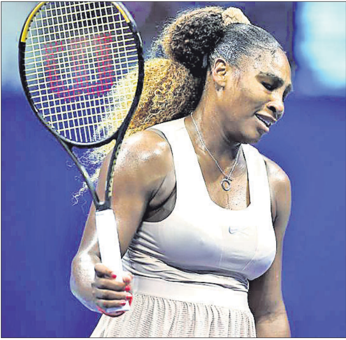
ପରାଜୟ ପରେ ସେରେନା ଓସାକାଙ୍କ ପ୍ରତିକ୍ରିୟା ।

ବୋଲି ଓସାକା କହିଛନ୍ତି । ଏହି କ୍ୱାଲିଫି ଯେମିତି ଫାଇନାଲରେ ବିଜୟୀ ହେବା ପାଇଁ ଓସାକାଙ୍କୁ ଅବଶ୍ୟକ କଷ୍ଟ କରିବାକୁ ପଡ଼ିଥିଲା । ପୂର୍ବରୁ ଯେମିତି ଫାଇନାଲରେ ବିଜୟୀ ହେବା ପାଇଁ ଓସାକାଙ୍କୁ ଅବଶ୍ୟକ କଷ୍ଟ କରିବାକୁ ପଡ଼ିଥିଲା । ପୂର୍ବରୁ ଯେମିତି ଫାଇନାଲରେ ବିଜୟୀ ହେବା ପାଇଁ ଓସାକାଙ୍କୁ ଅବଶ୍ୟକ କଷ୍ଟ କରିବାକୁ ପଡ଼ିଥିଲା ।