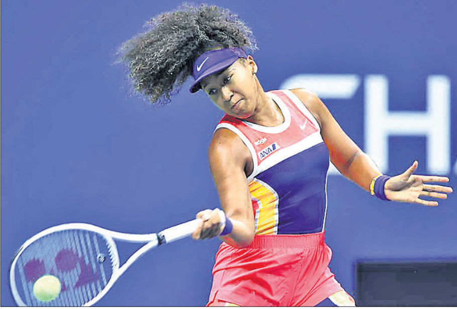
ୟୁଏସ୍ ଓପନ୍ ମହିଳା ସିଙ୍ଗଲ୍ସ ଯେମିତି ଫାଇନାଲରେ ଶର୍ ଖେଳିବା ଅବସରରେ ନାଓମି ଓସାକା ।

ରଖିପାରି ନ ଥିଲେ । ବାମ ଗୋଲଠିରେ ସେରେନା ଯନ୍ତ୍ରଣା ଅନୁଭବ କରିଥିଲେ । ଫଳରେ ସେ ମେଡିକାଲ ଚାକର ଆଉଟ୍ ନେଇଥିଲେ । ବିଜୟୀ ଯେମିତି ଫାଇନାଲରେ ବିଜୟୀ ହେବା ପାଇଁ ଓସାକାଙ୍କୁ ଅବଶ୍ୟକ କଷ୍ଟ କରିବାକୁ ପଡ଼ିଥିଲା ।