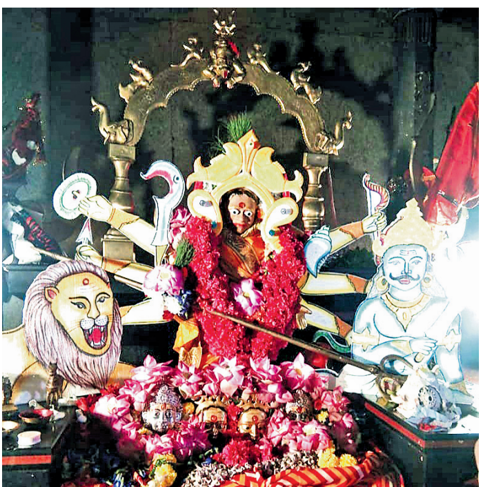
ମା' ତାରା ତାରିଣୀଙ୍କ ମହିଷା ମର୍ଦ୍ଦିନୀ ବେଶ ।