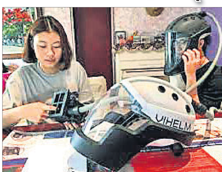
ଏକ ଟ୍ୟୁବ୍ ରହିଛି ଯାହା ଯଦି ପ୍ୟାରିଫୋରମ୍ ଭଳି କାମ କରେ। ଭିହେଲ୍ମେଟ୍ ଦାମ୍ ଏବେ ୩୦୦ ଡଲାର ରଖାଯାଇଛି ଏବଂ ଏହାକୁ ଭିହେଲ୍ମେଟ୍ ନାମକ ଏକ ସଂସ୍କାରଣ କରାଯାଇଛି।

ହେଲ୍ମେଟ୍ ପିନ୍ଧି ଖାଇହେବ ସ୍ମାକ୍ସ। ହେଲ୍ମେଟ୍ ପିନ୍ଧି ଖାଇହେବ ସ୍ମାକ୍ସ। ହେଲ୍ମେଟ୍ ପିନ୍ଧି ଖାଇହେବ ସ୍ମାକ୍ସ। ହେଲ୍ମେଟ୍ ପିନ୍ଧି ଖାଇହେବ ସ୍ମାକ୍ସ।