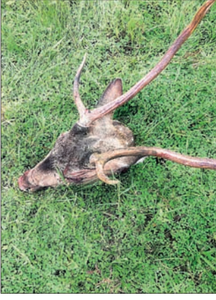
ଶିକାରୀମାନେ ସେଠାରୁ ଫେରାର ହୋଇଯାଇଥିଲେ। ହେଲେ ଖାଲି କଟା ମୁଣ୍ଡଧରି ବନ କର୍ମଚାରୀ ଫେରିଥିଲେ।

ଖୁଣ୍ଟୁଣୀ ବନାଞ୍ଚଳ ଅଧୀନ ପନିଆମା ଗ୍ରାମପଞ୍ଚାୟତ ଖଣି ନିକଟରୁ ଏକ ସନ୍ଧ୍ୟା କଟାଯାଇଥିବା ହରିଣର ମୁଣ୍ଡକୁ ବନାଞ୍ଚଳ କର୍ମଚାରୀ ଶୁକ୍ରବାର ଜବତ କରିଛନ୍ତି।