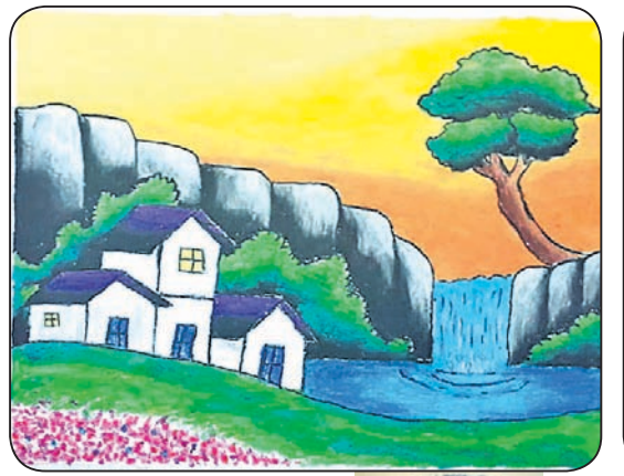
ନିଶା ପରିକା କ୍ଲାସ-୮, ଡିଏସି ପବ୍ଲିକ୍ ସ୍କୁଲ, ଚନ୍ଦ୍ରଶେଖରପୁର, ଭୁବନେଶ୍ଵର