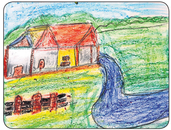
ଦେବାଂଶୁ ଆଚାର୍ଯ୍ୟ କ୍ଲାସ-୧, ଏସ.ଆର୍. ଡିଗି ସ୍କୁଲ ପୁରୀ, ହାଇଦ୍ରାବାଦ