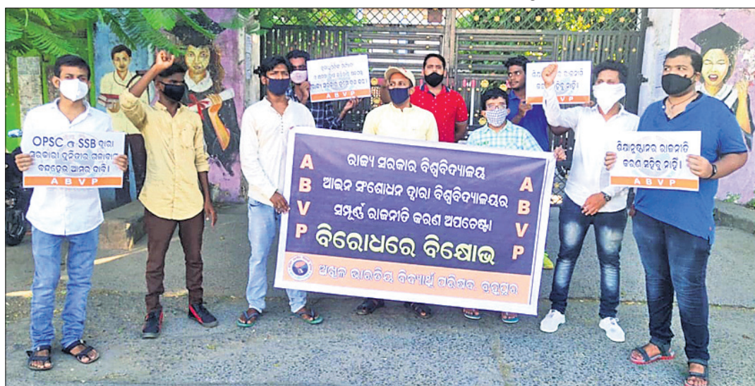
ଏଭିପି ପକ୍ଷରୁ ଆୟୋଜନ କରାଯାଇଛି ।

ବିଶ୍ୱବିଦ୍ୟାଳୟ ସଂଗୋଧନ ଆଇନକୁ ଚାପ ବିରୋଧ କରିଛି ଅଖିଳ ଭାରତ ବିଦ୍ୟାଳୟ ପରିଷଦ (ଏଭିପି) । ଏହାର ପ୍ରତିବାଦରେ ଶୁକ୍ରବାର ଅପରାହ୍ନରେ ଏଭିପି ବ୍ରହ୍ମପୁର ଶାଖା ପକ୍ଷରୁ ବ୍ରହ୍ମପୁର ଖଲିକୋଟ କଲେଜ ସମ୍ମୁଖରେ ବିରୋଧ ପ୍ରଦର୍ଶନ କରାଯାଇଥିଲା । ପରିବର୍ତ୍ତିତ ବିଶ୍ୱବିଦ୍ୟାଳୟ ସଂଗୋଧନ ଆଇନ ଯୁକ୍ତିଯୁକ୍ତ ଗାଳତ୍ୟାଚାର ଓ ସମ୍ବିଧାନ ବିରୋଧୀ ବୋଲି ଏଭିପି ଅଭିଯୋଗ କରିଛି । ରାଷ୍ଟ୍ରପତି ଶିକ୍ଷାନୀତି ମହାବିଦ୍ୟାଳୟ ଗୁଡ଼ିକୁ ବିଭିନ୍ନ ଦୃଷ୍ଟିରୁ ସ୍ୱତନ୍ତ୍ର ପ୍ରଦାନ କରୁଥିବା ବେଳେ ରାଜ୍ୟ ସରକାର ବିଶ୍ୱବିଦ୍ୟାଳୟଗୁଡ଼ିକୁ ରାଜନୈତିକ ଦଳଗୁଡ଼ିକ ଦ୍ୱାରା କେନ୍ଦ୍ରୀଭୂତ କରିବା ନେଇ ବିଶ୍ୱବିଦ୍ୟାଳୟ ଆଇନ ସଂଗୋଧନ ଆଣିଥିବା ଏଭିପି କହିଛି । ନୂତନ ସଂଗୋଧିତ ଆଇନ ପ୍ରଣୟନ ଦ୍ୱାରା ବିଶ୍ୱବିଦ୍ୟାଳୟରେ ମୌଳିକତା ସମ୍ପୂର୍ଣ୍ଣ ଧ୍ୱଂସ