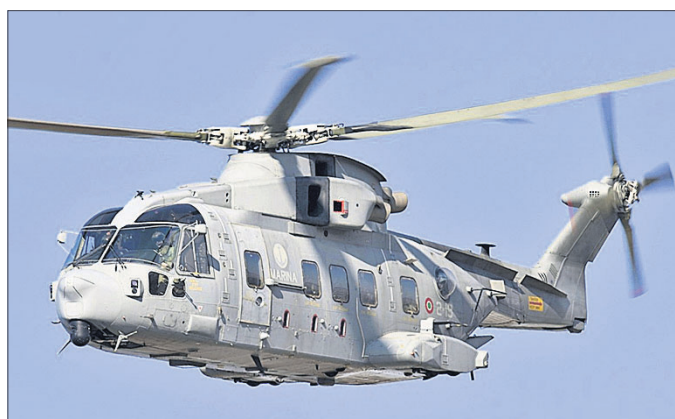
ଚାର୍ଜିଟରେ ସିବିଆଇ ଅଗଷ୍ଟା ଷ୍ଟେସ୍‌ଲାଇଟ୍ ହେଲିକପ୍ଟର କିଶା ଦୁର୍ଘଟିରେ ଯେଉଁମାନେ ସବୁ ନିଷ୍ପତ୍ତି ନେଇଥିଲେ, ସେମାନଙ୍କ ବିରୋଧରେ ଚାର୍ଜିଟରେ