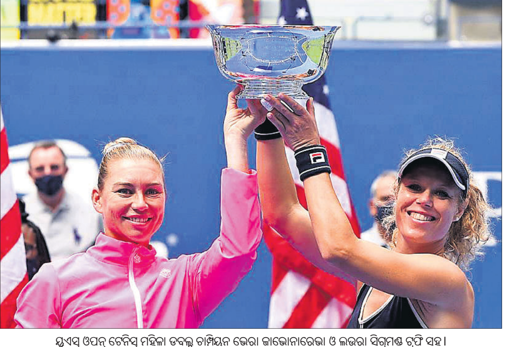
ସ୍ଟୁଏସ୍ ଓପନ୍ ଚେନିସ୍ ମହିଳା ଡବଲ୍ସ ଚାମ୍ପିୟନ ଭେରା ଜାଭୋନାରେଭା ଓ ଲଭରା ସିଗ୍ନାଣ୍ଟ ଚୁଟି ସହ।

ସ୍ଟୁଏସ୍ ଓପନ୍ ଚେନିସ୍ ଗତବର୍ଷ ସ୍ଟୁଏସ୍ ଓପନ୍ରେ ରନର୍ସଅପ ହୋଇଥିଲେ। ସେ ମଧ୍ୟ ଗତ ବୁଜବର୍ଷ ହେବ ଫ୍ରେଣ୍ଡ୍ ଓପନ୍ରେ ଶ୍ରେୟ ରାଫାଲ ନାଡାଲଙ୍କଠାରୁ ପରାସ୍ତ ହୋଇଥିଲେ। ସେହିପରି ଫ୍ରେଡ୍ ନୋଲୀରେ ଅଷ୍ଟ୍ରେଲିଆନ୍ ଓପନ୍ରେ ନୋଭାକ ଡଜୋଭିକଙ୍କଠାରୁ ମଧ୍ୟ ପରାସ୍ତ ହୋଇଥିଲେ। ଥୁମ୍ ଜେଡେରେଭ ପୂର୍ବରୁ ମେଡେଡେଡେ ସାଥୀ ଚୁନାମୋଣ୍ଡରେ ଗୋଟିଏ ହେଲେ ବି ସେଟ୍ ଡ୍ରପ୍ କରି ନ ଥିଲେ। ଜବରଦସ୍ତ ଫର୍ମରେ ଥିଲେ ମଧ୍ୟ ମେଡେଡେଡେଙ୍କୁ ଥୁମ୍ କୌଶସି ସୁଯୋଗ ଦେଇ ନ ଥିଲେ। ଦୀର୍ଘ ୧୬ ବର୍ଷ ପରେ କୌଶସି ଗ୍ରାଣ୍ଡସ୍ଲାମ ସେମିଫାଇନାଲରେ ମାଜକା ବଡ଼ ଖେଳାଳି ନୋଭାକ ଡଜୋଭିକ, ରୋଜର ଫେଡେରେର କିମ୍ ରାଫାଲ ନାଡାଲଙ୍କୁ ଦେଖିବାକୁ ମିଳି ନ ଥିଲା। କୋଭିଡ୍-୧୯ ମହାମାରୀ ପାଇଁ ନାଡାଲ ଏଥର ସ୍ଟୁଏସ୍ ଓପନ୍ରେ ଅଂଶଗ୍ରହଣ ନ କରିବାକୁ ନିଷ୍ପତ୍ତି ନେଇଥିଲେ। ସେହିପରି ଫେଡେର ଆଖିରେ ଅପୋପ୍ଟିକା କରାଯାଇଥିବା କାରଣରୁ ଏହି ଚୁନାମୋଣ୍ଡରେ ଅଂଶଗ୍ରହଣ କରିପାରି ନ ଥିଲେ। ସେହିପରି ଏକ ବିବାଦୀୟ ଡଜୋଭିକୋଭିକ୍ସଙ୍କୁ ବିପକ୍ଷ ଚତୁର୍ଥ ରାଉଣ୍ଡ ମ୍ୟାଚ୍ ଖେଳୁଥିବା ବେଳେ ଅଜାଣତରେ ବଲ୍ରେ ଲାଜର୍ ଜଟ୍ଟି ଆଘାତ ଦେଇ ପ୍ରତିଯୋଗିତାକୁ ବାଟ୍ ପଡିଥିଲେ। ଏହାପୂର୍ବରୁ ଜେଡେରେଭ ଜାଭୋନାରେଭା ସହ ଅଷ୍ଟ୍ରେଲିଆନ୍ ଓପନ୍ ସେମିଫାଇନାଲରେ ପ୍ରବେଶ କରିଥିଲେ ଓ ଏହା ଚାକର ପ୍ରଥମ ମେଜର ସେମିଫାଇନାଲ ଥିଲା। ଅବଶ୍ୟ ସେ ଥୁମ୍ଙ୍କଠାରୁ ପରାସ୍ତ ହୋଇଥିଲେ। ଶନିବାର ମହିଳା ସିଙ୍ଗଲ୍ସ ଫାଇନାଲରେ ନାଡାଲ ଓ ସାକା ଓ ଭିକ୍ଟୋରିଆ ଆଲୋକୋ ଚାଲକା ପାଇଁ ପରସ୍ପରକୁ ଭେଟିବାର କାର୍ଯ୍ୟକ୍ରମ ରହିଛି।