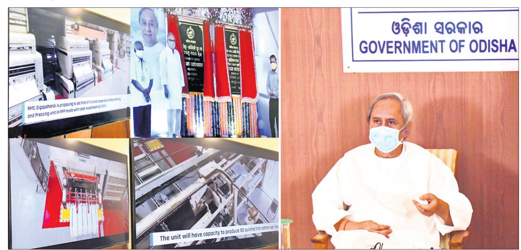
ପୁଖ୍ୟମନ୍ତ୍ରୀ ନବୀନ ପଟ୍ଟନାୟକ ଭିତ୍ତି ଓ କର୍ମଚାରୀଙ୍କୁ ସମ୍ବୋଧନ କରି ବ୍ରହ୍ମପୁର ରେଳ ଓଭର ବ୍ରିଜ୍ ଏବଂ ଦିଗପହଣ୍ଡି ସମବାୟ ଗିନି ମିଲ୍ ଉଦ୍ଘାଟନ କରୁଛନ୍ତି।

ଭୁବନେଶ୍ୱର, ୧୨।୯ (ବୁଧବେଳା) - ପୁଖ୍ୟମନ୍ତ୍ରୀ ନବୀନ ପଟ୍ଟନାୟକ ଶନିବାର ଭିତ୍ତି ଓ କର୍ମଚାରୀଙ୍କୁ ସମ୍ବୋଧନ କରି ବ୍ରହ୍ମପୁର ରେଳ ଓଭର ବ୍ରିଜ୍ ଏବଂ ଦିଗପହଣ୍ଡି ସମବାୟ ଗିନି ମିଲ୍ ଉଦ୍ଘାଟନ କରିଛନ୍ତି। ଏହି ଅବସରରେ ପୁଖ୍ୟମନ୍ତ୍ରୀ କହିଛନ୍ତି, ଗଞ୍ଜାମ ଲୋକମାନଙ୍କ ସହଯୋଗ ଯୋଗୁଁ ଜିଲ୍ଲାରେ କୋଭିଡ୍-୧୯ ସଂକ୍ରମଣ ହ୍ରାସ ପାଇଛି।