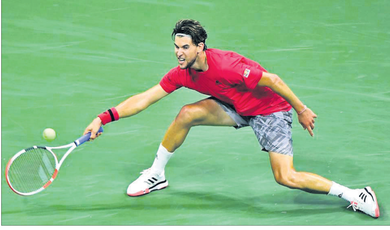
ସ୍ଟୁଏସ୍ ଓପନ୍ ଗ୍ରାଣ୍ଡସ୍ଲାମ ପୁରୁଷ ସିଙ୍ଗଲ୍ସ ସେମିଫାଇନାଲ ଅବସରରେ ଆଲେକ୍ସାନ୍ଦର ଜେଡେରେଭ ଓ ଡୋମିନିକ୍ ଥୁମ୍