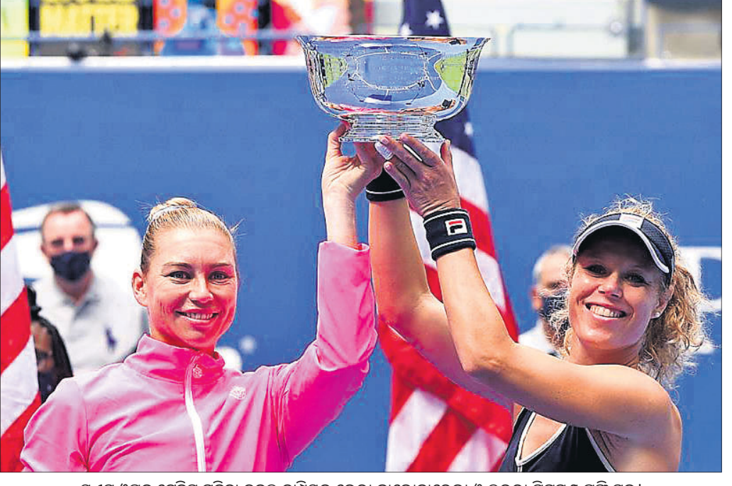
ଝୁଏସ୍ ଓପନ୍ ଚେନିସ୍ ମହିଳା ଡବଲ୍ସ ଚାମ୍ପିୟନ ଭେରା ଜାଭୋନାରେଭା ଓ ଲଭରା ସିଗ୍ନାଣ୍ଟ ଚୁମ୍ପିୟନ ହେବାର ଗୌରବ ଅର୍ଜନ କରିଛନ୍ତି।

ଝୁଏସ୍ ଓପନ୍ (ଏସି) ମ୍ୟାଚ୍ରେ ଭ୍ରମଣକାରୀ ଅଷ୍ଟ୍ରେଲିଆ ୧୯ ରନରେ ବିଜୟୀ ହୋଇଛି। ଅଷ୍ଟ୍ରେଲିଆ ନିଜେ ଫାଇନାଲ ଓ ଲେନ୍ ମ୍ୟାକ୍ଡେଲ୍ସଙ୍କ ଦମ୍ଭାବର ବ୍ୟାଟିଂ ବଳରେ ୫୦ ଓଭରରେ ୯ ଉଇକେଟ୍ ହରାଇ ୨୯୪ ରନ ସଂଗ୍ରହ କରିଥିଲା। ଜବାବରେ ଇଂଲଣ୍ଡ ୯ ଉଇକେଟ୍ ହରାଇ ୨୭୫ ରନରେ ସାମିତ ରହି ପରାସ୍ତ ହୋଇଥିଲା। ଏଥିସହ ୩ ମ୍ୟାଚ୍ ବିଶିଷ୍ଟ ଏହି ସିରିଜରେ ଅଷ୍ଟ୍ରେଲିଆ ୧-୦ରେ ଅଗ୍ରଣୀ ହାସଲ କରିଛି। ଅଷ୍ଟ୍ରେଲିଆ ଦ୍ରୁତ ବୋଲର ଜୋଶ ହଜେଲଉଡ୍ ଚୁପାୟା ସିଡ୍ ଦି ମ୍ୟାଚ୍ ବିବେଚିତ ହୋଇଛନ୍ତି। ୨୯୫ ରନ କାର୍ଗେଟ୍ରେ ପିଛା କରି ଇଂଲଣ୍ଡର ଜିମି ବେୟାରଣ୍ଟୋ ଓ ସାମ ବିଲିଙ୍ଗ୍ସ ଜବରଦସ୍ତ ବ୍ୟାଟିଂ କରିଥିଲେ ମଧ୍ୟ ଅନ୍ୟମାନେ ବିଫଳ ହୋଇଥିଲେ। ବିଲିଙ୍ଗ୍ସ ୧୧୦ ବଲର ସମ୍ମୁଖୀନ ହୋଇ ୧୪ ଚୌକା ଓ ୨ ଛକା ସହ ୧୧୮ ରନର ଶତକୀୟ ପାଲି ଖେଳିଥିଲେ ମଧ୍ୟ ଏହା କାମରେ ଆସି ନ ଥିଲା। ସେହିପରି ବେୟାରଣ୍ଟୋ ୮୪ ରନର ଅଧିକତକୀୟ ପାଲି ଖେଳିଥିଲେ।