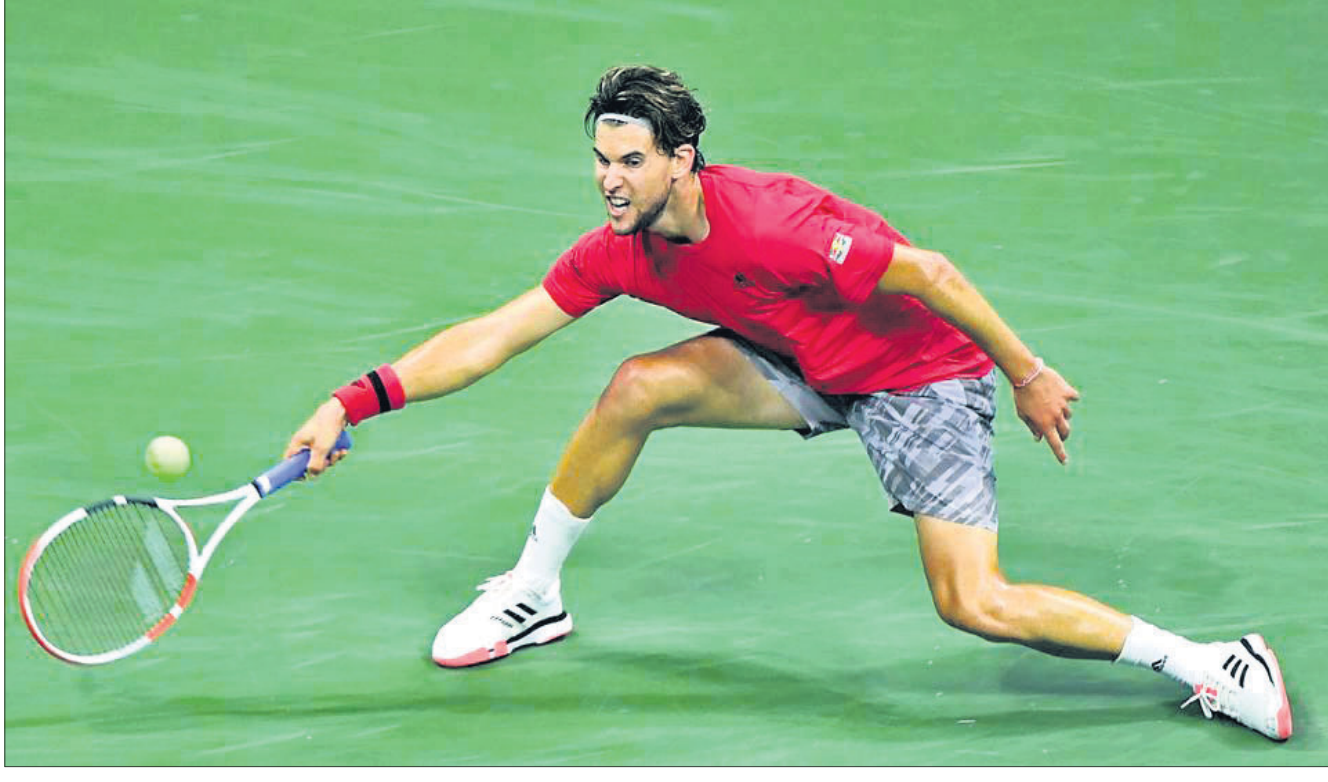
ଝୁଏସ୍ ଓପନ୍ ଗ୍ରାଣ୍ଡସ୍ଲାମ ପୁରୁଷ ସିଙ୍ଗଲ୍ସ ସେମିଫାଇନାଲ ଅବସରରେ ଆଲେକ୍ସାନ୍ଦର ଜେଡେରେଭ ଓ ଡୋମିନିକ୍ ଥୁମ୍