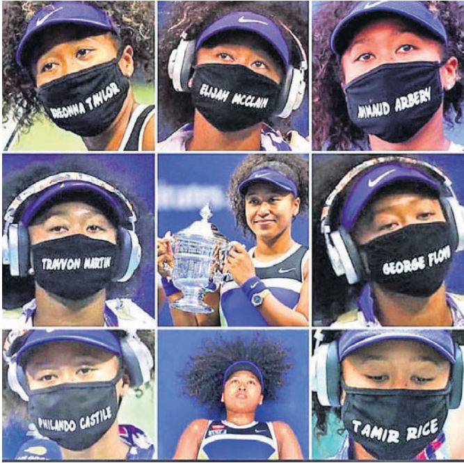
ସାତଟି ମାସରେ ଭିନ୍ନଭିନ୍ନ ମାସ୍ ପରିଧାନ କରିଥିଲେ ତ୍ରୁଟି ବିଜୟିନୀ ଓସାକା।

ଏକ ହେଲିକାପ୍ଟର ଦୁର୍ଘଟଣାରେ ବ୍ରାଏଣ୍ଡଙ୍କ ପୁତୁରାବନ୍ଧୁ କରିଥିଲେ।