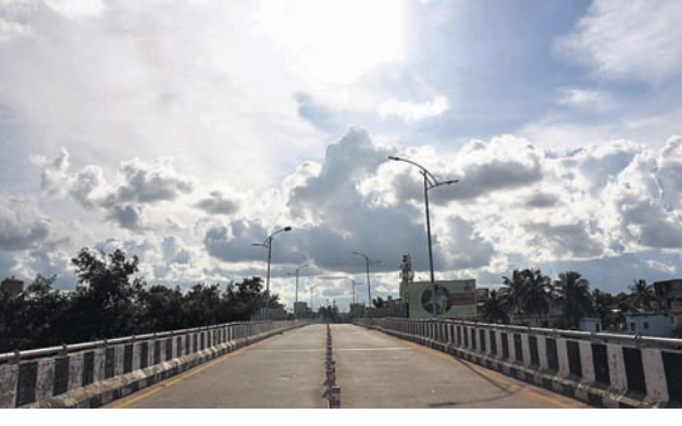
ଅପରାହ୍ଣରେ ଭୁବନେଶ୍ୱର ସତ୍ୟନଗର ଅଞ୍ଚଳରେ ହେଉଥିବା ବର୍ଷା, ସେପଟେ ବମିଖାଲ ଓଭରବ୍ରିଜ୍ ଉପରେ ବାଦଲ ଭିତରୁ ଚଢ଼ି ବରୁଣ ବାମ୍ଛି କିରଣ।