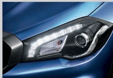
Sharp & Crystalline LED Projector Headlamps with LED DRLs