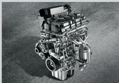
New 1.5L Petrol Engine

Scan the QR code for a 3D AR experience of the S-Cross.