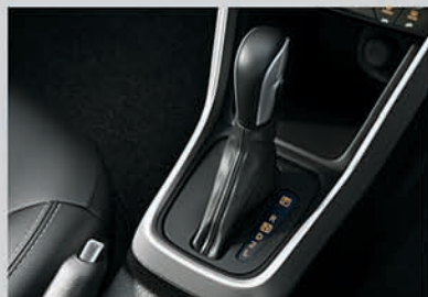
Now available with Automatic Transmission