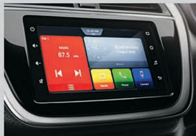
New Smartplay Studio with Android Auto & Apple Carplay*