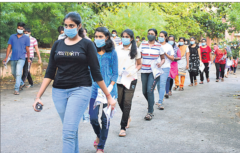
ଗୋବାରାଇଲ ଗୁଡ଼ିଆ ବେପାରୀଙ୍କ ଠାରୁ ବର୍ଷା ସମ୍ଭବନା