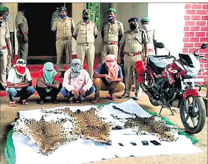
ଜବତ ବାୟଛାଲ ସହ ଗିରଫ ଅଭିଯୁକ୍ତମାନେ ।