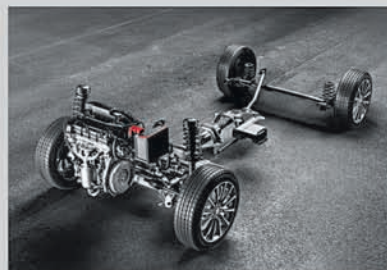
Smart Hybrid Technology