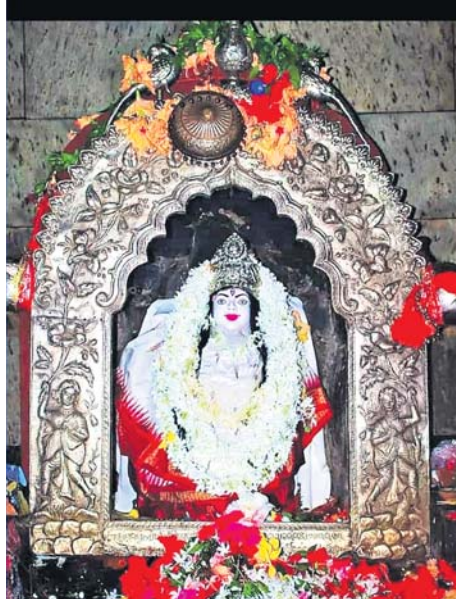
ସୁବର୍ଣ୍ଣପୁରର ମା' ସୁରେଶ୍ୱରୀ ।