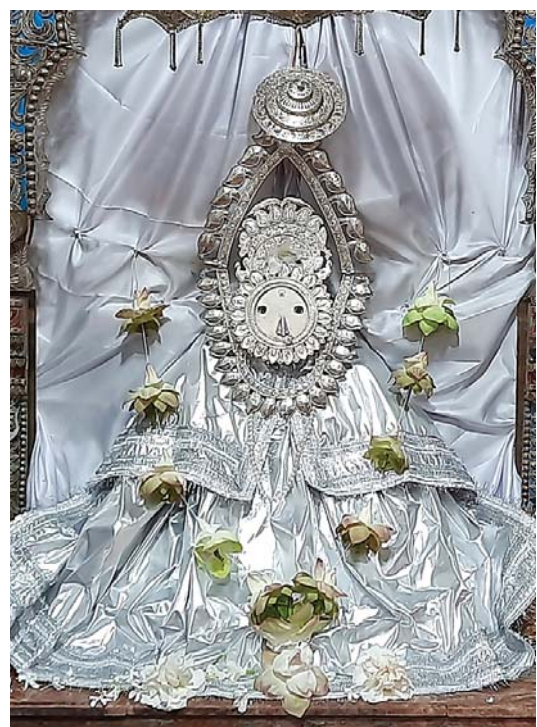
ବରଗଡ଼ର ମା' ସମଲେଶ୍ୱରୀ ।