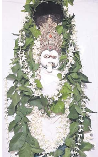
ସମଲପୁରର ମା' ପାଟଣେଶ୍ୱରୀ ।