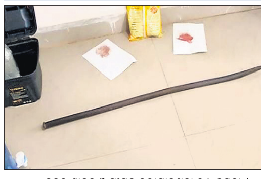
ଜବତ ଶାଢ଼ୀ ଓ ସଂଗ୍ରହ କରାଯାଇଥିବା ରକ୍ତ ନମୁନା ।

ଶ୍ରେଣୀର ଛାତ୍ର। ସେମାନଙ୍କୁ ଲୁଚାଇଲାକଲ୍ ଜଷ୍ଟିସ୍ ବୋର୍ଡରେ ହାଜର କରାଯିବା ପରେ ବ୍ରହ୍ମପୁରସ୍ଥିତ ବାଳ ସୁଧାକରକୁ ଶୁକ୍ରବାର ପଠାଯିବ।