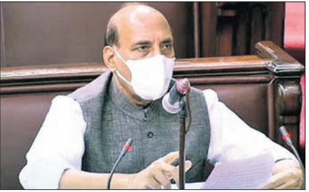
ନୂଆଦିଲ୍ଲୀ, ୧୭/୯ (ପି.ଟି.)

ରାଜ୍ୟ ସଭାରେ ବିବୃତି ରଖିଲେ ପ୍ରତିରକ୍ଷା ମନ୍ତ୍ରୀ