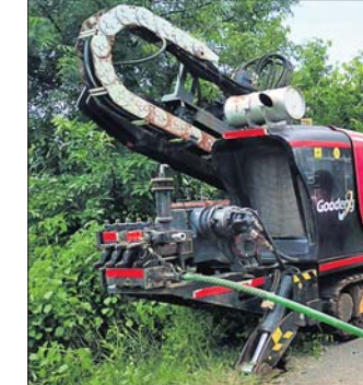
ମେଶିନ ସାହାଯ୍ୟରେ ରାସ୍ତା ତଳେ କେବୁଲ୍ ବିଛା ହେଉଛି ।

କଳାହାଣ୍ଡି ଜିଲ୍ଲା କୋକସରା ବ୍ଲକର ଏକ ମୁଖ୍ୟ ରାସ୍ତା ହେଉଛି କାଉଡୋଲାକୁ ଲଢୁଗାଁକୁ ସଂଯୋଗ କରୁଥିବା ଗ୍ରାମ୍ୟ ଉନ୍ନୟନ ରାସ୍ତା । ଏହି ରାସ୍ତା ମରାମତି ଆଭାବରୁ ଏବେ ଖାଲଖମା ସହ ଅଳ୍ପ ବର୍ଷ ହେଲେ ପାଣି କାବୁଥିବାରୁ ଭାଙ୍ଗି ହୋଇଯାଇଛି । କାଉଡୋଲାକୁ ଲଢୁଗାଁ ପ୍ରାୟ ୬ କି.ମି. ରାସ୍ତା ମରାମତି ପାଇଁ ଅଞ୍ଚଳବାସୀ ଦାବି କରି ଆସୁଛନ୍ତି । ଏବେ ଏହି ରାସ୍ତାରେ ଏକ ବେସରକାରୀ ଟେଲିକମ୍ କମ୍ପାନୀ ମଧ୍ୟରୁ କେବୁଲ୍ ପକା ଚାଲିଛି । ହେଲେ ଧର୍ମଗତ୍ର ଗ୍ରାମ୍ୟ