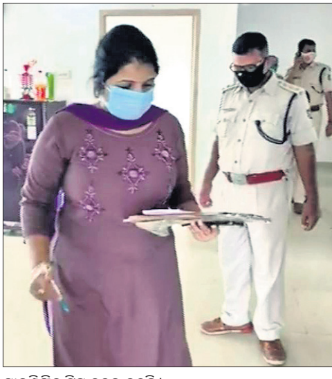
ସାଇକ୍ଲିଷ୍ଟ ଚଳୁ ବେଳେ କରୁଛି।