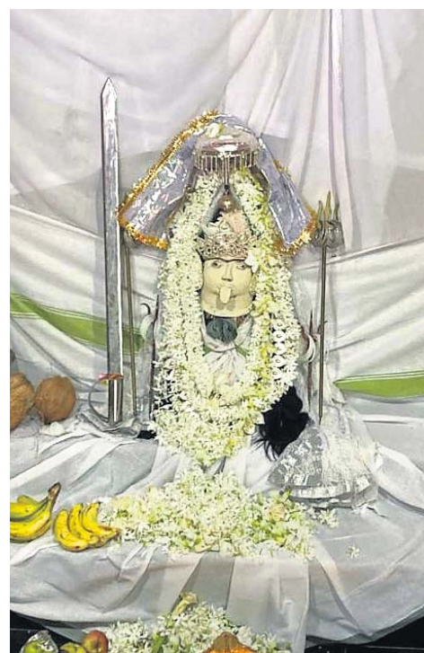
ସମଲପୁର ଚାଉଁରପୁରର ମା' ସମଲେଇ ।