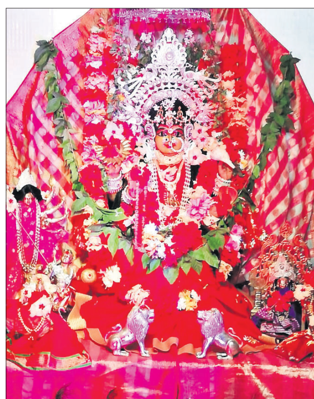
ମା' ସିଦ୍ଧିଦାତ୍ରୀଙ୍କ ଇନ୍ଦ୍ରାଣୀ ବେଶରେ ଭଜନ ସମୟରେ