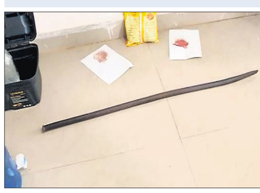
ଜବତ ଶାବଳ ଓ ସଂଗ୍ରହ କରାଯାଇଥିବା ରକ୍ତ ନମୁନା ।

ଭୁବନେଶ୍ୱରରେ ହାତରେ କରାଯିବା ପରେ ବ୍ରହ୍ମପୁରସ୍ଥିତ ବାଳ ସୁଧାରଗୃହକୁ ଶୁକ୍ରବାର ପଠାଯିବ।