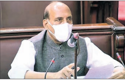
ରୁଆଦିଲ୍ଲା, ୧୭।୯ (ପି.ଟି.)

ରାଜ୍ୟ ସଭାରେ ବିବୃତି ରଖିଲେ ପ୍ରତିରକ୍ଷା ମନ୍ତ୍ରୀ