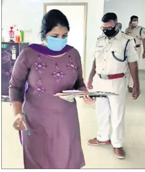
ସାଲକ୍ଷିପିଟ୍ଟି ଚିମ୍ପି ତଦନ୍ତ କରୁଛି।