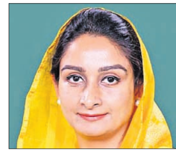
ହର୍ଷିମରତ କୌର ବାଦଲ

କୃଷି ଓ କୃଷକ ବିଲକୁ ବିରୋଧ କରି ଗୁରୁବାର କେନ୍ଦ୍ରମନ୍ତ୍ରୀ ହର୍ଷିମରତ କୌର ବାଦଲ ମୋଦି ସରକାରରୁ ଇସ୍ତଫା ଦେଇଛନ୍ତି। କେନ୍ଦ୍ର ସରକାରଙ୍କ ଦ୍ୱାରା କୃଷି ସଂକ୍ରାନ୍ତରେ ଅଣାଯାଇଥିବା ନୀତି ବିଧେୟକ କୃଷକ ବିରୋଧୀ ହୋଇଥିବା ଦର୍ଶାଇ ଶିରୋମଣି ଅକାଳି ଦଳ (ଏସ୍‌ଏଚ୍) ସଭାପତି ସୁଖବୀର ସିଂ ବାଦଲ କହିଥିଲେ ଯେ, ତାଙ୍କ ଦଳକୁ ମନ୍ତ୍ରୀ ଥିବା ହର୍ଷିମରତ ଶୁଭଚିନ୍ତା ଇସ୍ତଫା ଦେବେ। ଏହା କହିବାର କିଛି ଘଣ୍ଟା ପରେ ମୋଦି ସରକାରଙ୍କ ମନ୍ତ୍ରୀପଦକୁ ହର୍ଷିମରତ