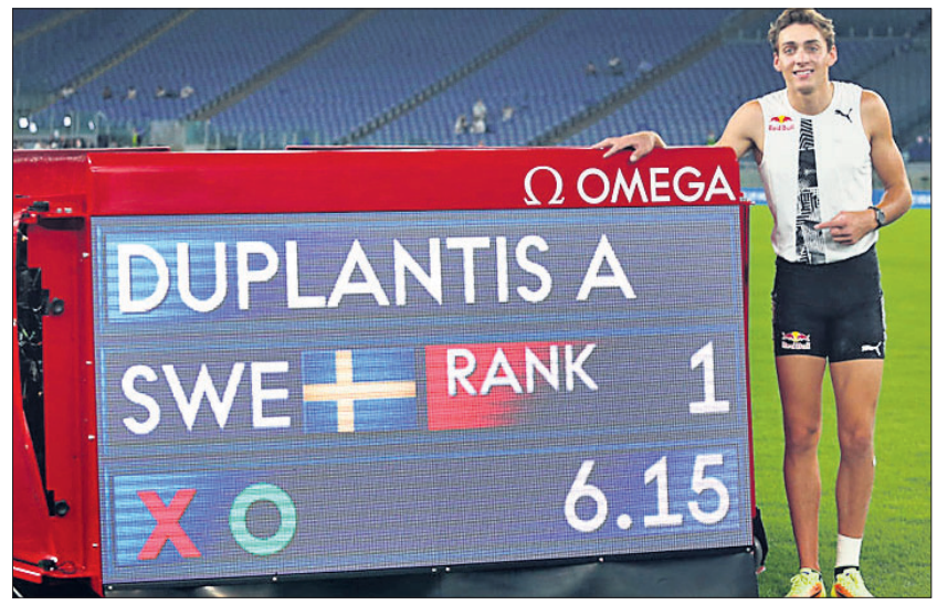
ସର୍ବୋଚ୍ଚ ବୁଦ୍ଧିଜୀବୀ ୨୬ ବର୍ଷର ପୁରୁଣା ରେକର୍ଡ ଭାଙ୍ଗିବା ପରେ ଆର୍ମାଣ୍ଡ ଡୁପ୍ଲାଣ୍ଟିସ୍ ।

ସ୍ୱିଡିଶ ପୋଲ୍ ଭଲ୍ଡର ଆର୍ମାଣ୍ଡ ଡୁପ୍ଲାଣ୍ଟିସ୍ ଆଉଟ୍ ଡୋର୍ରେ ସର୍ବୋଚ୍ଚ ବୁଦ୍ଧିଜୀବୀ ଦୀର୍ଘ ୨୬ ବର୍ଷର ପୁରୁଣା ରେକର୍ଡକୁ ଭଙ୍ଗ କରିଦେଇଛନ୍ତି । ରୋମ୍ରେ ଅନୁଷ୍ଠିତ ଗୋଲ୍ଡେନ ଗାଲ୍ ପିଚ୍ଚୋ ମେନିଆ ମିଚ୍ରେ ହିଟାୟ ପ୍ରତିଯୋଗିତାରେ ସେ ୬ ମିଟର, ୧୫ ସେଣ୍ଟିମିଟର (୨୦ ଫୁଟ, ୨ଇଞ୍ଚ) ଦୂର କରି ଏହି କାର୍ତ୍ତିମାନ ଅର୍ଜନ କରିଛନ୍ତି । ପୂର୍ବରୁ ବୁଦ୍ଧିଜୀବୀ ୧୯୯୪ ଜୁଲାଇରେ ସେଣ୍ଟିରେଠାରେ ୬.୧୪ ମିଟର (୨୦ ଫୁଟ, ୧୧/୨ ଇଞ୍ଚ)ରେ ଏହି ରେକର୍ଡର ଅଧିକାରୀ ହୋଇଥିଲେ । ମଣ୍ଡୋ ତାଙ୍କ ନାମରେ ପରିଚିତ ଡୁପ୍ଲାଣ୍ଟିସ୍ ଆୟୁର୍ବି ମଧ୍ୟ ଇନ୍ଡୋର ବିଶ୍ୱ ରେକର୍ଡ (୬.୧୮ ମିଟର)ର ଅଧିକାରୀ । ଗ୍ଲାସଗୋରେ ଫେବୃଆରୀରେ ସେ ଏହି କାର୍ତ୍ତିମାନ ଅର୍ଜନ କରିଥିଲେ । ୨୦ ବର୍ଷୀୟ ଡୁପ୍ଲାଣ୍ଟିସ୍ କିନ୍ତୁ ଯୁକ୍ତରାଷ୍ଟ୍ର ଆମେରିକାରେ କର୍ତ୍ତୃପ୍ରସାଣ କରିବା ସହ ସେଠାରେ ବଢିଛନ୍ତି । ପ୍ରଥମ ପ୍ରତିଯୋଗିତାରେ ସେ ରେକର୍ଡର ନିକଟତର ହୋଇଥିଲେ । ହିଟାୟ ପ୍ରତିଯୋଗିତାରେ ସେ କ୍ଲିଆର କରିଥିଲେ । ଆଉଟ୍ ଡୋର୍ରେ ବିଶ୍ୱ ରେକର୍ଡ ପ୍ରତିଷ୍ଠା କରିବା ଲାଗି ଯଦିଓ ତାଙ୍କର ଲକ୍ଷ୍ୟ ରହିଥିଲା, ହେଲେ ଏଥିରେ ସେ ସଫଳ ହୋଇପାରିବେ ବୋଲି ତାଙ୍କର ବିଶ୍ୱାସ ନ ଥିଲା ।