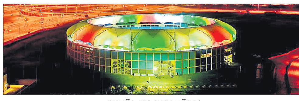
ଆରୁଧାସି ଶେଖ୍ ଜାୟେଦ ଷ୍ଟାଡିୟମ ।

ଷ୍ଟାଡିୟମରେ ଅନୁଷ୍ଠିତ ହେବ । ଭାରତୀୟ ସମୟ ରାତି ୭ଟା ୩୦ରେ ଏହି ମ୍ୟାଟ ଆରମ୍ଭ ହେବ । ଆଇପିଏଲ ଇତିହାସରେ ଦୁଇ ସଫଳ ଦଳ ମୁଖାଇ ଛାଡିଆନ୍ତୁ ଓ ଟେନାଲ ସୁପରକିଙ୍ଗ୍ ପରସ୍ପରକୁ ଭେଟିବେ । ମୁଖାଇ ୪ ଓ ଟେନାଲ ୩ ଥର ଚାମ୍ପିୟନ ହୋଇ ସାରିଛନ୍ତି । ଏଥର ମଧ୍ୟ ଏହି ଦୁଇ ଦଳ ଗାଇଟଲ ଫେରାଉଇଟ ଅଛନ୍ତି । ରେହିତ ଶର୍ମା ମୁଖାଇ ଓ ମହେନ୍ଦ୍ର ସିଂ ଧୋନୀ ଟେନାଲ ଦଳର ନେତୃତ୍ୱ ନେଇଛନ୍ତି । ପ୍ରଥମ ମ୍ୟାଟ ପାଇଁ ଟେନାଲ ବିପକ୍ଷରେ ମୁଖାଇର ପଲ ଭାରି ରହିଛି । ରୋହିତଙ୍କ ବ୍ୟତୀତ କୃଷ୍ଣନ ଡିକ୍‌ସ, ସୂର୍ଯ୍ୟକୃମାର ଯାଦବ, ଇଶାନ କିସନ, ହାଦିକ ଓ କୁନାଲ ପାଣ୍ଡ୍ୟ, କିରନ ପୋଲାଡ଼ଙ୍କୁ ନେଇ ମୁଖାଇ ବ୍ୟାଟିଂ ଲାଇନ୍ ବେଶ୍ ଶକ୍ତିଶାଳୀ । ଯଶପ୍ରୀତ ତୁମ୍ବାରାଜ ସହ ଡ୍ରେଷ୍‌ସିଂ ଓ ନାଥନ କୁଲିନ୍-ନାଲକ୍ ଉପସ୍ଥିତି ଦଳର ବୋଲିଂ ବିଭାଗକୁ ଶାଣିତ କରିଛି । ଅପରପକ୍ଷରେ ବ୍ୟକ୍ତିଗତ କାରଣଯୋଗୁ ଆଇପିଏଲରେ ସୁରେଶ ରାଜନାକ ଅନୁପସ୍ଥିତି କରିବେ ।