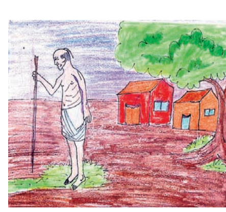
ନିଷ୍ଠା ଦାଶ କ୍ୱାସ-୫, ସେଷ୍ଟ ଜାତିଅର କିନ୍ନ, ବାଲିପୁଟ, ପୁରୀ