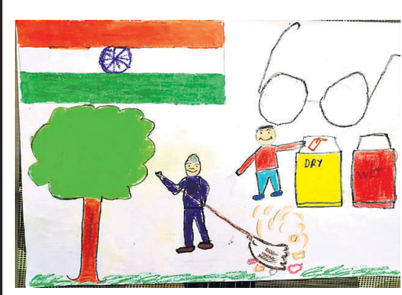
ଅନମୋଲ ଅନିକେତ କ୍ୱାସ-୧, ଦିଲ୍ଲୀ ପବ୍ଲିକ୍ ସ୍କୁଲ, ବିଶାଖାପାଟଣା, ଆନ୍ଧ୍ରପ୍ରଦେଶ