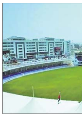
ଶାରଜା କ୍ରିକେଟ୍ ଷ୍ଟାଡ଼ିୟମ

ସେହିପରି ଜଣେ ପେସାଦାର ଖେଳାଳି ପାଇଁ ଦର୍ଶକଙ୍କ ଉପସ୍ଥିତି ଓ ଅନୁପସ୍ଥିତି ଫରକ ଆଣିବ ନାହିଁ ବୋଲି ପୂର୍ବତନ ପାକିସ୍ତାନ ଖେଳାଳି ଜାଭେଦ ନିଆଁଦାଦ କହିଛନ୍ତି। ଶାରଜାରେ ଖେଳିବାକୁ ଭଲ ଲାଗିଥାଏ ଓ ଏଠାରେ କ୍ରିକେଟ୍ ନେଇ ପ୍ରବଳ ଉତ୍ସାହ ରହିଛି ବୋଲି ଦିଲ୍ଲୀ କ୍ୟାପିଟାଲ୍ ହେଡ୍ କୋର୍ ରିକି ପଣ୍ଡି କହିଛନ୍ତି। ତେବେ ଦର୍ଶକଙ୍କ ଅନୁପସ୍ଥିତିରେ ଖେଳିବା ନିଶ୍ଚିତ ଭାବେ କଷ୍ଟକର ବୋଲି ପୂର୍ବତନ କ୍ରିକେଟର ଦିଲୀପ ଭେଙ୍କସରକାର ମତ ଦେଇଛନ୍ତି। ତେବେ ଏଥର ପରିସ୍ଥିତି ଅଲଗା। ତେଣୁ ଫାକା ଷ୍ଟାଡ଼ିୟମରେ ଖେଳିବାକୁ ପଡ଼ିବ ଓ ଖେଳାଳିମାନଙ୍କୁ ନିଜର ଦକ୍ଷତା ପ୍ରମାଣ କରିବାକୁ ପଡ଼ିବ। ମ୍ୟାଚ୍ ଫିକ୍ସ୍ ଓ ଅଣ୍ଡରଫ୍ଲୋଇଁ ପ୍ରଭାବ କାରଣରୁ ଶାରଜାରେ କ୍ରିକେଟ୍ ବେଶ୍ ବଦନାମ ହୋଇଥିଲା। କିନ୍ତୁ ଏପର୍ଯ୍ୟନ୍ତ କୌଣସି ଅଭିଯୋଗ ପ୍ରମାଣିତ ହୋଇନାହିଁ ବୋଲି ଆୟୋଜକମାନେ କହିଛନ୍ତି। କୌଣସି ମ୍ୟାଚ୍ ବ୍ୟକ୍ତି, ଖେଳାଳି, ଅଫିସିଆଲ୍ ବୋକ୍ସା ସାବ୍ୟସ୍ତ ହୋଇନାହାନ୍ତି ବୋଲି କୁହାଯାଇଛି। ଆଇପିଏଲ୍ ଆରମ୍ଭ ହେବା ପରେ ଆରବର ମରୁଭୂମିରେ ଏବେ କ୍ରିକେଟ୍ ଝଡ଼ ଦେଖିବାକୁ ମିଳିବ ବୋଲି ଆଶା କରାଯାଉଛି।