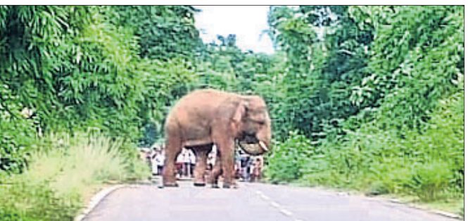
ନାରଗଦାଠାରେ ରାସ୍ତା ମଝିରେ ଛିଡ଼ା ହୋଇଥିବା ହାତୀ।

ଖୋର୍ଦ୍ଧା ଜିଲାର ଗାଙ୍ଗା ବନବିଭାଗ ଅଞ୍ଚଳରେ ଖାଦ୍ୟ ଅନ୍ୱେଷଣରେ ଗାଁ ପୁହାଁ ହେଉଛନ୍ତି ହାତୀପଲ। ଏହିକ୍ରମରେ ଶନିବାର ଅପରାହ୍ଣ ସାଢ଼େ ୪ଟାରେ ନୂଆ ଜଗନ୍ନାଥ ସଡ଼କ ରାସ୍ତା ନାରଗଦାଠାରେ ଏକ ଜଙ୍ଗଲୀ ହାତୀ ଛିଡ଼ା ହୋଇଥିବା ଦେଖିବାକୁ ମିଳିଛି। ଫଳରେ ଭୟ ହାତୀକୁ ଆସୁଥିବା ସମସ୍ତ ଯାନବାହନ ଅଟକି ରହିଥିଲା। ଲୋକଙ୍କ ପାଟି ଶୁଣି ପ୍ରାୟ ୧୧୫ ପରେ ଜଙ୍ଗଲ ଭିତରକୁ ହାତୀଟି ପଳାଇଯାଇଥିଲା।