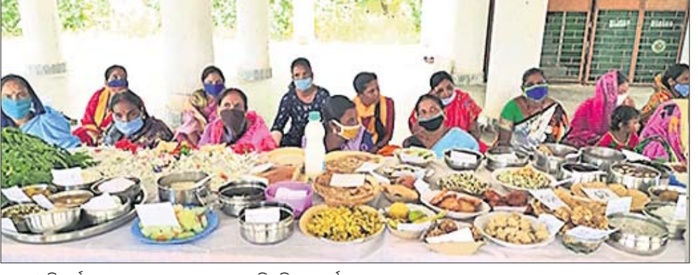
ଅଜନୱାଦି କର୍ମାମାନଙ୍କ ତତ୍ପର୍ୟାୟରେ ଫଳ, ପରିଚରଣ ପ୍ରଦର୍ଶନୀ।

ଜିଲ୍ଲାରେ ୩ ଲକ୍ଷ ୬୫ ହଜାର ୨୨୭ ଜଣଙ୍କ କରୋନା ଟେଷ୍ଟ ହୋଇଥିବା ଜିଲ୍ଲାପାଳ ସୂଚନା ଦେଇଛନ୍ତି।