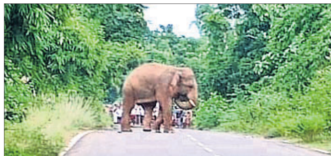
ନାରଗଦାଠାରେ ରାସ୍ତା ମଝିରେ ଛିଡ଼ା ହୋଇଥିବା ହାତୀ।

ନିବାକାରପୁର, ୧୯୮୯ (ଡି.ଏନ୍.ଏ.): ଖୋର୍ଦ୍ଧା ଜିଲା ଟାଙ୍ଗୀ ବନବିଭାଗ ଅଞ୍ଚଳରେ ଖାଦ୍ୟ ଅନ୍ୱେଷଣରେ ଗାଁ ପୁହାଁ ହେଉଛନ୍ତି ହାତୀପଲ। ଏହିକ୍ରମରେ ଶନିବାର ଅପରାହ୍ଣ ସାଢ଼େ ୪ଟାରେ ନୂଆ ଜଗନ୍ନାଥ ସଡ଼କ ରାସ୍ତା ନାରଗଦାଠାରେ ଏକ ଜଙ୍ଗଲୀ ହାତୀ ଛିଡ଼ା ହୋଇଥିବା ଦେଖିବାକୁ ମିଳିଛି। ଫଳରେ ଉଭୟ ପାର୍ଶ୍ୱରୁ ଆସୁଥିବା ସମସ୍ତ ଯାନବାହନ ଅଟକି ରହିଥିଲା। ଲୋକଙ୍କ ପାଟି ଶୁଣି ପ୍ରାୟ ୧୧୫୫ ପରେ ଜଙ୍ଗଲ ଭିତରକୁ ହାତୀଟି ପଳାଇଯାଇଥିଲା।