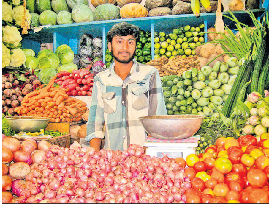
ଗ୍ରାହକଙ୍କ ଅପେକ୍ଷାରେ କଣେ ପରିବା ବ୍ୟବସାୟୀ।

ବ୍ୟତିତ ଅନ୍ୟାନ୍ୟ ପରିବା ଦର ମଧ୍ୟ ବେକାରୁ ହେବାରେ ଲାଗିଛି। କଳାହାଣ୍ଡି ଜିଲ୍ଲାରେ ପିଆଜ ଚାଷ ପୂର୍ଣ୍ଣପେକ୍ଷା ଅଧିକ ଚାଷ ହେଉଛି। ତେବେ ବଜାର ସୁବିଧା ନ ଥିବାରୁ ଚାଷୀ ଏହାକୁ ଅତି କମଦରରେ ବିକ୍ରି କରୁଛନ୍ତି। କାରଣ ଜିଲ୍ଲାରେ ଶୀତଳ ଭଣ୍ଡାର ନାହିଁ। ତେଣୁ ଚାଷୀ ରଖିବା ପିଆଜକୁ ନଷ୍ଟ କରିବା ଅପେକ୍ଷା ଶୀତଳ ଘରରେ ବିକି ଦେଉଛନ୍ତି। ଜିଲ୍ଲା ପ୍ରଶାସନ ପକ୍ଷରୁ ବଜାର ଦର ଉପରେ କୌଣସି କଟକଣା ରହୁ ନ ଥିବାରୁ ଦର ବୃଦ୍ଧି ହୋଇ ବହୁଛି ବୋଲି ଖାଉଟିମାନେ ଅଭିଯୋଗ କରିଛନ୍ତି। ସ୍ଥାନୀୟ ପ୍ରଶାସନ ଏଥିପ୍ରତି ଦୃଷ୍ଟି ଦେବାପାଇଁ ଯାଚାରଖିବାରେ ଦାବି ହେଉଛି।