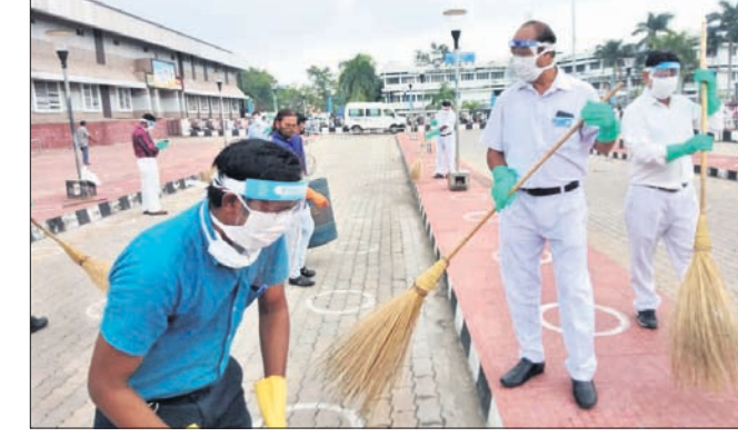
ସମ୍ବଲପୁର ରେଳ ଷ୍ଟେଶନ ସମ୍ପୂର୍ଣ୍ଣରେ ସଫେଦ କରାଯାଇଛି।

ରେଳଯାତ୍ରୀ ଓ ଜନସାଧାରଣଙ୍କୁ ସୁରକ୍ଷା ସମ୍ପନ୍ନ ଭାବରେ ସଫେଦ ପୁଷ୍ଟି କରିବା ଉଦ୍ଦେଶ୍ୟରେ ସଫେଦ ଅଭିଯାନ କରାଯାଇଛି। ସ୍ୱଚ୍ଛ ଷ୍ଟେଶନ କାର୍ଯ୍ୟକ୍ରମରେ ଅଧିକାରୀ ଓ କର୍ମଚାରୀମାନେ ସାମିଲ ହୋଇଥିଲେ। ଏଥିସହ ଷ୍ଟେଶନ ଗୁଡ଼ିକରେ ତତ୍ତ୍ୱବିନ ଯୋଗାଇ ଦିଆଯାଇଛି। ସୋମବାର ଓ ମଙ୍ଗଳବାର ସ୍ୱଚ୍ଛ ରେଳଗାଡ଼ି କାର୍ଯ୍ୟକ୍ରମ ହାତକୁ ନିଆଯିବ ବୋଲି ସୂଚନା ଦିଆଯାଇଛି।