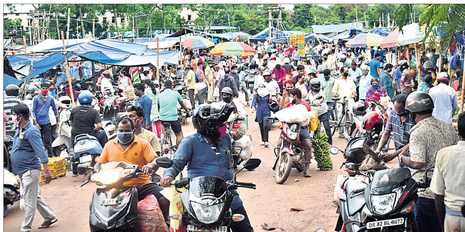
କରୋନା ସଂକ୍ରମଣ ନିୟନ୍ତ୍ରଣ ପାଇଁ କମିଶନରେଟ ପୋଲିସ୍ ଓ ବିଏମ୍ପି ପକ୍ଷରୁ କଡ଼ା ଯାଞ୍ଚ ସହ ଜରମାନା ସତ୍ତ୍ୱେ ରବିବାର ସୁନିଶ୍ଚିତ-୧ ଥଣ୍ଡାୟୀ ପରିବାହନ ହାତରେ ଲୋକଙ୍କ ଭିଡ଼।

ବଲିଉଡ୍ ଅଭିନେତ୍ରୀ ଦିଶା ପଟ୍ଟନାୟକ ଏକ ଫଟୋ ସୋସିଆଲ ମିଡିଆରେ ଭାଇରାଲ ହେବାରେ ଲାଗିଛି। ଯାହାକୁ ଦର୍ଶକମାନେ ବେଶ୍ ପସନ୍ଦ କରିଛନ୍ତି।