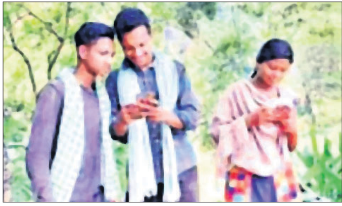
ଛାତ୍ରଛାତ୍ରୀ ମୋବାଇଲରେ ପାଠ ଦେଖୁଛନ୍ତି।

ବିଦ୍ୟୁତ୍ ସେବା ଅପହଞ୍ଚିତ। ମାଓବାଦୀ ଭୟରେ କାମ କରୁନି ଘରୋଇ ମୋବାଇଲ ଚାର୍ଜର। ଫଳରେ ନିୟମିତ ଭାବେ ପଢ଼ା ପାରିନି ମୋବାଇଲ ସେବା। କୌଣସି ଗାଁ ଚ ବୃତ୍ତର କଥା ପାଠାପଢ଼ା, ତତ୍କାଳ ଚଳିଲେ ବି ଆସୁନି ନେଚର୍ସର୍କ। ଫଳରେ ଅନଲାଇନ ପାଠପଢ଼ା ପାଇଁ ନିୟମିତ ଭାବେ ବହୁ ତଳକୁ ଓହ୍ଲାଇଛନ୍ତି ଡକ୍ଟରମାନେ। ଶତାଧିକ ଡକ୍ଟରମାନେ ଛାତ୍ରଛାତ୍ରୀଙ୍କୁ ଉପାଦେୟ କରି ପ୍ରସ୍ତୁତ ହେଉଥିବା ବେଳେ ପ୍ରତିଦିନ ନେଚର୍ସର୍କ ଥିବା ଅଞ୍ଚଳକୁ ଆସି ପଢ଼ା ପାଠା ପଢ଼ି ଘରକୁ ଫେରିବାକୁ ବାଧ୍ୟ ହେଉଛନ୍ତି। ନିୟମିତ ପାଠାପଢ଼ା ପାଇଁ ୧୫ ରାଜ୍ୟ ଗ୍ରାମ, ୮ ହାମଲେଟରେ ଶହେରୁ ଊର୍ଦ୍ଧ୍ୱ ଛାତ୍ରଛାତ୍ରୀ ବିଭିନ୍ନ ଶିକ୍ଷାନୁଷ୍ଠାନରେ ପଢ଼ୁଛନ୍ତି। କେତେକ ଛାତ୍ରଛାତ୍ରୀ ଛୁଟିଦିନରେ ମଧ୍ୟ ଅଧ୍ୟୟନ କରୁଛନ୍ତି। ପଞ୍ଚମରୁ ଆରମ୍ଭ