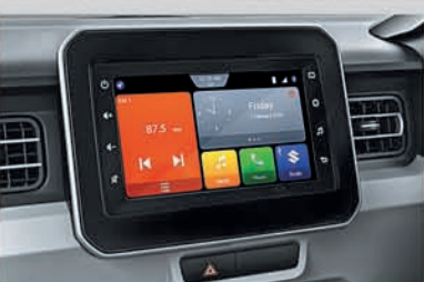
New 17.8 cm Smartplay Studio (Available from Zeta variant onwards)