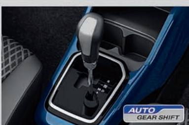
Auto Gear Shift