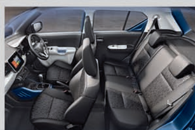
Spacious and Comfortable Interiors