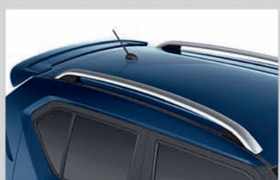
New Rear Spoiler and Roof Rails