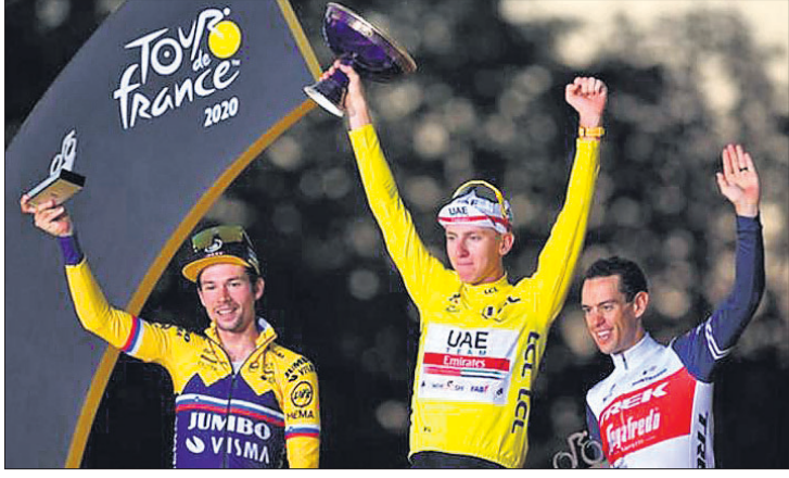
ତୁର ଡି' ପ୍ରାନ୍ତ ୨୦୨୦ ସାଇକେଲ ରେସ୍ ଶେଷରେ ପୋଡିୟମରେ ପୁରସ୍କାର ସହ ଗଡେଜ ପୋଗାକାର (ମଝି), ପ୍ରିକୋକ ରଗଲିକ୍ (ବାମ) ଓ ରିଚି ପୋର୍ଟ (ଡାହାଣ) ।

ବିଶ୍ୱ ଚାମ୍ପିୟନ ମ୍ୟାଡୁ ପେଡରସନଙ୍କ ଆଗରେ ଲାଇନ୍ ଅତିକ୍ରମ କରିଥିଲେ। ବେନେଟ ପଏଣ୍ଟ କ୍ଲାସିଫିକେସନରେ ବିଜୟ ହାସଲ କରିଥିଲେ। ଆୟଲ୍ୟାଣ୍ଡ ଦ୍ୱିତୀୟ