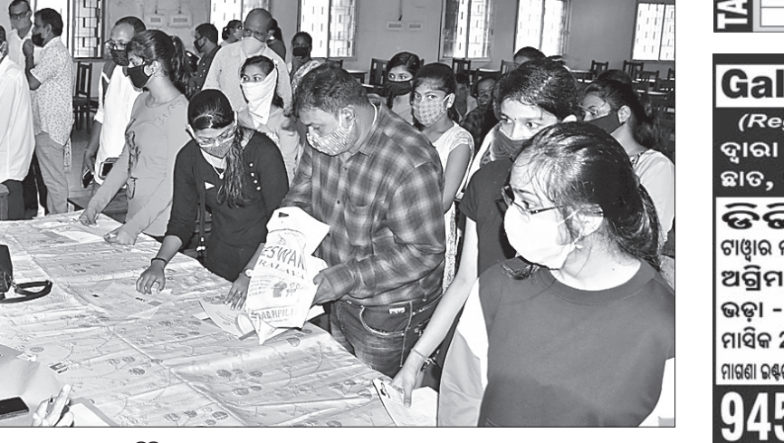
ଭୁବନେଶ୍ୱରସ୍ଥିତ ରମାଦେବୀ ଉଚ୍ଚମାଧ୍ୟମିକ ସ୍କୁଲରେ ନାମଲେଖା ଚାଲିଛି।

ଭୁବନେଶ୍ୱର, ୨୧।୯ (ସ୍ୱାଭାବ) ଯୁକ୍ତ ୨ କଳା, ବିଜ୍ଞାନ, ବାଣିଜ୍ୟ, ଧର୍ମାତ୍ମକ ଓ ସଂସ୍କୃତ ବିଭାଗରେ ନାମଲେଖା ସୋମବାରଠାରୁ ଆରମ୍ଭ ହୋଇଛି। ପ୍ରଥମ ପର୍ଯ୍ୟାୟ କର୍ ଅଫ ମାର୍କରେ ମନୋନୀତ ଛାତ୍ରଛାତ୍ରୀମାନେ ତୁରନ୍ତ ପର୍ଯ୍ୟାୟରେ ସକାଳ ୯ଟାରୁ ଅପରାହ୍ନ ୧ଟା ଓ ଅପରାହ୍ନ ୧ଟା ୩୦ରୁ ୫ଟା ପର୍ଯ୍ୟନ୍ତ ନାମଲେଖୁଛନ୍ତି। ଏହି ପର୍ଯ୍ୟାୟ ନାମଲେଖା ପାଇଁ ୩,୪୬,୬୨୬ ଛାତ୍ରଛାତ୍ରୀଙ୍କୁ ଚାଲିକା ପ୍ରକାଶ ପାଇଥିଲା। କଳାରେ ୨,୨୩,୫୪୫ ଛାତ୍ରଛାତ୍ରୀଙ୍କୁ ତଥା ଯାଇଥିବାବେଳେ ବିଜ୍ଞାନରେ ୮୪,୬୮୯, ବାଣିଜ୍ୟରେ ୨୫,୦୬୨,