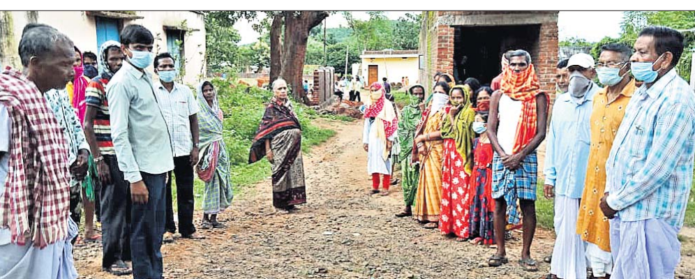
ଉପସ୍ଥିତ ସୁନାପାଳା ସାହିବବା।