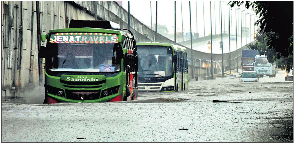
ସୋମବାର ଭୁବନେଶ୍ୱର ଲକ୍ଷ୍ମୀ ନଦୀର ସମ୍ମୁଖ ଜାତୀୟ ରାଜପଥରେ ବର୍ଷା ପାଣିରେ ବୁଡ଼ିଥିବା ବସ।

ଭରପୂର୍ଣ୍ଣ ବନ୍ୟାପ୍ରସାରଣ ଓ ଏହାର ଆଖପାଖ ଅଞ୍ଚଳରେ ପୁଷ୍ଟି ହୋଇଥିବା ଲାଗୁତାପ ଉତ୍ତର ଉପକୂଳ ଓଡ଼ିଶା ଉପରେ କେନ୍ଦ୍ରୀୟତା ହୋଇଛି। ସୋମବାର ଏହା ଅବପାତ (ଡିପ୍ରେସନ)ରେ ପରିଣତ ହୋଇଛି। ଏହାର ପ୍ରଭାବରେ ଦକ୍ଷିଣ ପଶ୍ଚିମ ଚୌମୁଖୀ ବାୟୁ ଅଧିକ ସକ୍ରିୟ ହୋଇଛି। ଲାଗୁତାପ ଯୋଗୁ ରାଜ୍ୟରେ ପ୍ରବଳ ବର୍ଷା ଲାଗି ରହିଛି। ସୋମବାର ସକାଳୁ ହାଲକା ବର୍ଷା ହେଉଥିବା ବେଳେ ଅପରାହ୍ଣକୁ ବର୍ଷା ପରିମାଣ ବୃଦ୍ଧି ହୋଇଛି। ଖୋର୍ଦ୍ଧା, ପୁରୀ, କଟକ, ଜଗତସିଂହପୁର, ଯାଜପୁର, କେନ୍ଦ୍ରାପଡ଼ା, ଭଦ୍ରକ, ବାଲେଶ୍ୱର, ଡେଙ୍କାନାଳ, ଅନୁଗୋଳ, କୋରାପୁଟ, ମାଲକାନଗିରି, ବରଗଡ଼, ଝାରସୁଗୁଡ଼ା ଆଦି ଜିଲ୍ଲାରେ ରାତି ତମାମ ପ୍ରବଳ ବର୍ଷା ଲାଗି ରହିଛି। ବର୍ଷା ଯୋଗୁ ବିଭିନ୍ନ ତଳିଆ ଅଞ୍ଚଳରେ ପାଣି ଜମି ରହିବା ସହ ସାଧାରଣ ଜୀବନ ଯାତ୍ରା ବ୍ୟାହତ ହୋଇଛି। ଲାଗୁତାପ ଯୋଗୁ ଛତିଶଗଡ଼ରେ ପ୍ରବଳ ବର୍ଷା ହେଉଛି। ହାରାକୂଦ ଜଳ ଭଣ୍ଡାର ଭିତରକୁ ବହୁ ପରିମାଣର ଜଳ ପ୍ରବେଶ କରୁଛି। ଏହାକୁ ଦୃଷ୍ଟିରେ ରଖି ଭୁବନେଶ୍ୱର ଯୋଗେ ପାଣି ନିଷ୍କାସନ କରାଯାଇଛି। ହାରାକୂଦରେ ଜଳଧାରଣ କ୍ଷମତା ୬୩୦ ଫୁଟ ଥିବା ବେଳେ ଜଳଭଣ୍ଡାରରେ ୬୨୮.୬୫ ଫୁଟ ପାଣି ରହିଛି। ପ୍ରବଳ ବର୍ଷାକୁ ଦେଖି ଭୁବନେଶ୍ୱରରେ ବେଳ ୪୭ ହଜାର ୩୯୮ କ୍ୟୁସେକ ଜଳ ମହାନଦୀକୁ ଛତା ଯାଇଛି।