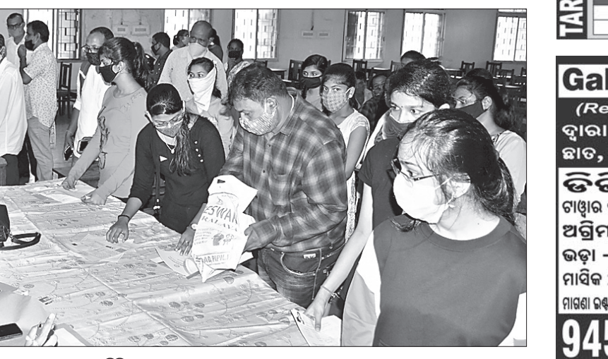
ଭୁବନେଶ୍ୱରସ୍ଥିତ ରମାଦେବୀ ଉଚ୍ଚମାଧ୍ୟମିକ ସ୍କୁଲରେ ନାମଲେଖା ଚାଲିଛି।

ଭୁବନେଶ୍ୱର, ୨୧।୯ (ସ୍ୱାଭାବ) ଯୁକ୍ତ ୨ କଳା, ବିଜ୍ଞାନ, ବାଣିଜ୍ୟ, ଧର୍ମାତ୍ମକ ଓ ସଂସ୍କୃତ ବିଭାଗରେ ନାମଲେଖା ସୋମବାରଠାରୁ ଆରମ୍ଭ ହୋଇଛି। ପ୍ରଥମ ପର୍ଯ୍ୟାୟ କର୍ ଅଫ ମାର୍କରେ ମନୋନୀତ ଛାତ୍ରଛାତ୍ରୀମାନେ ତୁରନ୍ତ ପର୍ଯ୍ୟାୟରେ ସକାଳ ୯ଟାରୁ ଅପରାହ୍ନ ୧ଟା ଓ ଅପରାହ୍ନ ୧ଟା ୩୦ରୁ ୫ଟା ପର୍ଯ୍ୟନ୍ତ ନାମଲେଖୁଛନ୍ତି। ଏହି ପର୍ଯ୍ୟାୟ ନାମଲେଖା ପାଇଁ ୩,୪୬,୬୨୬ ଛାତ୍ରଛାତ୍ରୀଙ୍କୁ ଚାଲିକା ପ୍ରକାଶ ପାଇଥିଲା। କଳାରେ ୨,୨୩,୫୪୫ ଛାତ୍ରଛାତ୍ରୀଙ୍କୁ ଡକା ଯାଇଥିବାବେଳେ ବିଜ୍ଞାନରେ ୮୪,୬୮୯, ବାଣିଜ୍ୟରେ ୨୫,୦୬୨,