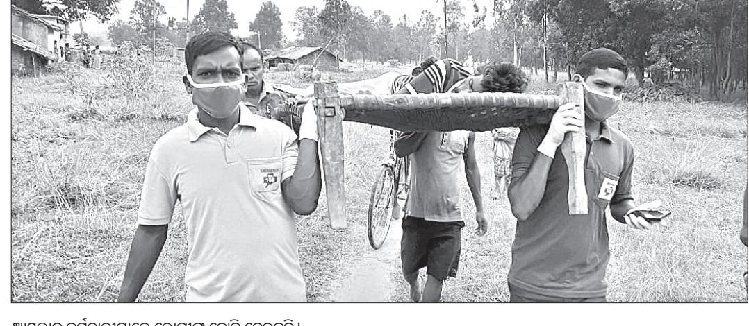
ଆୟୁଲ୍ଲାଦ୍ୱ କର୍ମଚାରୀମାନେ ରୋଗୀଙ୍କୁ ବୋହି ନେଉଛନ୍ତି।

ଭୁବନେଶ୍ୱର, ୨୧।୯ (ସ୍ୱାଭାବ): କୋଭିଡ-୧୯ ମହାମାରୀ ସମୟରେ ରାଜ୍ୟକୁ କିପରି ଅଧିକ ପୁଣିନିବେଶକାରୀଙ୍କୁ ଆକୃଷ୍ଟ କରାଯାଇ ପାରିବ ସେ ନେଇ ସମସ୍ତ ବିଭାଗ ବ୍ୟବସାୟ ସଂସ୍ଥାର ଆକ୍ଷେପ ପୁନଃ(ବିଆରଏପି)କୁ ତୁରନ୍ତ ପ୍ରଚାର କରିବାକୁ ନିର୍ଦ୍ଦେଶ ଦେଇଛନ୍ତି। ସୋମବାର ମୁଖ୍ୟ ଶାସନ ସଚିବଙ୍କ ଅଧିକାରୀଙ୍କୁ ଲୋକସେବା ଭବନ ଠାରେ ଭିଡିଓ କନଫରେନ୍ସ କରିଆରେ ରାଜ୍ୟର ବ୍ୟବସାୟିକ ସଂସ୍ଥାରେ ସମାକ୍ଷା କରାଯାଇଥିଲା। ସମସ୍ତ ନାଗରିକ ସେବାଗୁଡ଼ିକୁ ଅନଲାଇନରେ କରିବାକୁ ମୁଖ୍ୟ ଶାସନ ସଚିବ ବିଭାଗଗୁଡ଼ିକୁ ପରାମର୍ଶ ଦେଇଛନ୍ତି।