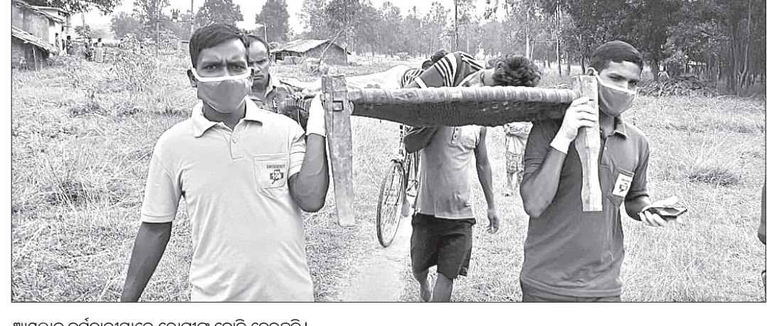
ଆୟୁଲ୍ଲାଦ୍ୱ କର୍ମଚାରୀମାନେ ରୋଗୀଙ୍କୁ ବୋହି ନେଉଛନ୍ତି।

ଭୁବନେଶ୍ୱର, ୨୧।୯ (ସ୍ୱାଭାବ): କୋଭିଡ-୧୯ ମହାମାରୀ ସମୟରେ ରାଜ୍ୟକୁ କିପରି ଅଧିକ ପୁଣିନିବେଶକାରୀଙ୍କୁ ଆକୃଷ୍ଟ କରାଯାଇ ପାରିବ ସେ ନେଇ ସମସ୍ତ ବିଭାଗ ବ୍ୟବସାୟ ସଂସ୍ଥାର ଆକ୍ଷେପ ପୁନଃ(ବିଆରଏପି)କୁ ତୁରନ୍ତ ପ୍ରଚାର କରିବାକୁ ନିର୍ଦ୍ଦେଶ ଦେଇଛନ୍ତି। ସୋମବାର ମୁଖ୍ୟ ଶାସନ ସଚିବଙ୍କ ଅଧିକାରୀଙ୍କୁ ଲୋକସେବା ଭବନ ଠାରେ ଭିଡିଓ କନଫରେନ୍ସ କରିଆରେ ରାଜ୍ୟର ବ୍ୟବସାୟିକ ସଂସ୍ଥାର ସମାକ୍ଷା କରାଯାଇଥିଲା। ସମସ୍ତ ନାଗରିକ ସେବାଗୁଡ଼ିକୁ ଅନଲାଇନରେ କରିବାକୁ ମୁଖ୍ୟ ଶାସନ ସଚିବ ବିଭାଗଗୁଡ଼ିକୁ ପରାମର୍ଶ ଦେଇଛନ୍ତି।