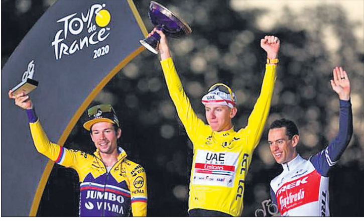
ତୁରୁ ଡି' ପ୍ରାନ୍ତ ୨୦୨୦ ସାଇକେଲ ରେସ୍ ଶେଷରେ ପୋଡିୟମରେ ପୁରସ୍କାର ସହ ଗଡେଟ ପୋଗାକାର (ମଝି), ପ୍ରିକୋକ ରଗଲିକ୍ (ବାମ) ଓ ରିଚି ପୋର୍ଟ (ଡାହାଣ)।

ଦିଶ୍ଵ ରାମ୍ପିୟନ ମ୍ୟାଡୁ ପେଡରସନଙ୍କ ଆଗରେ ଲାଇନ୍ ଅତିକ୍ରମ କରିଥିଲେ। ବେନେଟ ପଏଣ୍ଟ କ୍ଲାଇମିକେଶନରେ ବିଜୟ ହାସଲ କରିଥିଲେ। ଆୟଲ୍ୟାଣ୍ଡ ଦ୍ଵିତୀୟ