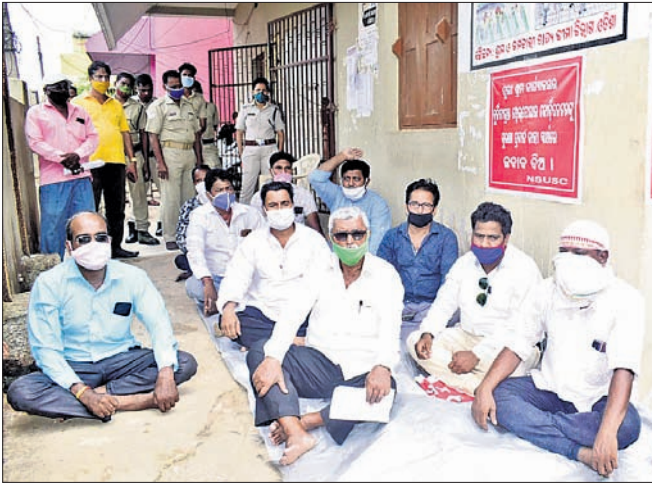
ମଞ୍ଚ ଶ୍ରମ ଆୟତ୍ତଙ୍କ କାର୍ଯ୍ୟାଳୟ ସମ୍ମୁଖରେ ଶ୍ରମିକମାନେ ଧାରଣା ଦେଇଛନ୍ତି ।

ପୁରୀ ଅଫିସ, ୨୨।୯: ପୁରୀସ୍ଥିତ ଶ୍ରମିକ କଲ୍ୟାଣ ବୋର୍ଡ ଗଢାଘର ପାଲଟିଛି । ଶ୍ରମିକମାନେ ସହାୟତା ପାଇଁ ପକାଉଥିବା ଫର୍ମ ହଜିଯାଇଛି । ବିଶେଷକରି ଶ୍ରମିକମାନେ ବିବାହ, ଭୂସଂଗଣା, ମୃତ୍ୟୁକାଳୀନ ସହାୟତା, ନବୀକରଣ ସମେତ ବିଭିନ୍ନ ପ୍ରକାର ଫର୍ମ ଅପସାରଣ କରିବା ପାଇଁ କମିଟି ଦାବି କରିଛି । ଧାରଣାରେ କମିଟି ଉପଦେଷ୍ଟା ହଜିଯାଇଥିବା ନିର୍ମାଣ ଶ୍ରମିକ ସଂଘ ସମନ୍ୱୟ କମିଟି ଅଭିଯୋଗ ଆଣିଛି । ଏଥିପାଇଁ ସଂଘ ପକ୍ଷରୁ ମଙ୍ଗଳବାର ଦାବି ପ୍ରମୁଖ ସାମିଲ ଥିଲେ ।