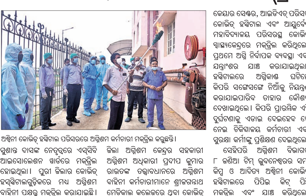
ଅଶ୍ୱିନୀ କୋଭିଡ୍ ହସ୍ପିଟାଲ ପରିସରରେ ଅଗ୍ନିଶମ କର୍ମଚାରୀ ମକ୍ତୁଲ କରୁଛନ୍ତି ।