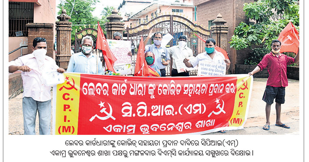
ଲେବର କାର୍ଡଧାରୀଙ୍କୁ କୋଭିଡ ସହାୟତା ପ୍ରଦାନ ଦାବିରେ ସିପିଆଇ (ଏମ) ଏକାମ୍ର ଭୁବନେଶ୍ୱର ଶାଖା ପକ୍ଷରୁ ମଙ୍ଗଳବାର ବିଏମସି କାର୍ଯ୍ୟାଳୟ ସମ୍ମୁଖରେ ବିକ୍ଷୋଭ ।