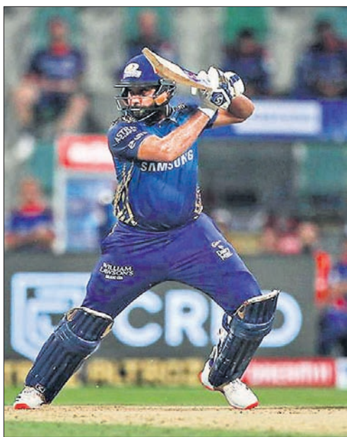
ଅର୍ଦ୍ଧଶତକ ହାସଲ ଅବସରରେ ରୋହିତ ଶର୍ମା।

ଅଧିନାୟକ ରୋହିତ ଶର୍ମାଙ୍କ ଦ୍ରୁତ ଅର୍ଦ୍ଧଶତକ ପରେ ବୋଲରଙ୍କ ପ୍ରଭାବୀ ପ୍ରଦର୍ଶନ ବଳରେ ମୁମ୍ବାଇ ଇଣ୍ଡିଆନ୍ ଟିମ୍‌ର ଇଣ୍ଡିଆନ ପ୍ରିମିୟର ଲିଗ୍ (ଆଇପିଏଲ୍)ର ରୁଧିର ଅନୁଷ୍ଠିତ ମ୍ୟାଚରେ କୋଲକାତା ନାଇଟ ରାଇଡର୍ସକୁ ୪୯ ରନରେ ପରାସ୍ତ କରିଛି। ମୁମ୍ବାଇ ପକ୍ଷରୁ ଧାର୍ଯ୍ୟ ୧୯୬ ରନ ବିଜୟ ଲକ୍ଷ୍ୟର ପିଛା କରି କୋଲକାତା ଦଳ ୨୦ ଓଭରରେ ୯ ଓଭରକେଟ ହରାଇ ୧୪୬ ରନ କରିପାରିଥିଲା। ଟିମ୍ ଆଇପିଏଲ୍‌ରେ କୋଲକାତାର ନିଜ ପ୍ରଥମ ମ୍ୟାଚରେ ପରାଜୟ ସ୍ୱାଦ ଚାଖୁଥିବାବେଳେ ମୁମ୍ବାଇର ୨ ମ୍ୟାଚରୁ ପ୍ରଥମ ବିଜୟ। ପ୍ରଥମ ମ୍ୟାଚରେ ମୁମ୍ବାଇ ମହେନ୍ଦ୍ର ଦି' ଧୋନୀଙ୍କ ଚେନାଳ ସୁପରକିକ୍ସ ନିକଟରୁ ପରାଜିତ ହୋଇଥିଲା।