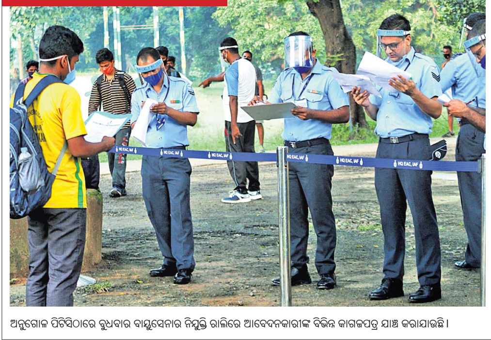
ଅନୁଗୋଳ ପଡିସିଠାରେ ରୁପାବାର ବାୟୁସେନାର ନିୟନ୍ତ୍ରିତ ରାଲିରେ ଆବେଦନକାରୀଙ୍କ ବିଭିନ୍ନ କାଗଜପତ୍ର ଯାଞ୍ଚ କରାଯାଇଛି।