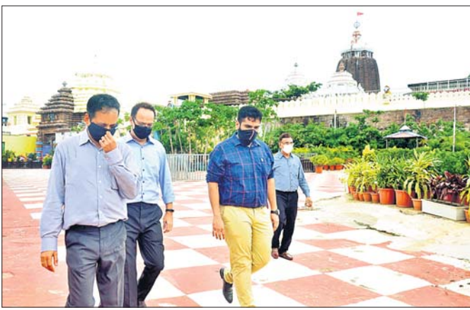
ମାପରୂପ ପ୍ରକ୍ରିୟା ସାରି ପ୍ରତିନିଧି ଦଳ ଶ୍ରୀମନ୍ଦିରକୁ ଫେରୁଛନ୍ତି।

ଟଙ୍କା ଖର୍ଚ୍ଚ ହେବ। ଏଥିପାଇଁ ବର୍ମାଟିକ କାଠ ମଧ୍ୟ ଜଣାଯିବ। ଏହି ୩ଟି କବାଟ ସମ୍ପୂର୍ଣ୍ଣ ହେବାପରେ ପ୍ରାୟ ୧୮ରୁ ୨୦ କୋଟି ଟଙ୍କା ଖର୍ଚ୍ଚ ହେବ ବୋଲି ସମ୍ପୂର୍ଣ୍ଣ ଅଧିକାରୀ ସୂଚନା ଦେଇଛନ୍ତି। ସବୁଠୁ ଟଙ୍କାର ରୂପା ଲାଗିବ ବୋଲି ଆକଳନ କରାଯାଇଛି। ସେହିପରି କାଗଜିଗଡ଼ର ୩ଟି କବାଟ ରୂପା ଛାଉଣି ଲାଗି ନିଷ୍ପତ୍ତି ନେଇଛି। ଏହି ତିନୋଟି ଯାକ ଦ୍ୱାର କବାଟ ମଧ୍ୟ ନଷ୍ଟ ଅବସ୍ଥାକୁ ଚାଲି ଆସିଲାଣି। ଶ୍ରୀମନ୍ଦିର ପ୍ରଶାସନର ଜଣେ ଅଧିକାରୀ କହିଛନ୍ତି, ପ୍ରଥମେ ବର୍ମାଟିକ କାଠରେ ୩ଟି ଦ୍ୱାର ପାଇଁ ରୂପା କବାଟ ତିଆରି କରାଯିବ। ଏହାପରେ ଏହି କବାଟଗୁଡ଼ିକରେ ୧.୬୩ କି.ଗ୍ରାମ ରୂପା ଛାଉଣି କରାଯିବାରୁ ପ୍ରାଥମିକ ଭାବେ ଆଲୋଚନା କରାଯାଇଛି। ୩ଟି କବାଟରେ ପ୍ରାୟ ୧.୯୨୦ କେଜି ରୂପା ଲାଗିବ। ଅର୍ଥାତ୍ ପ୍ରାୟ ୧୪ କୋଟି ଟଙ୍କାର ରୂପା ଲାଗିବ ବୋଲି ଆକଳନ କରାଯାଇଛି। ସେହିପରି କାଗଜିଗଡ଼ର ୩ଟି କବାଟ ରୂପା ଛାଉଣି ଲାଗି ନିଷ୍ପତ୍ତି ନେଇଛି।