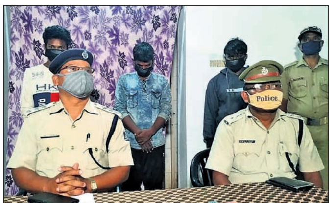
ଖବରଦାତା ସମ୍ମିଳନୀରେ ପୋଲିସ୍ ଗଞ୍ଜେଇ ଟାଲିମା ସମ୍ପର୍କରେ ସୂଚନା ଦେଉଛି।

ଛତ୍ରପୁର, ୨୪୯ (ଡି.ଏନ.ଏ.): ଛତ୍ରପୁର ସଦ୍ଦେଶ୍ୟ ଗୁରୁତାର ଜିଲ୍ଲା ଜିଏସ୍.ଆଇ. ଗଞ୍ଜେଇ ଯାତା ଯାତୀ ପୋଲିସ୍ ଟ୍ରାଫିକ୍ ଡିଭିଜନ୍ ୧୧୫ ଅକ୍ଟୋବର ରହିଥିବା ବେଳେ ସେଥିରେ ୧୦୯ ପୁରୁଷ ଓ ୬୬୩ ମହିଳା ରହୁଥିଲେ।