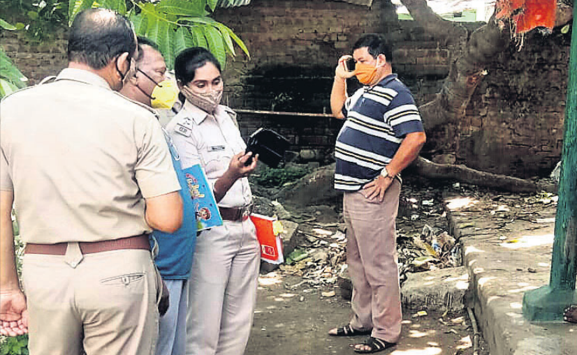
ପୋଲିସ୍ ତଦନ୍ତ ଚଳାଇଛି।

ଗଞ୍ଜାମ ଜିଲ୍ଲା ବ୍ରହ୍ମପୁର ବଡ଼ ବଜାର ଥାନା ପୁରୁଣା ବ୍ରହ୍ମପୁର ମେଣ୍ଟିଲ ନିକଟସ୍ଥ ରାଧାକୃଷ୍ଣ ମନ୍ଦିର ପରିସରରେ ଦୁଧିଆର ରାତିରେ ଘଟିଥିବା ଏକ ହତ୍ୟାକାଣ୍ଡ ଜଣେ ଯୁବକଙ୍କୁ କେତେକ ଘଣ୍ଟା ପରେ ଛେଡ଼ି ହତ୍ୟା କରିଛନ୍ତି।