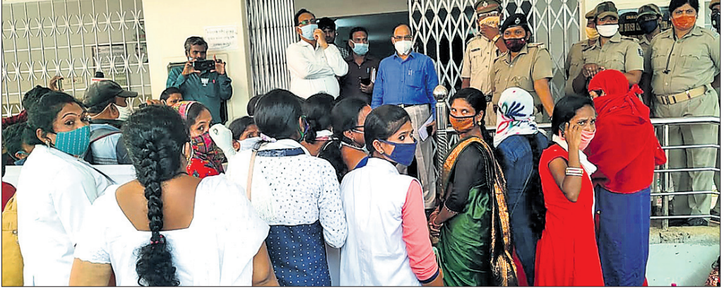
ଅଧିକାରୀମାନେ ଆନ୍ଦୋଳନକାରୀଙ୍କ ସହ ଆଲୋଚନା କରୁଛନ୍ତି ।

କୋରାପୁଟ, ୨୪।୯(ସ.ପ୍ର.) କୋରାପୁଟ ଜିଲାରେ ବିଭିନ୍ନ କୋଭିଡ୍ ହୋମ ଓ କୋଭିଡ୍ କେୟାର ସେଣ୍ଟରରେ କାମ କରୁଥିବା ଏଏନଏମ୍ଙ୍କୁ ଛତେଇ କରାଯାଇଛି। ଏହା ପ୍ରତିବାଦରେ ସେମାନେ ଗୁରୁବାର ଜିଲ୍ଲାପାଳଙ୍କ କାର୍ଯ୍ୟାଳୟ ଘଣ୍ଟା ଘେରାଇ କରିଥିଲେ। ଜିଲ୍ଲାର ବହୁ ଭାଗପା ନେତା ସେମାନଙ୍କୁ ସମର୍ଥନ କରି ଧାରଣାରେ ବସିଥିଲେ। ପ୍ରଶାସନିକ ଅଧିକାରୀମାନେ ସେମାନଙ୍କୁ ବୁଝାଶୁଝା କରିବା ପରେ