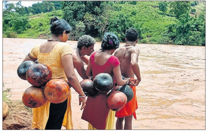
ଅଜ୍ଞାନଘାତି କର୍ମୀ, ସାମାଜିକ କର୍ମୀ ଓ ପିଲୁଓ ନଦୀ ପାର ପାଇଁ ପ୍ରସ୍ତୁତ ହେଉଛନ୍ତି।

ଲୋକଙ୍କ ହିତ ପାଇଁ ସରକାର ଯୋଜନା ପ୍ରସ୍ତୁତ କରିବା ସହ ତାହାକୁ କାର୍ଯ୍ୟକାରୀ କରିବାକୁ ବିଭିନ୍ନ ଅଧିକାରୀ ଓ କର୍ମଚାରୀଙ୍କୁ ନିୟୋଜିତ କରୁଛନ୍ତି। ନିଜ କର୍ମକୁ ଧର୍ମ ଭାବି ପ୍ରତିକୂଳ ପରିସ୍ଥିତିରେ ମଧ୍ୟ ଦୁଇଜଣ ଅଜ୍ଞାନଘାତି କର୍ମୀ, ପିଲୁଓ ଓ ଜଣେ ସାମାଜିକ କର୍ମୀ ଲୋକଙ୍କୁ ସେବା, ଭରଣ ଆଦି ଯୋଗାଉଛନ୍ତି। ମାଲକାନଗିରି ଜିଲା ବିଚ୍ଛିନ୍ନାଞ୍ଚଳଭାବେ ପରିଚିତ ଚିତ୍ରକୋଣ୍ଡା ପଞ୍ଚାୟତ ପିଲୁଓ, ନେତୃତ୍ୱପାଇଁ, ସୁଆପାଲି ଗ୍ରାମ ଅଜ୍ଞାନଘାତି କର୍ମୀ ଏହାର ଉଦାହରଣ। ସେମାନେ ବିପଦସଙ୍କୁଳଭାବେ ଉତ୍ତୁଳା ନଳ ପାରହୋଇ ଲୋକଙ୍କୁ ଭରଣ ଆଦି ବାଣ୍ଟୁଛନ୍ତି।