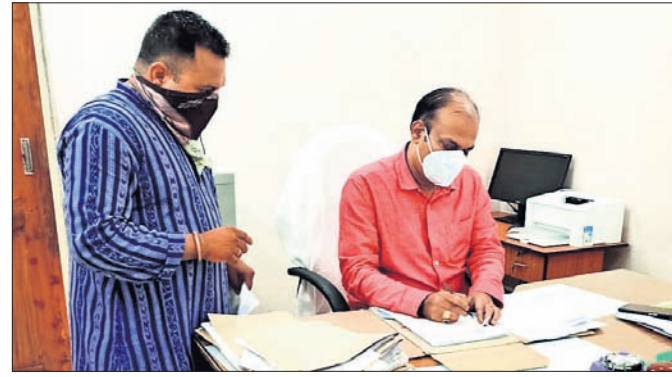
ଯୁବ ବିକାଶ ପରିଷଦ ସଦସ୍ୟମାନେ ଦାବିପତ୍ର ଦେଉଛନ୍ତି।

ରାୟଗଡ଼ା ଅଞ୍ଚଳର ଯୁବ ବିକାଶ ପରିଷଦ ସଦସ୍ୟମାନେ ଦାବିପତ୍ର ଦେଉଛନ୍ତି।