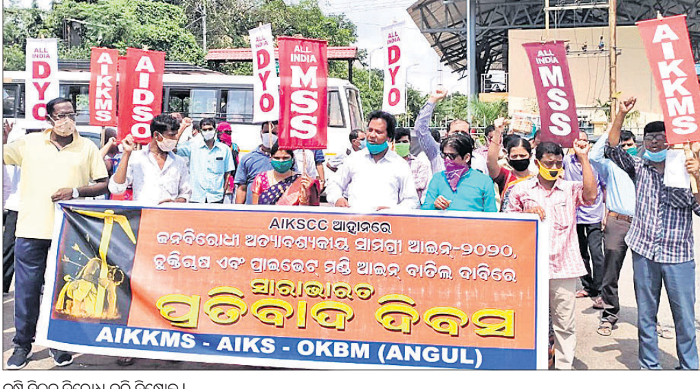
କୃଷି ବିଲ୍କୁ ବିରୋଧ କରି ବିକ୍ଷୋଭ।