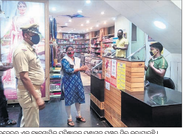
ତାଳଚେରର ଏକ ବ୍ୟବସାୟିକ ପ୍ରତିଷ୍ଠାନକୁ ପ୍ରଶାସନ ପକ୍ଷରୁ ସିଲ୍ କରାଯାଇଛି।

ଅନୁଗୋଳ ଅଫିସ, ୨୫.୯: ଅନୁଗୋଳରେ କରୋନା ସଂକ୍ରମିତଙ୍କ ସଂଖ୍ୟାରେ ରୋକ୍ ଲଗାଇବା ପାଇଁ ଜିଲ୍ଲା ପ୍ରଶାସନ ପକ୍ଷରୁ ବିଭିନ୍ନ ପଦକ୍ଷେପ ହାତକୁ ନିଆଯାଇଛି। ବିଭିନ୍ନ ବୁକ୍ ଓ ସହରାଞ୍ଚଳର ବ୍ୟବସାୟୀଙ୍କ କୋଭିଡ୍ ପରୀକ୍ଷା କରାଯିବା ସହ ଅନାମିତ ଆମାନ୍ତ ଆଦାୟ କରାଯାଇଛି।