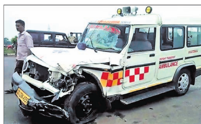
ଭୁବନେଶ୍ୱରରେ ଆମ୍ବୁଲାନ୍ସର ଏକ ଦୁର୍ଘଟଣା ସ୍ଥଳ।

ଭୁବନେଶ୍ୱରରେ ଆମ୍ବୁଲାନ୍ସର ଏକ ଦୁର୍ଘଟଣା ଘଟିଥିଲା। ଶୁକ୍ରବାର ଭୁବନେଶ୍ୱରର ଶୁଭକାରୀ ପଞ୍ଚମୀ ପଥରରେ ଆମ୍ବୁଲାନ୍ସର ଏକ ଉପରାଠ୍ଟର ଏକ ଦୁର୍ଘଟଣା ଘଟିଥିଲା। ଶୁଭକାରୀ ପଞ୍ଚମୀ ପଥରରେ ଆମ୍ବୁଲାନ୍ସର ଏକ ଉପରାଠ୍ଟର ଏକ ଦୁର୍ଘଟଣା ଘଟିଥିଲା।