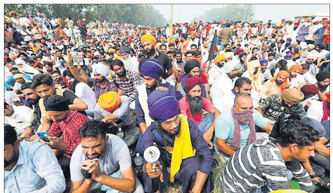
ପଞ୍ଜାବର ଶସ୍ତ୍ରୀରେ ଜାତୀୟ ରାଜପଥରେ କୃଷକମାନେ ବିରୋଧ ପ୍ରଦର୍ଶନ କରୁଛନ୍ତି।

ନିକଟରେ ପାଇଁମୋଷ୍ଟର ବୃଦ୍ଧୀତ ହୋଇଥିବା ମାଟି କୃଷି ବିଲ୍କୁ ଶୁକ୍ରବାର ପଞ୍ଜାବ, ହରିୟାଣା ଏବଂ ଉତ୍ତର ପ୍ରଦେଶ ସମେତ ଦେଶର ବିଭିନ୍ନ ଅଞ୍ଚଳରେ ଘୋର ବିରୋଧ କରାଯାଇଛି। ବିରୋଧକାରୀ ଚାଷୀ ଓ କୃଷକ ସଙ୍ଗଠନ ପକ୍ଷରୁ ଅନେକ ଘାତାହାତ ରାସ୍ତା ଅବରୋଧ କରାଯାଇଛି। ବିଲ୍ ରାଷ୍ଟ୍ରପତିଙ୍କ ଅନୁମୋଦନ ପାଇ ନ ଥିବାରୁ ଏ ସବୁକୁ ହଟେଇ ଦେବା ପାଇଁ କେନ୍ଦ୍ର ସରକାର ଉପରେ କୃଷକ ସଙ୍ଗଠନଗୁଡ଼ିକ ଚାପ ପକାଇଛନ୍ତି।