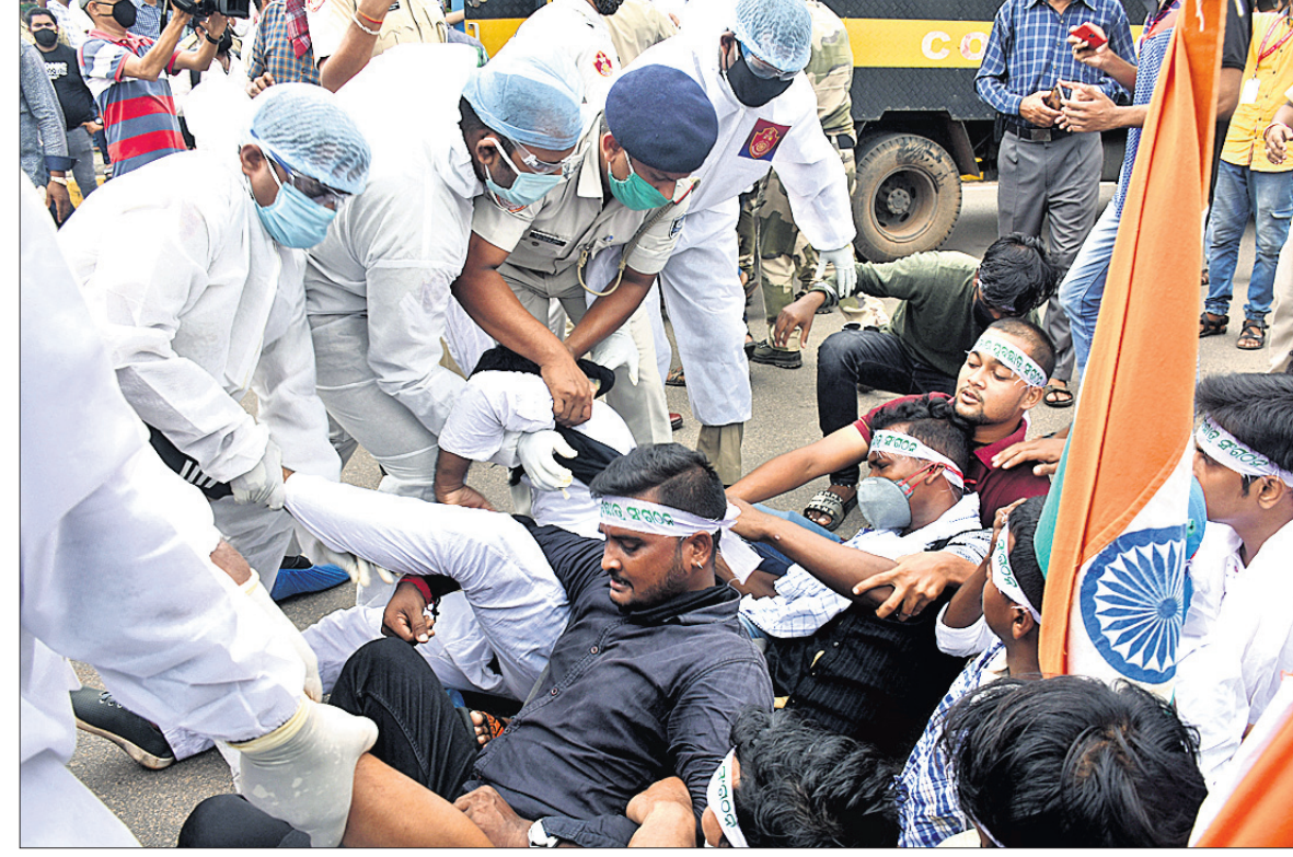
ଭୁବନେଶ୍ୱରରେ ଶୁକ୍ରବାର କୃଷି ବିଲ୍କୁ ବିରୋଧ କରୁଥିବା ବିକ୍ଷୋଭକାରୀଙ୍କୁ ପୋଲିସ୍ ଡାକି ନେଉଛି।

ଭୁବନେଶ୍ୱର, ୨୫.୯ (ବୁଧବୋ) କେନ୍ଦ୍ର ସରକାରଙ୍କ କୃଷି ବିଲ୍କୁ ବିରୋଧ କରି ଭାରତୀୟ କିଷାନ ଯୁନିୟନ, ଅଲ୍ ଇଣ୍ଡିଆ କୃଷକ ସଂଗଠନ, ଅଖିଳ ଭାରତ କିଷାନ ସଂଘର୍ଷ ସମନ୍ୱୟ ସମିତି, ଅଲ୍ ଇଣ୍ଡିଆ କିଷାନ ମହାସଂଘ ଭଳି ୨୪ଟି ସଂଗଠନ ପକ୍ଷରୁ ଶୁକ୍ରବାର ଦେଶବ୍ୟାପୀ ଆନ୍ଦୋଳନ ଓ ବନ୍ଦ ପାଳନ କରାଯାଇଛି। ଏହାର ପ୍ରଭାବ ଓଡ଼ିଶାରେ ଅନୁଭୂତ ହୋଇଛି। ରାଜ୍ୟର ୧୫ଟି ପ୍ରମୁଖ କୃଷକ ସଂଗଠନ, ୮ଟି କେନ୍ଦ୍ରୀୟ ଚ୍ରେତ ଯୁନିୟନ, ୮ଟି ରାଜନୈତିକ ଦଳ ରାଜଧାନୀ ଏବଂ ଓଡ଼ିଶାର ବିଭିନ୍ନ ସ୍ଥାନରେ ପ୍ରତିବାଦ କାର୍ଯ୍ୟକ୍ରମରେ ସାମିଲ ହୋଇଛନ୍ତି। ଏହି ବନ୍ଦକୁ ସମର୍ଥନ କରି ଅଖିଳ ଭାରତ କୃଷକ ସଂଘର୍ଷ ସମନ୍ୱୟ ସମିତି ଓଡ଼ିଶା ଶାଖା ପକ୍ଷରୁ ରାଜଧାନୀର ମାଷ୍ଟରକ୍ୟାଣ୍ଟିନରେ ବିକ୍ଷୋଭ ପ୍ରଦର୍ଶନ କରାଯାଇଛି। ସେହିପରି କେନ୍ଦ୍ରରେ ଜିଲ୍ଲା ପାଟଣା ଜୁକ ନବ ନିର୍ମାଣ କୃଷକ ସଂଗଠନ ପକ୍ଷରୁ ୨୨୦ ନମ୍ବର ଜାତୀୟ ରାଜପଥ ଅବରୋଧ କରି କୃଷି ବିଲ୍କୁ ବିରୋଧ କରିଥିଲେ। ଅତ୍ୟାବଶ୍ୟକ ସେବା ଆଇନ-