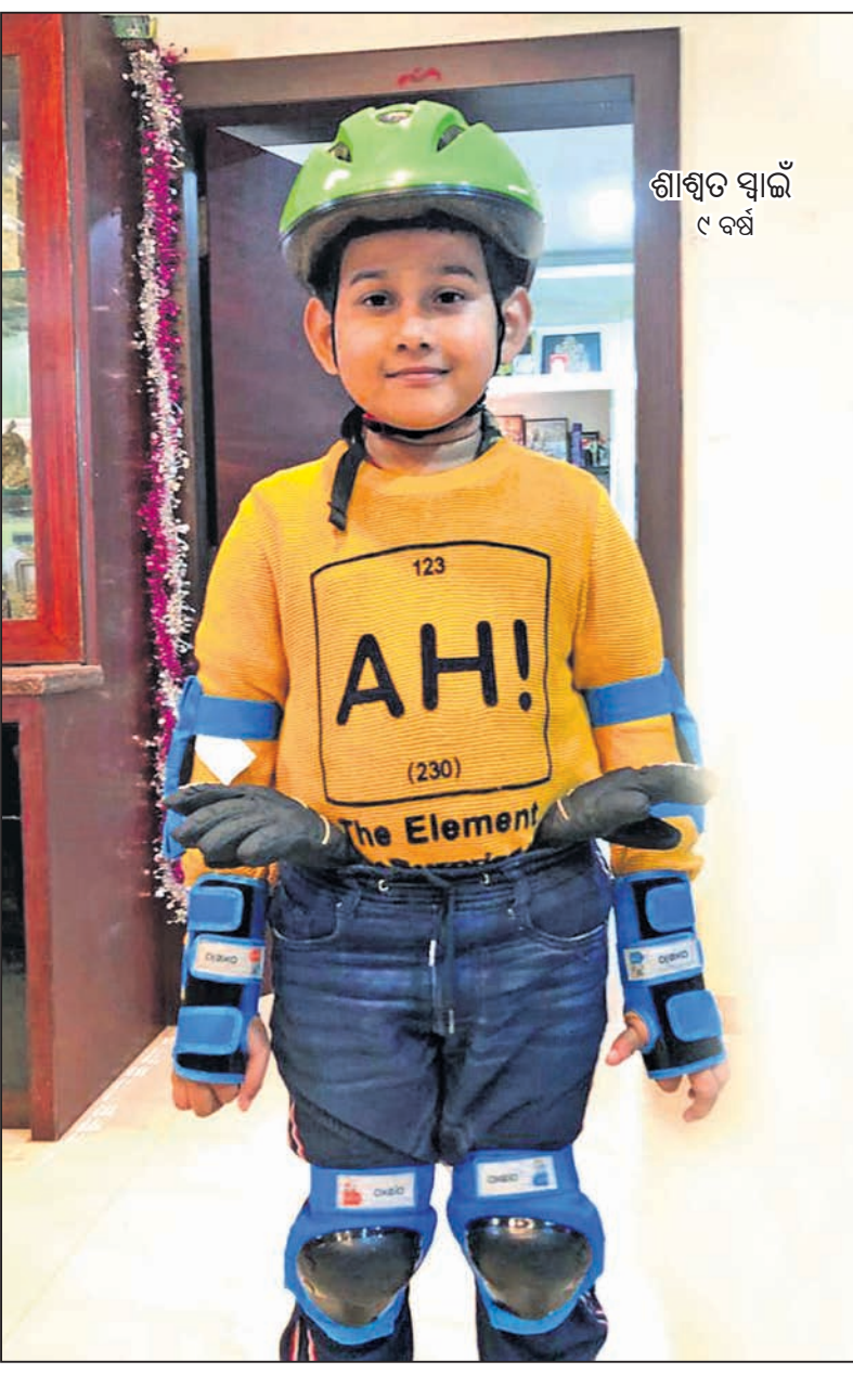
ଶାଶ୍ୱତ ସ୍ୱାଇଁ ୯ ବର୍ଷ