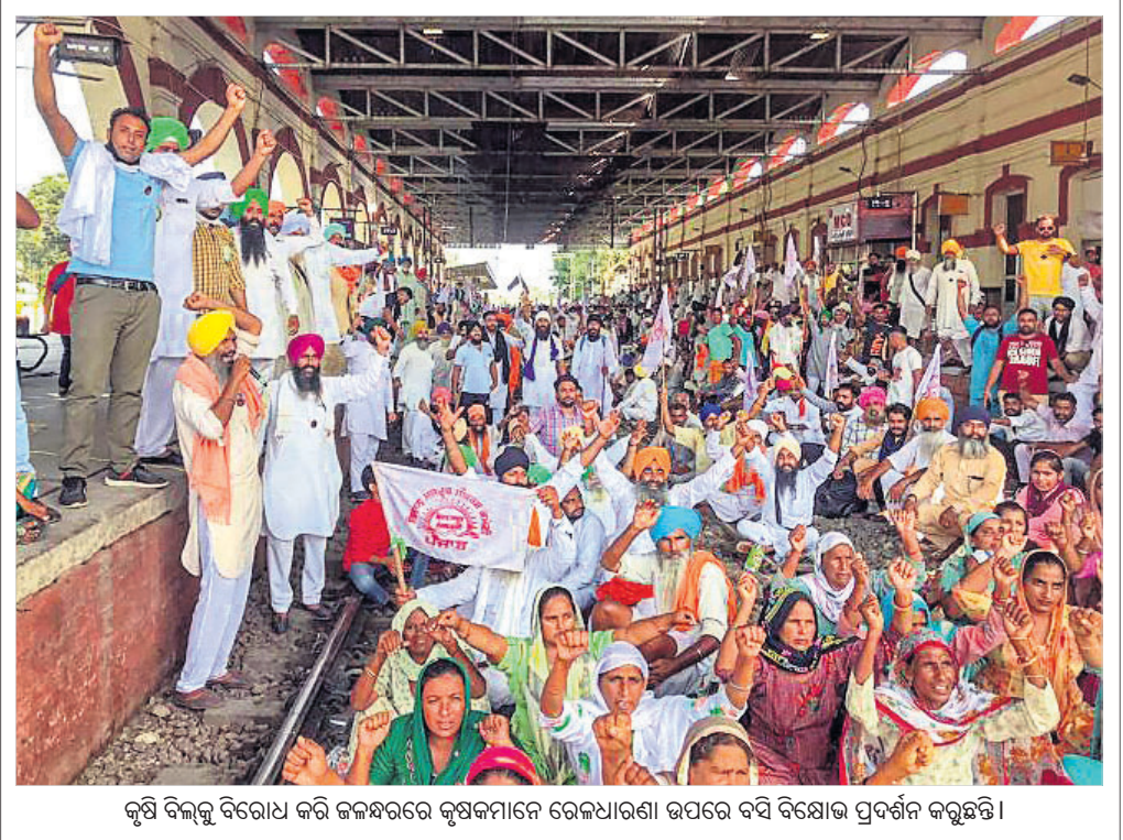
କୃଷି ବିକଳକୁ ବିରୋଧ କରି ଜଳସନ୍ଦେହ କୃଷକମାନେ ରେଳଧାରଣା ଉପରେ ବସି ବିରୋଧ ପ୍ରଦର୍ଶନ କରୁଛନ୍ତି ।