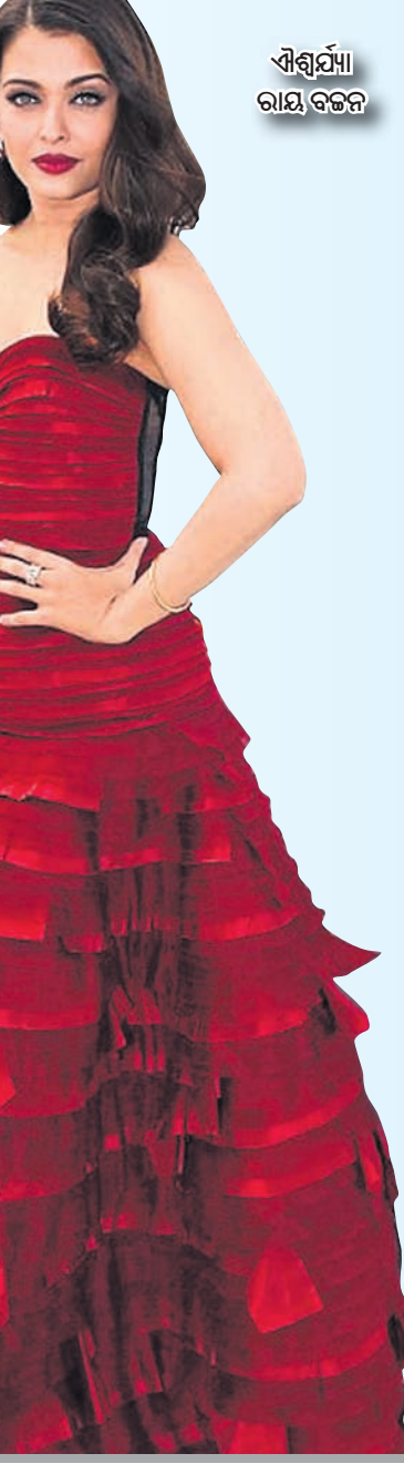
ସୌଖର୍ଯ୍ୟା ରାୟ ବଚନ

ଅଭିନେତ୍ରୀ-ସୌଖର୍ଯ୍ୟା ରାୟ ବଚନ । ଅଭିନୟ ଆଉ ବାସ୍ତବ ଜୀବନର ମା' ଭୂମିକା ଉଭୟରେ ସେ ସଫଳ । ଏ ସମ୍ପର୍କରେ ସୌଖର୍ଯ୍ୟା କହିଛନ୍ତି 'ସଫଳ ବିଫଳ ଭିନ୍ନ କଥା । କିନ୍ତୁ ଉଭୟ ଭୂମିକାରେ ମୋ ଦାୟିତ୍ୱକୁ ଠିକ୍ ଭାବେ ନିର୍ବାହ କରିବା ଲାଗି ଚେଷ୍ଟା କରିଚାଲିଛି । ପରିଶ୍ରମକୁ କେବେ ଭୟ କରିନି । ତେବେ ଆରାଧ୍ୟା ଆସିବା ପରେ ମୋ ଦୁନିଆ ବଦଳିଗଲା । ମା' ଭୂମିକାକୁ ଗୁରୁ ଦାୟିତ୍ୱକୁ ବୁଝାଇବା ଲାଗି ଚେଷ୍ଟା ଚଳାଇ ଆସିଛି' । ସୌଖର୍ଯ୍ୟା ଯେଉଁଠାକୁ ବି ଯାଆନ୍ତି ତାଙ୍କ ସହ ଆରାଧ୍ୟାକୁ ଦେଖିବାକୁ ମିଳିଥାଏ । ସବୁବେଳେ ସେ ଝିଅର ହାତ ଧରିଥାନ୍ତି । ପୁଣି ଝିଅର ସମସ୍ତ କାମ ନିଚେ କରିଥାନ୍ତି । ଝିଅକୁ ଯୁକ୍ତରେ ଛାଡ଼ିବା ଆଉ ଆଣିବାକୁ ନିଚେ ଯାଇଥାନ୍ତି । ଆରାଧ୍ୟାଙ୍କ ସ୍ମୃତିର ପ୍ରତି ସମାରୋହରେ ସେ ଉପସ୍ଥିତ ରୁହନ୍ତି ଏବଂ ଝିଅକୁ ସମର୍ଥନ ମଧ୍ୟ କରିଥାନ୍ତି । ସୌଖର୍ଯ୍ୟା କୁହନ୍ତି, ସତକଥା ମୋ' ଝିଅ ପାଇଁ ପ୍ରଥମ ପ୍ରାଥମିକତା । ଆଉ ତା' ପାଇଁ ସବୁକିଛି କରିବାକୁ ମୁଁ ସବୁବେଳେ ପ୍ରସ୍ତୁତ ।