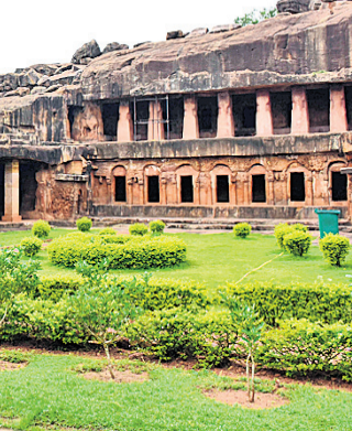
ସାକ୍ଷୀଗୋପାଳର ବକ୍ତୃତା ଦିଆଯିବ ବୋଲି ରାଜ୍ୟ ପର୍ଯ୍ୟଟନ ସଚିବ କହିଛନ୍ତି ।

କରାଯିବ ବୋଲି ଏହାର ଅଧ୍ୟକ୍ଷା ଶ୍ରୀମତୀ ମିଶ୍ର ସୂଚନା ଦେଇଛନ୍ତି ।