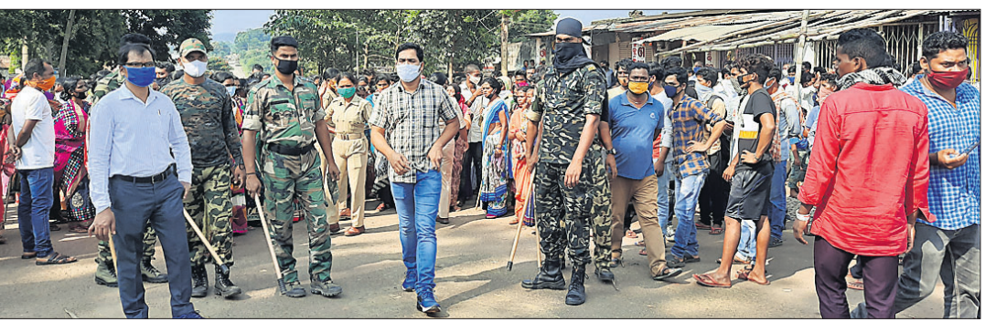
ବିରୋଧକାରୀମାନେ ବିରୋଧ କରୁଛନ୍ତି।