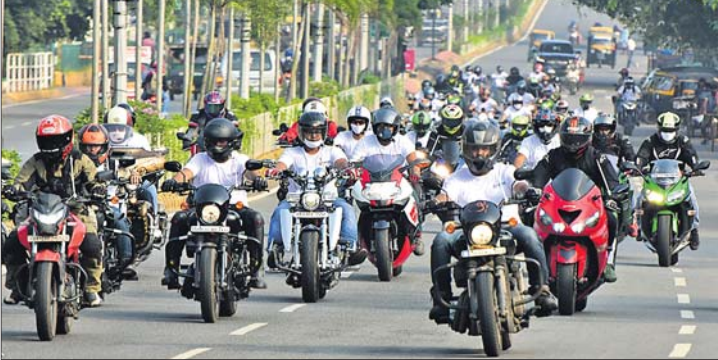
ବିଶ୍ୱ ପର୍ଯ୍ୟଟନ ଦିବସ ପାଳନ ଅବସରରେ ରବିବାର ଭୁବନେଶ୍ୱର ଇନ୍‌ଫୋସିଟି ଛକରୁ ଶାନ୍ତିଯୁଦ୍ଧ ଅଭିମୁଖେ ଯାଉଥିବା ସୁପର ବାଇକର ରାଲି।