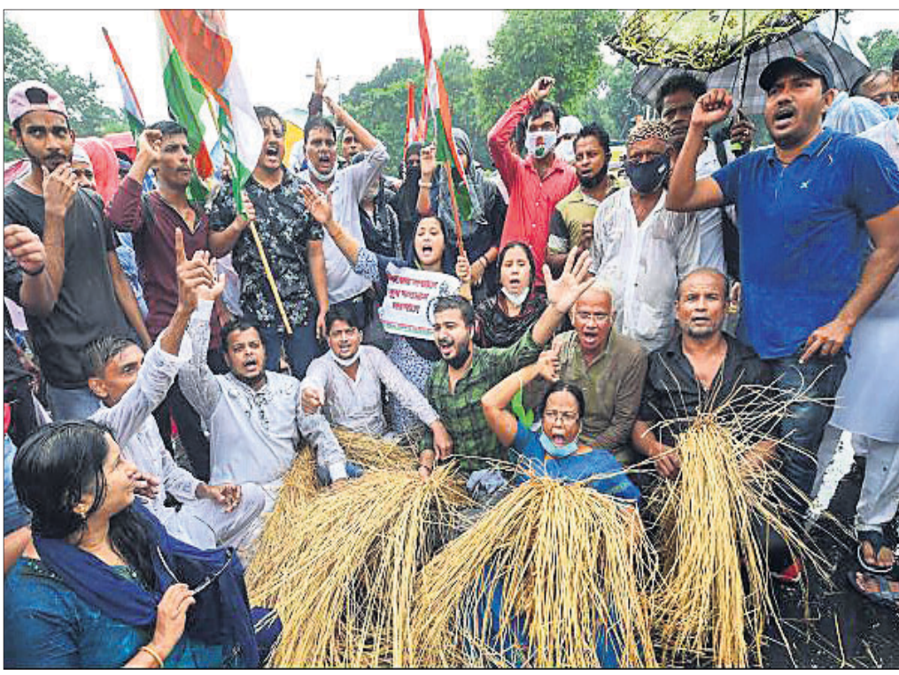
କୃଷି ବିଲକୁ ବିରୋଧ କରି କୋଲକାତାରେ ପ୍ରଦେଶ କଂଗ୍ରେସ କର୍ମକର୍ତ୍ତାମାନେ ସୋପାନ ବିରୋଧ ପ୍ରଦର୍ଶନ କରୁଛନ୍ତି।

କରୋନା ରୋଗୀ ରହିଥିବାବେଳେ ୩୫,୫୭୧ ଜଣଙ୍କ ପ୍ରାଣ ଗଲାଣି। ଏଥିସହ ଆନ୍ଧ୍ରପ୍ରଦେଶ, ଚାଳିଶାହା, କର୍ନାଟକ, ଉତ୍ତରପ୍ରଦେଶ, ଦିଲ୍ଲୀ, ପଶ୍ଚିମବଙ୍ଗ ଆଦି ରାଜ୍ୟରେ ରୋଗୀ ସଂଖ୍ୟା ବଢ଼ିବାରେ ଲାଗିଛି।