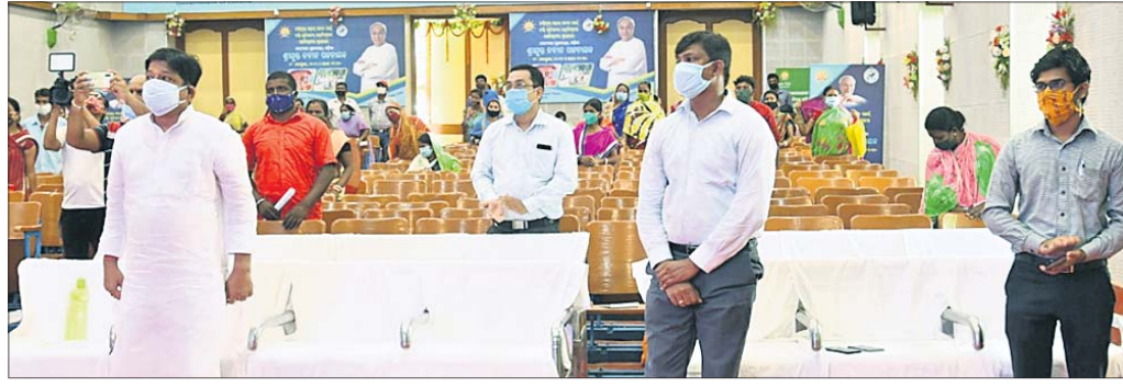
ବାଲେଶ୍ୱର ସହରସ୍ଥିତ ଗାନ୍ଧୀ ସ୍ମୃତିଭବନରେ ଆୟୋଜିତ ବସ୍ତି ଉନ୍ନତୀକରଣ କାର୍ଯ୍ୟକ୍ରମରେ ମନ୍ତ୍ରୀ ପ୍ରତାପ ଜେନା ଓ ଅନ୍ୟମାନେ।