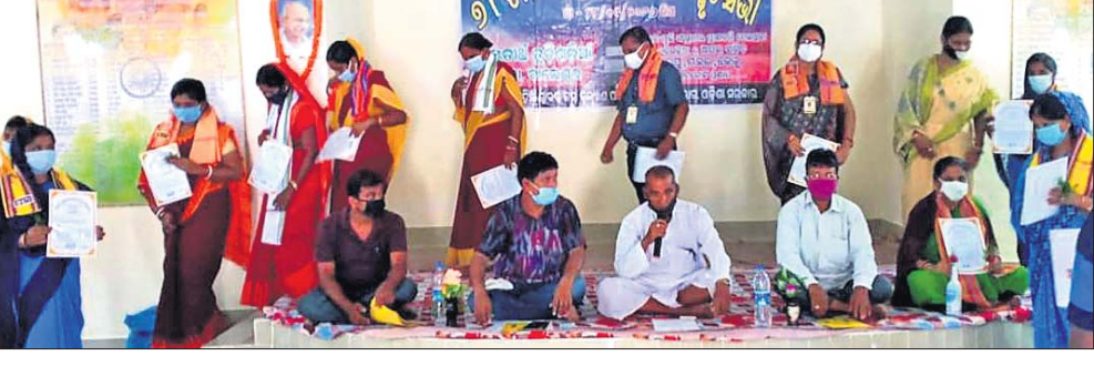
ତୁଟିଗଡ଼ିଆ ସ୍ମୃତିସଭାରେ କୋଭିଡ଼ ଯୋଚ୍ଛା ସମ୍ପର୍କିତ କରାଯାଇଛି ।

ଖଇରା ଅଧୀନ ଖଇରା ବ୍ଲକର ତୁଟିଗଡ଼ିଆ ଅଞ୍ଚଳରେ ୩ଶହୀଦଙ୍କୁ ଶ୍ରଦ୍ଧାଞ୍ଜଳି ଅର୍ପଣ କରାଯାଇଛି । ଖଇରା ଅଧୀନ ଖଇରା ବ୍ଲକର ତୁଟିଗଡ଼ିଆ ଅଞ୍ଚଳରେ ୩ଶହୀଦଙ୍କୁ ଶ୍ରଦ୍ଧାଞ୍ଜଳି ଅର୍ପଣ କରାଯାଇଛି ।