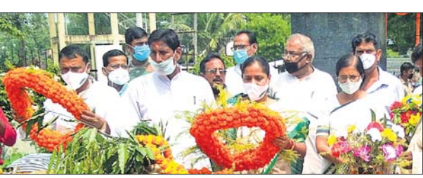
ଶହୀଦ ପୀଠରେ ଶ୍ରଦ୍ଧାଞ୍ଜଳି ଅର୍ପଣ କରାଯାଇଛି ।