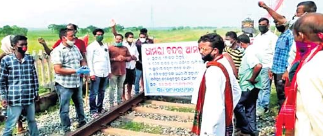
ଯଶିପୁର ଠାରେ ରେଳରୋକ୍ଷ କରାଯାଇଛି ।

ଭଦ୍ରକ ଜିଲ୍ଲା ଗନ୍ଧବଳି ବ୍ଲକ ଯଶିପୁର, ଲକ୍ଷ୍ମୀପୁର ଏବଂ ଦୁଆରୀ ପଞ୍ଚାୟତ ଜନସାଧାରଣଙ୍କ ପକ୍ଷରୁ ୪ଦଫା ଦାବି ନେଇ ଯୋଗଦାନ କରାଯାଇଥିଲା । ଯୋଗଦାନ କରାଯାଇଥିଲା । ଯୋଗଦାନ କରାଯାଇଥିଲା ।