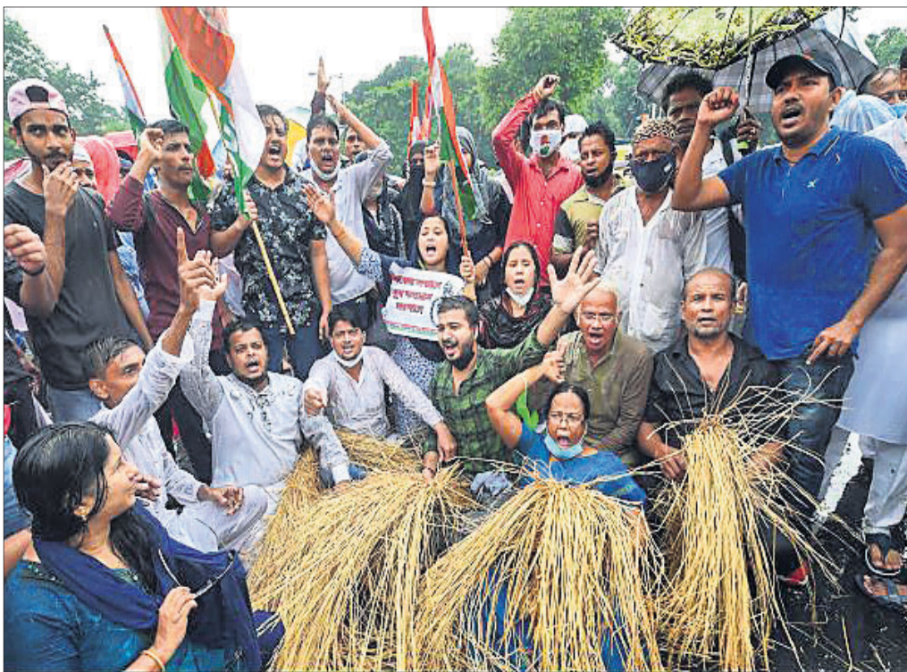
କୃଷି ବିଲକୁ ବିରୋଧ କରି କୋଲକାତାରେ ପ୍ରଦେଶ କଂଗ୍ରେସ କର୍ମକର୍ତ୍ତାମାନେ ସୋପାନ ବିରୋଧ ପ୍ରଦର୍ଶନ କରୁଛନ୍ତି।

କରୋନା ରୋଗୀ ରହିଥିବାବେଳେ ୩୫,୫୭୧ ଜଣଙ୍କ ପ୍ରାଣ ଗଲାଣି। ଏଥିସହ ଆନ୍ତ୍ରପ୍ରଦେଶ, ଚାମିଲନାଡୁ, କର୍ନାଟକ, ଉତ୍ତରପ୍ରଦେଶ, ଦିଲ୍ଲୀ, ପଶ୍ଚିମବଙ୍ଗ ଆଦି ରାଜ୍ୟରେ ରୋଗୀ ସଂଖ୍ୟା ବଢ଼ିବାରେ ଲାଗିଛି।