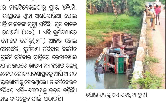
ପୋଲ ଡକ୍ଟରକୁ ଖସି ପଡ଼ିଥିବା ଟ୍ରକ୍।