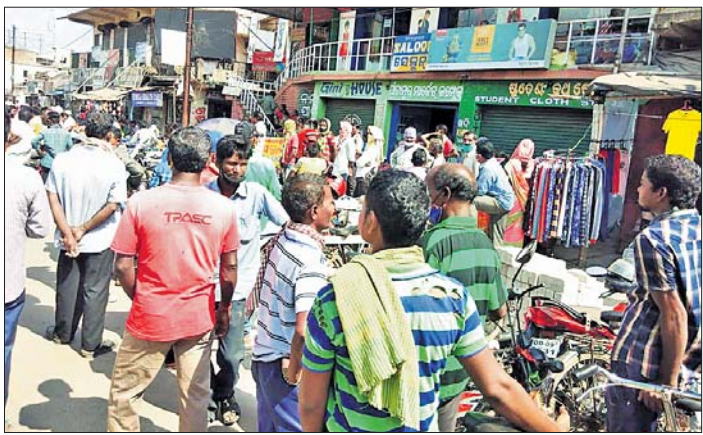
କାମ ଅପେକ୍ଷାରେ ଶ୍ରମିକମାନେ ।

କରୋନା ସମୟରେ କାମନିରାଶିର ଫଳସ୍ୱରୂପ ଶ୍ରମିକମାନଙ୍କୁ କାମ ମିଳୁନାହିଁ । ଏହା ଫଳରେ ଶ୍ରମିକମାନଙ୍କୁ ଚିନ୍ତାରେ ପକାଇଛି । କେନ୍ଦୁଝର ଜିଲ୍ଲାରେ କାମନିରାଶିର ଫଳସ୍ୱରୂପ ଶ୍ରମିକମାନଙ୍କୁ ଚିନ୍ତାରେ ପକାଇଛି । କେନ୍ଦୁଝର ଜିଲ୍ଲାରେ କାମନିରାଶିର ଫଳସ୍ୱରୂପ ଶ୍ରମିକମାନଙ୍କୁ ଚିନ୍ତାରେ ପକାଇଛି ।