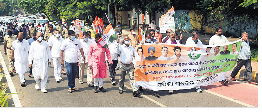
କଂଗ୍ରେସ ନେତାମାନେ ରାଜି କରି ରାଜ୍ୟପାଳ ଭବନକୁ ଯାଉଛନ୍ତି।

ଭୁବନେଶ୍ୱର ୨୮।୯(ବୁଧରୋ) ପାଲିମେଣ୍ଟରେ ଗୃହୀତ ୩ କୃଷି ବିଲ୍