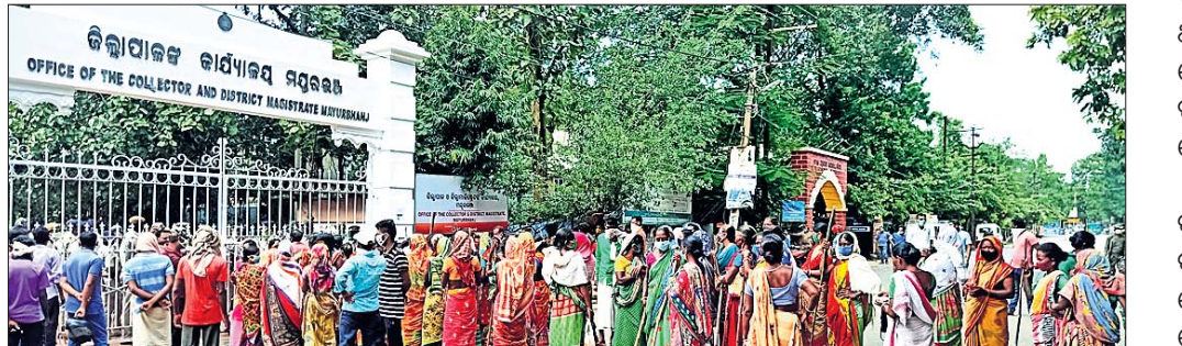
ମହିଳାମାନେ ଜିଲ୍ଲାପାଳଙ୍କ କାର୍ଯ୍ୟାଳୟ ସମ୍ମୁଖରେ ବିକ୍ଷୋଭ ପ୍ରଦର୍ଶନ କରୁଛନ୍ତି ।