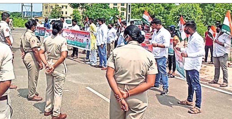
ବିଦ୍ୟୁତ୍ ଦର ବୃଦ୍ଧି ପ୍ରତିବାଦରେ ଯୁବ କଂଗ୍ରେସ କର୍ମୀମାନେ ମଙ୍ଗଳବାର ବିରୋଧ ପ୍ରଦର୍ଶନ କରୁଛନ୍ତି।