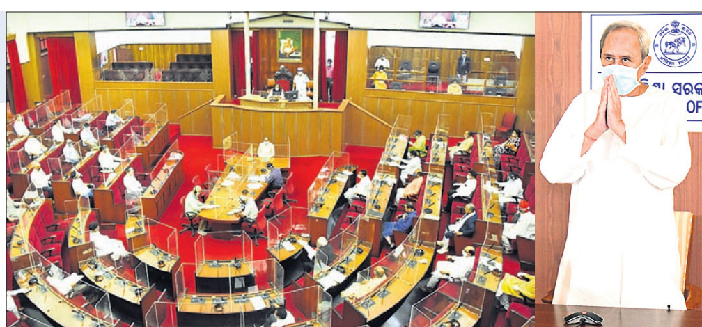
କରୋନା ପ୍ରତିରୋଧ ବ୍ୟବସ୍ଥାରେ ମଙ୍ଗଳବାର ଆରମ୍ଭ ହୋଇଥିବା ବିଧାନସଭା ମୋସ୍ତାମା ଅଧିବେଶନ। ଭିଡିଓ କନ୍ଫରେନ୍ସରେ ଯୋଗଦେଲେ ମୁଖ୍ୟମନ୍ତ୍ରୀ ନବୀନ ପଟ୍ଟନାୟକ।

ମଙ୍ଗଳବାରଠାରୁ ଷୋଡ଼ଶ ବିଧାନସଭାର ମୋସ୍ତାମା ଅଧିବେଶନ କରୋନା କଟକଣା ମଧ୍ୟରେ ନିର୍ଦ୍ଧାରିତ କାର୍ଯ୍ୟପୂର୍ତ୍ତା ଅନୁଯାୟୀ ପୂର୍ଣ୍ଣ ୧୧୮୩ ଆରମ୍ଭ ହୋଇଛି। ଯେଉଁ ବିଧାନସଭାକୁ ପ୍ରବେଶ କରିବା ସଂକ୍ରମିତ ହୋଇନାହିଁ ସେମାନଙ୍କୁ ବିଧାନସଭାରେ ଯୋଗଦେବାକୁ ଅନୁମତି ଦିଆଯାଇଥିଲା। ୮୫ଜଣ ବିଧାୟକ ଯୋଗଦେଇଥିବା ବେଳେ ଅନ୍ୟ ବିଧାୟକମାନେ ବାହାରେ ରହି ଭିଡିଓ କନ୍ଫରେନ୍ସ ଜରିଆରେ ଗୃହ କାର୍ଯ୍ୟରେ ଅଂଶଗ୍ରହଣ କରିଥିଲେ। ବିଧାନସଭାକୁ ପ୍ରବେଶ କରିବା ବେଳେ ବିଧାୟକ, କର୍ମଚାରୀ, ଖରବଦାତାଙ୍କୁ କରୋନା ନେଗେଟିଭ ରିପୋର୍ଟ ଦେଖାଇବାକୁ ପଡ଼ିଥିଲା। ଗୃହକୁ ପ୍ରବେଶ କରିବା ପୂର୍ବରୁ ବାଟଦଳିକାଠାରୁ ଆରମ୍ଭ କରି ସମସ୍ତଙ୍କୁ ପୂର୍ଣ୍ଣ ପରିଷ୍କାର କରାଯାଇଥିଲା। ସମସ୍ତ ସଦସ୍ୟଙ୍କ ସ୍ୱ-ସଂଖ୍ୟାରେ କାଚରେ କଭର କରାଯାଇଥିଲା। କେହି କାହା ପାଖକୁ ଯିବାକୁ ପ୍ରତ୍ୟାହତ ନ ଥିଲା। ଲୋକସେବା ଭବନର ସମ୍ମୁଖରେ କାନ୍ଥ, ବିଭିନ୍ନ ଜିଲାର ଜିଲ୍ଲାପାଳଙ୍କ ସମ୍ମିଳନୀ କକ୍ଷରୁ କେତେଜଣ ବିଧାୟକ ଟ୍ରେସ୍-୧୦