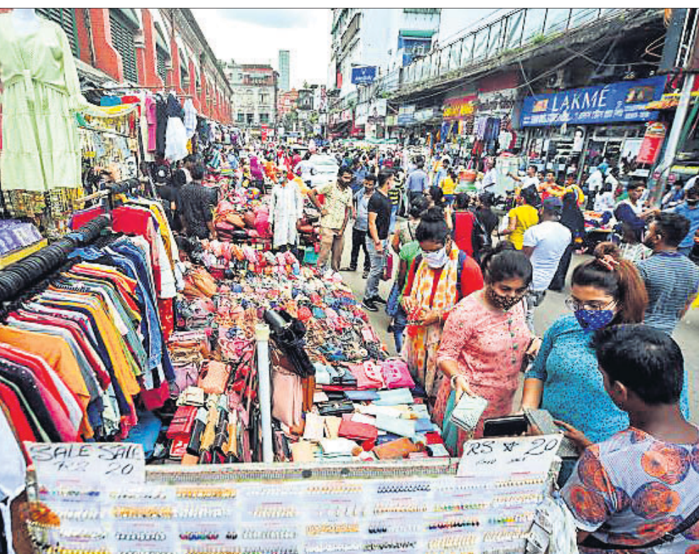
ମହାନଗରୀ କରୋନା ବ୍ୟଂଗଣ ବଡ଼ିଗାଳିଥିବାବେଳେ ଦୁର୍ଗାପୂଜା ଲାଗି ଲୋକଙ୍କାଡ଼ାର ଏକ ବଜାରରେ ମନକବାର ଲୋକଙ୍କ ଭିଡ଼।

ଆର. କେ. ଏସ୍. ଭଦୋରିଆ ଲିପିରେ ଘୋଷଣା କରାଯାଇଛି। ଏପିଡିଏ ନଭେମ୍ବର ନାହିଁ ବୋଲି କହିଛନ୍ତି। ଏଲ୍ଏସିରେ ଯେକୌଣସି ପରିସଂହାର ମୁକାବିଲା ଲାଗି ଭାରତୀୟ ସେନା ପୂର୍ଣ୍ଣ ପ୍ରସ୍ତୁତ ଥିବା ସେ ପ୍ରକାଶ କରିଛନ୍ତି। ସୀମାରେ ବାୟୁସେନାର ଗୁରୁତ୍ୱପୂର୍ଣ୍ଣ ଭୂମିକା ରହିଛି, ରାଫାଲ ଲଢୁଆ ବିମାନ, ସି-୧୭, ଚିନ୍ତକ, ଆପାଚେ ଆଦି ହେଲିକପ୍ଟର ପ୍ରତି ଚ୍ୟାଲେଞ୍ଜକୁ ଅପେକ୍ଷା କରିଛନ୍ତି। ଆଗାମୀ ୨ ବର୍ଷ ମଧ୍ୟରେ ୪୫୦ ହେଲିକପ୍ଟର କ୍ରୟ କରାଯିବାର ଆବଶ୍ୟକତା ରହିଥିବା ସେ ମତ ଦେଇଛନ୍ତି। ଲିପିରେ ଓ ଏହାର ଆଖପାଖ ପାର୍ବତ୍ୟାଞ୍ଚଳରେ ବାୟୁସେନା ସଜାଗ ରହିବା ସହ ପତ୍ରିକା ମାଗୁଛି। ଚାଇନାର ଯେକୌଣସି ଚାଲୁ ସାମ୍ରାଜ୍ୟ ଲାଗି ସେନା ପ୍ରସ୍ତୁତ ଥିବା ସେ କହିଛନ୍ତି।