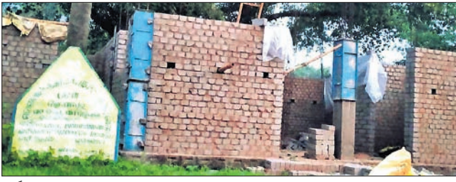
ନିର୍ମାଣାଧୀନ ଅଙ୍ଗନୂଷ୍ଠି ଗୃହ।