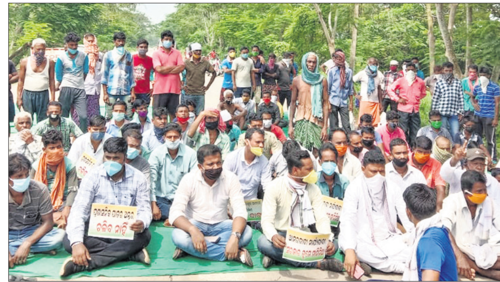
ଶତାଧିକ ଜନସାଧାରଣ ରାସ୍ତାରୋକୋ କରିଛନ୍ତି।