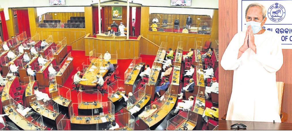
କଟକଣା ପ୍ରତିରୋଧ ବ୍ୟବସ୍ଥାରେ ମଙ୍ଗଳବାର ଆରମ୍ଭ ହୋଇଥିବା ବିଧାନସଭା ମଙ୍ଗଳବାର କଟକଣାରେ ଭିତ୍ତିପ କର୍ମରେନ୍ଦ୍ରରେ ଯୋଗଦେଲେ ମୁଖ୍ୟମନ୍ତ୍ରୀ ନବୀନ ପଟ୍ଟନାୟକ।

ମଙ୍ଗଳବାରଠାରୁ ଷୋଡ଼ଶ ଦିନାନ୍ତର ଯୋଗଦେବା ଆରମ୍ଭ କରିବା ପରେ ମଙ୍ଗଳବାର କଟକଣା ମଧ୍ୟରେ ବିଧାନସଭା ଆରମ୍ଭ ହୋଇଛି। ଯେଉଁ ଦିନରୁ ପ୍ରଥମେ କଟକଣା ଦିନାନ୍ତର ଯୋଗଦେବାକୁ ଅନୁମତି ଦିଆଯାଇଥିଲା। ୮୫ଜଣ ବିଧାୟକ ଯୋଗଦେଇଥିବା ବେଳେ ଅନ୍ୟ ବିଧାୟକମାନେ ବାହାରେ ରହି ଭିତ୍ତିପ କର୍ମରେନ୍ଦ୍ର କାମିନିରେ ରହି କାମିନିରେ ଅଂଶଗ୍ରହଣ କରିଥିଲେ।