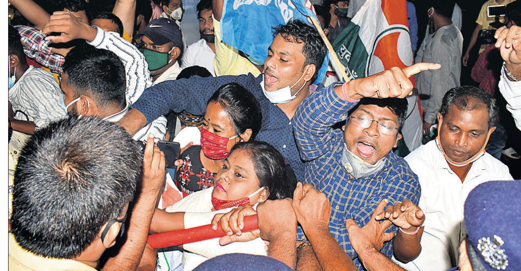
ରାହୁଲ ଗାନ୍ଧୀଙ୍କୁ ଉତ୍ତରପ୍ରଦେଶ ପୋଲିସର ବିରୋଧ ପ୍ରତିବାଦରେ ଭୁବନେଶ୍ୱରରେ ପିସିସି ପକ୍ଷରୁ ବିଷୋଇ ପ୍ରଦର୍ଶନ କରାଯାଇଛି।