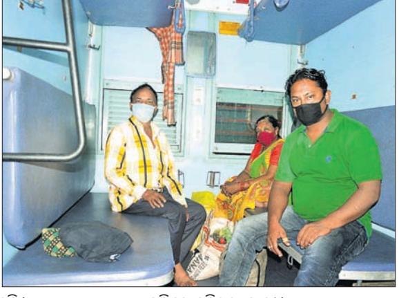
ପୁରୀ ଷ୍ଟେଶନରୁ ଏକ ଟ୍ରେନ୍ ଗଡ଼ିବାକୁ ଅଭିଯୁକ୍ତ ବାହାରିଛି।