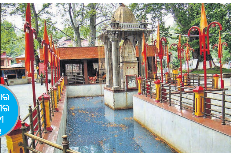
ଅମରନାଥ ଭୂମି ଆନ୍ଦୋଳନ, ୨୦୧୦ରେ ଅମର ଅବଦୁଲ ସରକାରରେ ହିନ୍ଦୀ, ୨୦୧୪ରେ ବନ୍ୟା, ୨୦୧୬ରେ ହିଜରୁଲ ଆତଙ୍କ ସମୟରେ ମଧ୍ୟ କୁଣ୍ଡ ପାଣିର ରଙ୍ଗ ବଦଳି ଯାଇଥିଲା।

ନୂଆଦିଲ୍ଲୀ: ଦେଶରେ ଅନେକ ଦେବଦେବୀଙ୍କ ମନ୍ଦିର ରହିଛି। ପ୍ରତ୍ୟେକ ମନ୍ଦିରର କିଛି ନା କିଛି ବିଶେଷତା ରହିଛି। ସେହିପରି କଣ୍ଡାପାଣିର ଶ୍ରୀନଗର ଚୁଲୁମୁଲରେ ଏମିତି ଏକ ମନ୍ଦିର ରହିଛି, ଏହା ସମ୍ପର୍କରେ ଜାଣିଲେ ଆଶ୍ଚର୍ଯ୍ୟ ହେବେ। ଏହି ମନ୍ଦିରର ନାମ ମାତା ସ୍ତୀର ଭବାନୀ। ଏଠାରେ ଥିବା ଏକ କୁଣ୍ଡ ଆଗୁଆ ଦିପଦ ସମ୍ପର୍କରେ ସୁନା ଦେଇଥାଏ। ପଞ୍ଚତଳ ଅନୁସାରେ ଦିପଦ ଆସିବା ପୂର୍ବରୁ କୁଣ୍ଡପାଣିର ରଙ୍ଗ ବଦଳି ଯାଇଥାଏ। ମନ୍ଦିରର ଦେଖାଶୁଣା କୁଣ୍ଡପାଣିର ରଙ୍ଗ ଚାନ୍ଦେଇ ସିଂ କୁହନ୍ତି, କଣ୍ଡାପାଣିରୁ ଅନୁଭବେ ୩୭୦ ଉଲ୍ଲେଦ ହେବା ସମୟରେ କୁଣ୍ଡ ପାଣିର ରଙ୍ଗ ବଦଳି ଯାଇଥିଲା। ମୋଦିଙ୍କ ଘୋଷଣା ପୂର୍ବରୁ କୁଣ୍ଡ ପାଣିର ରଙ୍ଗ କଳା ହୋଇଯାଇଥିଲା। କିନ୍ତୁ ଏବେ ସ୍ୱାଭାବିକ ହୋଇଛି। ଏହି ମନ୍ଦିରକୁ କଣ୍ଡାପାଣି ପଞ୍ଚତଳମାନେ ନିର୍ମାଣ କରିଥିଲେ। ଅଶାନ୍ତ ବାତାବରଣ ଯୋଗୁ ଏଠାକୁ ଖୁବ୍ କମ୍ ଲୋକ ଆସିଥାନ୍ତି। ବିଶେଷକରି ଯବାନମାନେ ଏହି ମନ୍ଦିରକୁ ପୂଜା କରିବାକୁ ଆସିଥାନ୍ତି। ସୂଚନାଯୋଗ୍ୟ ଯେ, ୨୦୦୮ରେ