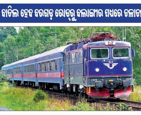
ବାଟିଲ ହେବ ବରଗଡ଼ ରୋଡ଼ରୁ ବଲାଙ୍ଗୀର ମଧ୍ୟରେ ଚଳାଚଳ

ଭୁବନେଶ୍ୱର, ୧୧୧୦(ବୁଧବେ): ବଲାଙ୍ଗୀର ଏବଂ ଲୋଇସିଂହା ଷ୍ଟେଶନ ମଧ୍ୟରେ ରେଳପଥ ଦୋହରାକରଣ କାର୍ଯ୍ୟକ୍ରମ ସମାପ୍ତ ହେବା ପରେ କଟକ ଆଧୁନିକୀକରଣ କାର୍ଯ୍ୟକୁ ଦୃଷ୍ଟିରେ ରଖି ୨୦୨୦ ଅକ୍ଟୋବର ୯ରୁ ୧୮ ତାରିଖ ପର୍ଯ୍ୟନ୍ତ ଭୁବନେଶ୍ୱର-ବଲାଙ୍ଗୀର-ଭୁବନେଶ୍ୱର ଲକ୍ଷ୍ମରସିଟି ସ୍ୱତନ୍ତ୍ର ଟ୍ରେନ୍ ଆଂଶିକ ବାଟିଲ କରିବାକୁ ନିଷ୍ପତ୍ତି ନିଆଯାଇଛି। ଏହି ପରିପ୍ରେକ୍ଷାରେ ପୂର୍ବତନ ରେଳପଥର ସୂଚନା ଅନୁସାରେ ୦୨୮୯୩/୦୨୮୯୪ ଭୁବନେଶ୍ୱର-ବଲାଙ୍ଗୀର-ଭୁବନେଶ୍ୱର ଲକ୍ଷ୍ମରସିଟି ସ୍ୱତନ୍ତ୍ର ଟ୍ରେନ୍ ଅକ୍ଟୋବର ୯ରୁ ୧୮ ତାରିଖ ଯାଏଁ ଭୁବନେଶ୍ୱର ଏବଂ ବରଗଡ଼ ରୋଡ୍ ମଧ୍ୟରେ ଚଳାଚଳ କରିବ। ଏହାସହ ବରଗଡ଼ ରୋଡ଼ଠାରୁ ବଲାଙ୍ଗୀର ମଧ୍ୟରେ ଉଭୟ ଦିଗରୁ ବାଟିଲ ରହିବ। ୦୨୮୬୧ ରାଉରକେଲା-ଭୁବନେଶ୍ୱର-ରାଉରକେଲା ସ୍ୱତନ୍ତ୍ର ଟ୍ରେନ୍ ରାଉରକେଲାକୁ ଶନିବାର ଏବଂ ରବିବାର ବ୍ୟତୀତ ପ୍ରତିଦିନ ସକାଳ ୫ଟା ୧୦ରେ ବାହାରି ଦିନ ୧୨ଟା ୩୦ରେ ଭୁବନେଶ୍ୱର ପହଞ୍ଚିବ। ଫେରିବା ମାର୍ଗରେ ଭୁବନେଶ୍ୱର-ରାଉରକେଲା ସ୍ୱତନ୍ତ୍ର ଟ୍ରେନ୍ ଭୁବନେଶ୍ୱରରୁ ଅପରାହ୍ଣ ୨ଟା ୧୦ରେ ବାହାରି