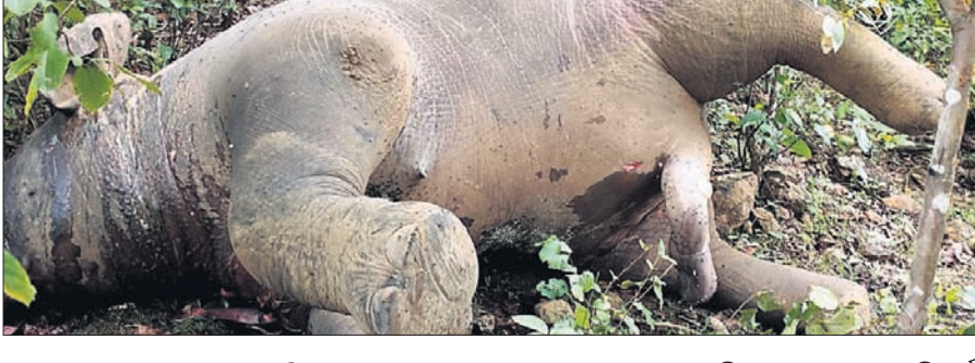
ପାଲଲହଡ଼ା, ୧୧୧୦(ଡି.ଏନ୍.ଏ.): ମୃତ୍ୟୁର କାରଣ ଜଣାପଡି ନ ଥିବାବେଳେ କେହି ସୁବୁର ଦାନ୍ତ କାଟି ନେଇଥିବା ବିଭାଗ ସହେଇ କହିଛି। ଗୁରୁବାର ହିଁ ହାତୀଟିର ମୃତ୍ୟୁ ଘଟିଥିବା ପ୍ରାଥମିକ ତଦନ୍ତରୁ ବନ ବିଭାଗ ଜାଣିବାକୁ ପାଇଛି। ହାତୀଟି କେନ୍ଦୁଝର ଅଞ୍ଚଳରୁ ପାଲଲହଡ଼ା ବନାଞ୍ଚଳକୁ ଚାଲି ଆସିଥିଲା। ବ୍ୟବହୃତ ରିପୋର୍ଟ ଆଧିନୀ ପରେ ମୃତ୍ୟୁର କାରଣ ଜଣାପଡିବ ବୋଲି ଦେବଗଡ଼ ଡିଏଫଓ କ୍ଷମା ଷଡ଼ଙ୍ଗୀ ସୂଚନା ଦେଇଛନ୍ତି।