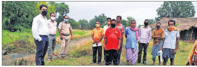
ପ୍ରଶାସନିକ ଅଧିକାରୀମାନେ ଜମି ଚିହ୍ନଟ କରୁଛନ୍ତି ।

ମାଧ୍ୟମରେ ଦେବାନୀଳ ପ୍ରଜଳ ଦ୍ଵାରା କ୍ଷତିଗ୍ରସ୍ତ ଜଳ ଆଠମାଲିକ ବ୍ଲକ୍ କମ୍ପଡ଼ି ପଞ୍ଚାୟତର ପାତ୍ରପଡ଼ା ଗ୍ରାମରେ ଥଳଥଳ ହୋଇଥିବା ଗ୍ରାମବାସୀଙ୍କ ଜମି ଚିହ୍ନଟ ପାଇଁ ସେମାନେ ଜିଲ୍ଲାପାଳଙ୍କୁ ନିର୍ଦ୍ଦେଶ ଦେଇଛନ୍ତି ।