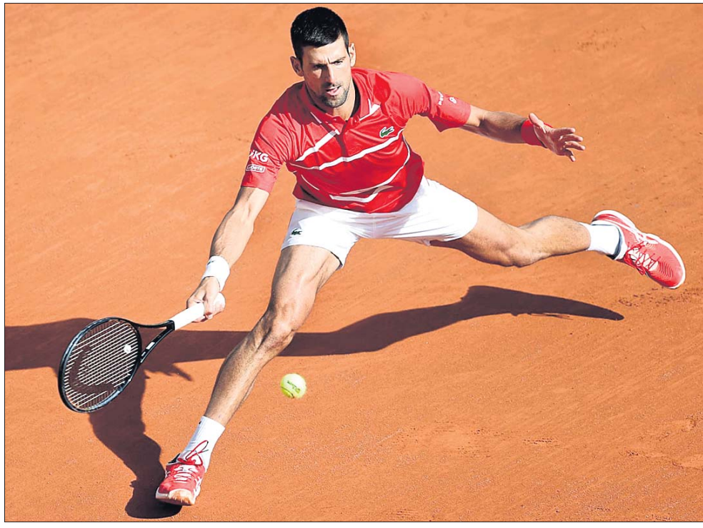
ଫ୍ରେଞ୍ଚ ଓପନ ଗ୍ରାଣ୍ଡସ୍ଲାମ ଟେନିସ ପୁରୁଷ ସିଙ୍ଗଲ୍ ଦ୍ୱିତୀୟ ରାଉଣ୍ଡ ମ୍ୟାଚ୍‌ରେ ରିଚର୍ଡ ଶବ୍ ଖେଳୁଛନ୍ତି ନୋଭାକ ଜୋକୋଭିଚ୍ ।