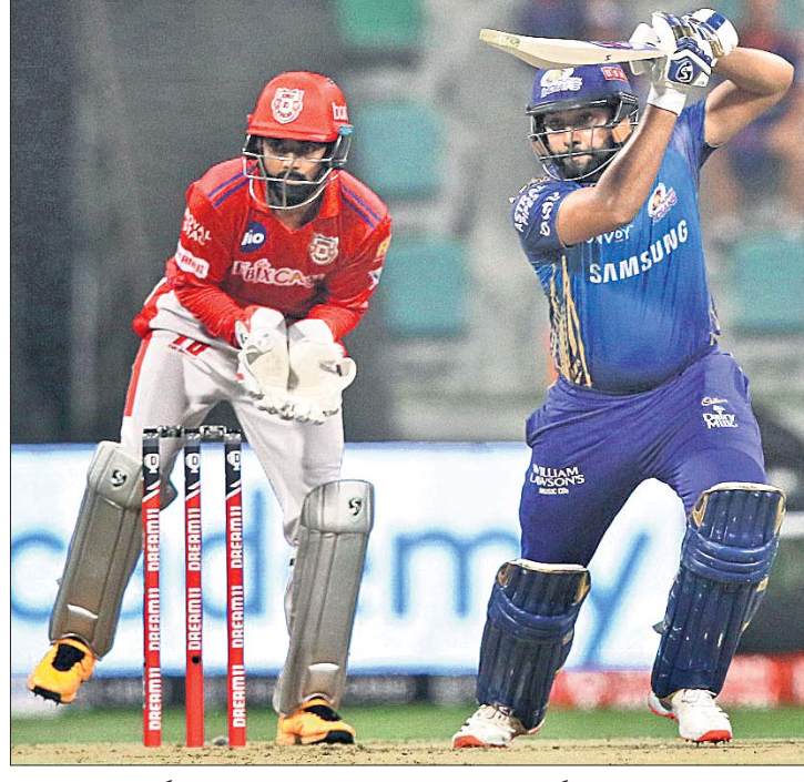
ଅର୍ଦ୍ଧଶତକୀୟ ଇନିଂସ୍ ଅବସରରେ ରୋହିତ ଶର୍ମା (ଡାହାଣ) ।

ଆରୁଧ୍ୟା, ୧୧୧୦ ଅଧିନାୟକ ରୋହିତ ଶର୍ମା, କିରନ ପୋଲାଡ୍ ଓ ହାର୍ଦ୍ଦିକ ପାଣ୍ଡ୍ୟଙ୍କ ବିଶ୍ୱାସୀ ବ୍ୟାଟିଂ ପରେ ବୋଲରଙ୍କ ସଫଳତା ବଳରେ ମୁମ୍ବାଇ ଇଣ୍ଡିଆନ୍‌ସ ଟ୍ରିପିଲର ଲିଭୁ (ଆଇପିଏଲ୍)ରେ ଗୁରୁବାର କିଙ୍ଗ୍ ଇଲେଭେନ ପଞ୍ଚାବକୁ ୪୮ ରନରେ ପରାସ୍ତ କରିଛି । ବିଜୟ ପାଇଁ ୧୯୨ ରନ ଧାର୍ଯ୍ୟ ଥିବାବେଳେ ପଞ୍ଚାବ ୨୦ ଓଭରରେ ୮ ଇଲେଭେନ୍ ହରାଇ ୧୪୩ ରନ କରି ପାରିଥିଲା । ଚଳିତ ସିଜନରେ ୪ ମ୍ୟାଚ୍‌ରୁ ମୁମ୍ବାଇର ଏହା ଦ୍ୱିତୀୟ ବିଜୟ । ଅନ୍ୟପକ୍ଷରେ ପଞ୍ଚାବର ୪ ମ୍ୟାଚ୍‌ରୁ ଦ୍ୱିତୀୟ ପରାଜୟ ।