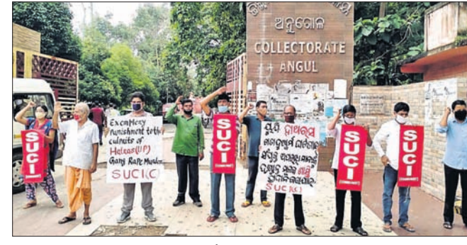
ଏୟୁସିଆଲ ପକ୍ଷରୁ ଜିଲାପାଳଙ୍କ କାର୍ଯ୍ୟାଳୟ ସମ୍ମୁଖରେ ପ୍ରତିବାଦ କରାଯାଇଛି ।

ଉତ୍ତରପ୍ରଦେଶର ହାଥରସ ଘଟଣାକାଳୀନ କାର୍ଯ୍ୟ ଯୋଗୁ ଡ୍ରେନ୍ ରୂପରେ ରାତିରେ ଭୁବ୍ଵୁଡ଼ି ପଡ଼ିଥିବା ଯାଧାରରେ ଅଭିଯୋଗ ହୋଇଛି । ଏ ନେଇ କାର୍ଯ୍ୟାଳୟ ପାଇଥିବା ପୌରପାଳିକାର ଜେଲକୁ ବାନ୍ଧାଯାଇ ଯୋଗାଯୋଗ କରିବାକୁ ବ୍ୟତୀତ କରାଯାଇଥିଲେ ହେଁ ତାଙ୍କ ମତାମତ ମିଳିପାରି ନାହିଁ ।