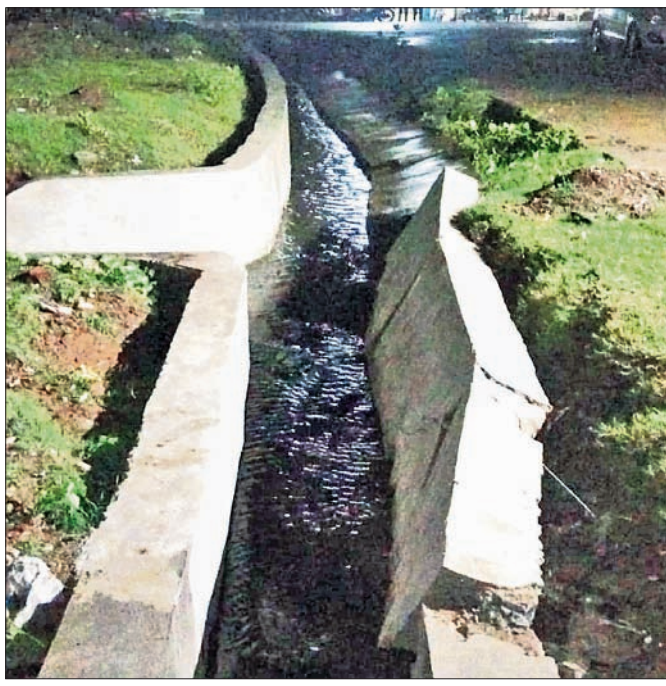
ଭୁବ୍ଵୁଡ଼ି ପଡ଼ିଥିବା ଡ୍ରେନ୍ କାଢ଼ି ।

ଅନୁଗୋଳ ପୌରପାଳିକା ପକ୍ଷରୁ ୨ ଲକ୍ଷ ୪୯ ହଜାର ୪୯୯ ଟଙ୍କା ବ୍ୟୟରେ ହେମପୁରପଡ଼ାରେ ୨୪ ଗଡ଼ି ଡ୍ରେନ୍ ନିର୍ମାଣ କରାଯାଇଥିବା ଏକ ଡ୍ରେନ୍ ରୂପରେ ରାତିରେ ବର୍ଷା ବେଳେ ଭୁବ୍ଵୁଡ଼ି ପଡ଼ିଛି ।