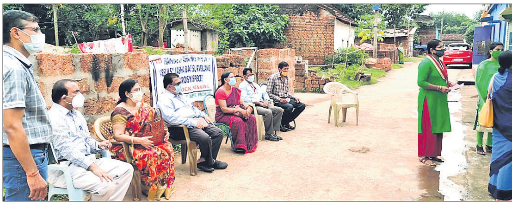
କୁଷ୍ଠରୋଗ ଚିହ୍ନଟ ଅଭିଯାନର ଶୁଭାରମ୍ଭ କରାଯାଇଛି ।

ଦେବାନୀଳ ଜିଲ୍ଲାକୁ କୁଷ୍ଠମୂଳକ ଭାବେ କୁଷ୍ଠ ଦୂରୀକରଣ ପାଇଁ ସର୍ଚ୍ଚେ କରାଯିବ ।