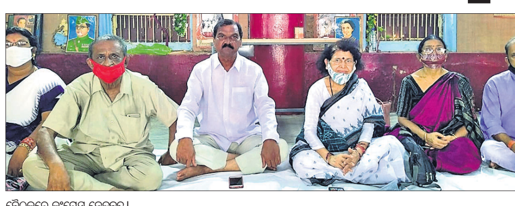
ବୈଠକରେ କଂଗ୍ରେସ ନେତୃବୃନ୍ଦ ।