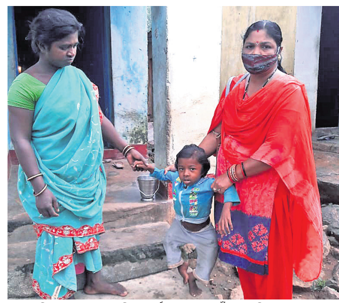
ଜଣେ ମହିଳା ଅଧିକାରୀ ସୁନେଲିକ ସମ୍ପର୍କରେ ତଦତ ପାଇଁ ପହଞ୍ଚିଛନ୍ତି।

ଅନିଚ୍ଛାରେ ସ୍ତ୍ରୀମାନ ଓ ବନ୍ଧୁଙ୍କୁ ଏବଂ ଡ୍ରଷ୍ଟି ଓ ପେଣ୍ଟ ପ୍ରତିଯୋଗିତା ହୋଇଥିଲା। କୃତୀ ପ୍ରତିଯୋଗିତା ଶୁକ୍ରବାର ଗାଳିଆ ଜୟନ୍ତୀରେ ପୂର୍ବସ୍ତର ହେବ। ଜିଲ୍ଲାରେ ଏବେ ସୁଦ୍ଧା ୪ ଲକ୍ଷ ୩୧ ହଜାର ୩୨୩ ଜଣଙ୍କ କରୋନା ଟେଷ୍ଟ ହୋଇଥିବା ଜିଲ୍ଲାପାଳ ସୂଚନା ଦେଇଛନ୍ତି। ଗୁରୁବାର ଆଉ ୪୨ ପତ୍ତିଚିତ୍ତ ଚିତ୍ରଣ ହୋଇଥିବାବେଳେ ୬୧ ଜଣ ସ୍ତ୍ରୀ ହୋଇଛନ୍ତି। ବର୍ତ୍ତମାନ ସୁଦ୍ଧା ଜିଲ୍ଲାରେ ୨୦,୧୯୩ ଜଣ କରୋନାରେ ଆକ୍ରାନ୍ତ ହୋଇଛନ୍ତି। ସେଥିମଧ୍ୟରୁ ୧୯ ହଜାର ୬୯୭ ଜଣ ସ୍ତ୍ରୀ ହୋଇଛନ୍ତି। ଏବେ ୨୬୮ ଜଣ ସକ୍ରିୟ ରୋଗୀ ଅଛନ୍ତି। କରୋନାରେ ୨୨୦ ଜଣଙ୍କ ଜୀବନ ଯାଇଛି। ଅନ୍ୟ ୮ ଜଣଙ୍କ ଅଣକୋଭିଡ୍ରେ ମୃତ୍ୟୁ ହୋଇଛି।