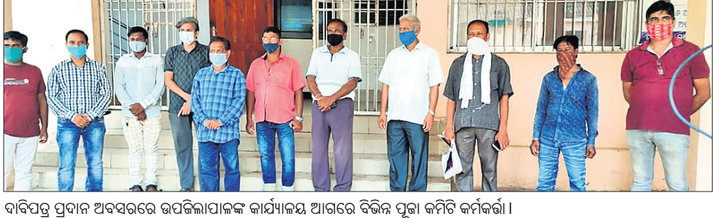
ଦାବିପତ୍ର ପ୍ରଦାନ ଅବସରରେ ଉପଜିଲ୍ଲାପାଳଙ୍କ କାର୍ଯ୍ୟାଳୟ ଆଗରେ ବିଭିନ୍ନ ପୂଜା କମିଟି କର୍ମଚାରୀ।

ପଦ୍ମନାଭପୁରରେ ବଢ଼ିଛି ଚୋରି, ଘୋଲିସ ନିଷ୍ଠିୟ। ପଦ୍ମନାଭପୁରରେ ବଢ଼ିଛି ଚୋରି, ଘୋଲିସ ନିଷ୍ଠିୟ।