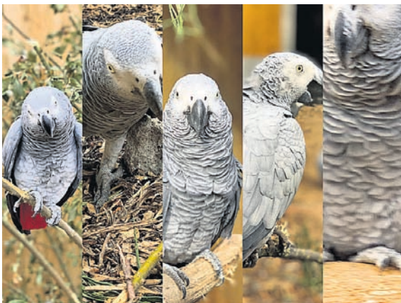
କରିତରରୁ ସ୍ଥାନାନ୍ତର ହୋଇଥିବା ଶୁଆଙ୍କ ନାମ ଏରିକ, ଜେଡ୍, ଗାଲସନ, ବିଲ୍, ଏଲ୍ମା। ସମସ୍ତ ଶୁଆକୁ ନେଇ ଇଂଲଣ୍ଡର ଏକ ପାଲିଟ ହେଉଥିଲା। ସମସ୍ତ ପରିବାର ସେମାନଙ୍କୁ ଆଣି ହୁ'ରୁ କର୍ତ୍ତୃପକ୍ଷକୁ ହସ୍ତାନ୍ତର କରିଥିଲେ। ସମସ୍ତ ୫ ଶୁଆଙ୍କୁ କିଛିଦିନ ଲାଗି ସଙ୍ଗରୋଧରେ ରଖାଯାଇଥିଲା। ଏହାପରେ

ମଣିଷର ଭାଷା, ବ୍ୟବହାର ଏବଂ ଚାଲିଚଳଣିକୁ ଅନୁକରଣ କରୁଥିବା ପକ୍ଷୀଙ୍କ ଭିତରେ ଶୁଆ ସବୁଠୁ ଆଗରେ ତେଣୁ ସତ୍ୟତା ସହ ସମାଜର ଲାଭେ ଏହାକୁ ମଣିଷ ପାଲିଆସୁଛି। ହେଲେ ଇଂଲଣ୍ଡର ଏକ ଚିଡ଼ିଆଖାନାରେ ଶୁଆକୁ ନେଇ ଅସାଧାରଣ ପରିସ୍ଥିତି ସୃଷ୍ଟି ହୋଇଛି। ପର୍ଯ୍ୟଟକ, ଯାତ୍ରୀଙ୍କୁ ଗାଳିଗୁଳି କରିବା କାରଣକୁ ଏଠାକାର ୫ ଶୁଆଙ୍କୁ ଅନ୍ୟତ୍ର ସ୍ଥାନାନ୍ତର କରାଯାଇଛି।