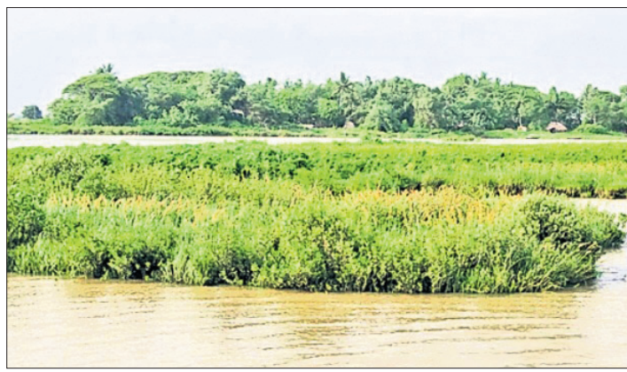
ଆଖଡ଼ାଶାଳି ବନ୍ଦର ପାଇଁ ପ୍ରସ୍ତାବିତ ସ୍ଥାନ।

କେନ୍ଦ୍ରାପଡ଼ା ଅଫିସ, ୧୧୧୦ କେନ୍ଦ୍ରାପଡ଼ା ଜିଲା ମହାକାଳପଡ଼ା ବ୍ଲକ ଆଖଡ଼ାଶାଳି ଗ୍ରାମ ନିକଟ ମହାନଦୀରେ ରାଜ୍ୟର ପ୍ରଥମ ନଦୀଭିତ୍ତିକ ବନ୍ଦର ପ୍ରତିଷ୍ଠା ହେବ। ଏ ସମ୍ପର୍କରେ ମୁଖ୍ୟମନ୍ତ୍ରୀ ନବୀନ ପଟ୍ଟନାୟକ ୨୦୧୮ ଡିସେମ୍ବର ୮ରେ କେନ୍ଦ୍ରାପଡ଼ା ଜିଲା ଗସ୍ତ ଅବସରରେ ଘୋଷଣା କରିଥିଲେ। ଏହି ବନ୍ଦର ପ୍ରତିଷ୍ଠା ପାଇଁ ରାଜ୍ୟ ସରକାରଙ୍କ ପକ୍ଷରୁ ୨୦୧୮ ଜୁଲାଇରେ ଏକ ସ୍ଵତନ୍ତ୍ର ବୈଠକ ଭୁବନେଶ୍ଵରଠାରେ ଅନୁଷ୍ଠିତ ହୋଇଥିଲା।