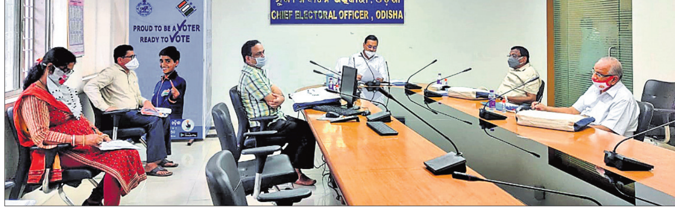
ରାଜ୍ୟ ମୁଖ୍ୟ ନିର୍ବାଚନ ଅଧିକାରୀଙ୍କ କାର୍ଯ୍ୟାଳୟରେ ଗୁରୁବାର ଅନୁଷ୍ଠିତ ସର୍ବଦଳୀୟ ବୈଠକ।

ଭୁବନେଶ୍ୱର, ୧୧୧୦(ବୁଧବେଳା) ଉପନିର୍ବାଚନ ପ୍ରଚାର ବେଳେ କୌଣସି ପ୍ରାର୍ଥୀଙ୍କ ବିରୋଧରେ ବ୍ୟକ୍ତିଗତ ଆକ୍ରମଣ କରାଯାଇ ପାରିବ ନାହିଁ। ଭାରତର ମୁଖ୍ୟ ନିର୍ବାଚନ କମିଶନ ଏ ନେଇ କଟକରେ କାର୍ଯ୍ୟକ୍ରମ ଅପରାଧ ପୁଞ୍ଜିରୁ ଥିବା ବ୍ୟକ୍ତିଙ୍କୁ ଯଦି କୌଣସି ରାଜନୈତିକ ଦଳ ବାଲେଶ୍ୱର ଏବଂ ତିର୍ତ୍ତୋଲ ଉପନିର୍ବାଚନ ପାଇଁ ପ୍ରାର୍ଥୀ କରିବେ ତେବେ ସମ୍ପୂର୍ଣ୍ଣ ଦଳକୁ କୈଫିୟତ ଦେବାକୁ ପଡ଼ିବ। ଏଥିସହିତ ଲୋକଙ୍କ ଅବଗତି ନିମନ୍ତେ ସମ୍ପୂର୍ଣ୍ଣ ପ୍ରାର୍ଥୀ ଅତି କମରେ ୩ ଥର ଖବରକାଗଜ ଓ ବୈଦ୍ୟୁତିକ ଗଣମାଧ୍ୟମରେ ପ୍ରଚାର ପ୍ରସାର କରାଇବେ। ଗୁରୁବାର ରାଜ୍ୟ ମୁଖ୍ୟ ନିର୍ବାଚନ ଅଧିକାରୀଙ୍କ କାର୍ଯ୍ୟାଳୟରେ ଅନୁଷ୍ଠିତ ସର୍ବଦଳୀୟ ବୈଠକରେ ଏହି ସୂଚନା ଦିଆଯାଇଛି। ବାଲେଶ୍ୱର ଏବଂ ତିର୍ତ୍ତୋଲ