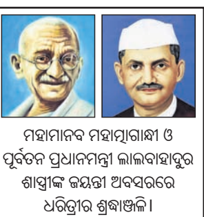
ମହାତ୍ମା ଗାନ୍ଧୀ ଓ ପୂର୍ବତନ ପ୍ରଧାନମନ୍ତ୍ରୀ ଜାହାନ୍ନାହାଦୁର ଶାସ୍ତ୍ରୀଙ୍କ ଇନ୍ଦିରା ଅବସରରେ ଧରିତ୍ରୀର ଶ୍ରଦ୍ଧାଞ୍ଜଳି।