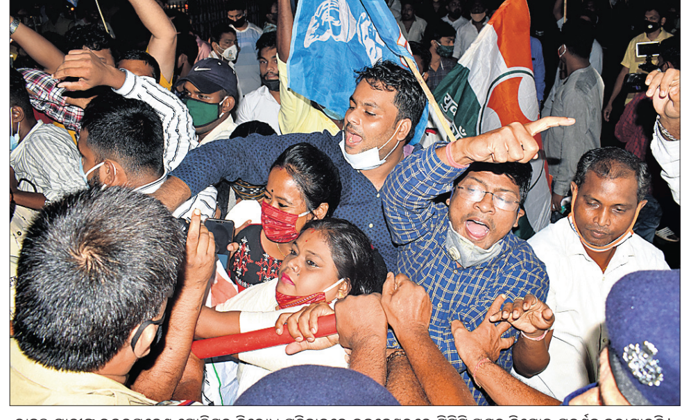
ରାହୁଲ ଗାନ୍ଧୀଙ୍କୁ ଉତ୍ତରପ୍ରଦେଶ ପୋଲିସର ବିରୋଧ ପ୍ରତିବାଦରେ ଭୁବନେଶ୍ୱରରେ ପିସିସି ପକ୍ଷରୁ ବିକ୍ଷୋଭ ପ୍ରଦର୍ଶନ କରାଯାଇଛି।