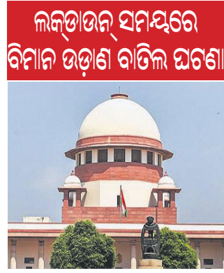
ମଞ୍ଜୁର କରିଛନ୍ତି । ସୂଚନାଯୋଗ୍ୟ, ମାର୍ଚ୍ଚ ୨୫ରୁ ମେ ୨୪ ମଧ୍ୟରେ ଯାତ୍ରାମାନେ ଘରୋଇ ତଥା ଅନ୍ତର୍ଜାତୀୟ ଉଡ଼ାଣ ପାଇଁ ଟିକେଟ ବୁକିଂ କରିଥିଲେ ।

ନ୍ୟୁଦିଲ୍ଲୀ, ୧୧୧୦ ଦେଶରେ କରୋନା ମହାମାରୀ ସଂକ୍ରମଣ ଲାଗି ଲକ୍ଷତାଉନ୍ କାରି କରାଯାଇଥିଲା । ଏହି ସମୟରେ ବିମାନ ଯାତ୍ରାକୁ ବାତିଲ କରାଯାଇଥିଲା । ତେବେ ଯାତ୍ରାକ ଟିକେଟ ବୁକିଂ ଟଙ୍କା ଶୀଘ୍ର ଫେରାଇବାକୁ ସୁପ୍ରିମକୋର୍ଟ ନିର୍ଦ୍ଦେଶ ଦେଇଛନ୍ତି । ଏସମ୍ପର୍କରେ ଏୟାରଲାଇନ୍ସ କମ୍ପାନୀଗୁଡ଼ିକୁ ସୂଚିତ କରାଯାଇଛି । ୩ ସପ୍ତାହ ମଧ୍ୟରେ ଟଙ୍କା ଫେରସ୍ତ ଲାଗି କୋର୍ଟ ନିର୍ଦ୍ଦେଶ ଦେଇଛନ୍ତି । ବେସାମରିକ ବିମାନ ଚଳାଚଳ ନିର୍ଦ୍ଦେଶାଳୟ ପକ୍ଷରୁ ଟଙ୍କା ଫେରସ୍ତ ଲାଗି ଏହି ପ୍ରସ୍ତାବ ଉପସ୍ଥାପିତ କରାଯାଇଥିଲା । ଏହାକୁ ସୁପ୍ରିମକୋର୍ଟ