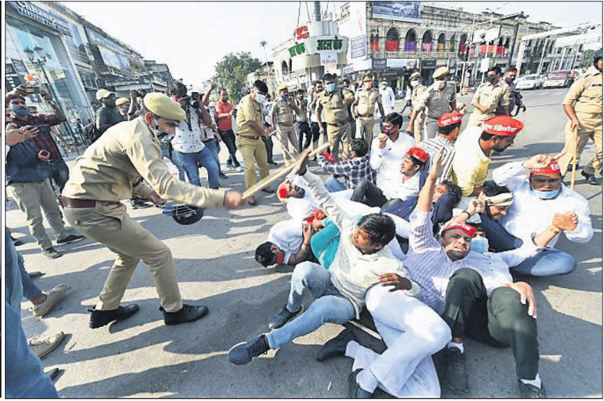
ହାଥିରସ ଯିବା ବାଟରେ କଂଗ୍ରେସ ନେତା ରାହୁଲ ଗାନ୍ଧୀ ଓ ନେତ୍ରୀ ପ୍ରିୟଙ୍କା ଗାନ୍ଧୀ ଭଦ୍ରାକୁ ପୋଲିସ ଗିରଫ କରିବା ପ୍ରତିବାଦରେ କଂଗ୍ରେସ କର୍ମକର୍ମୀମାନେ ନ୍ୟୁଦିଲ୍ଲୀରେ ପୋଡ଼ାଜଳା କରୁଛନ୍ତି ।