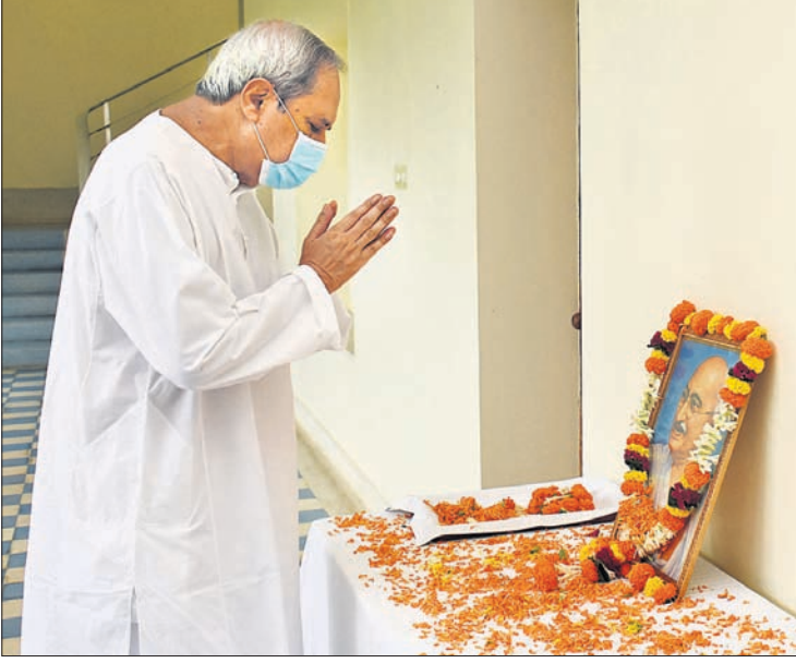
ନବୀନ ନିବାସରେ ମୁଖ୍ୟମନ୍ତ୍ରୀ ନବୀନ ପଟ୍ଟନାୟକ ମହାତ୍ମା ଗାନ୍ଧୀଙ୍କ ଫଟୋଚିତ୍ରରେ ଶ୍ରଦ୍ଧାଞ୍ଜଳି ଜଣାଉଛନ୍ତି।