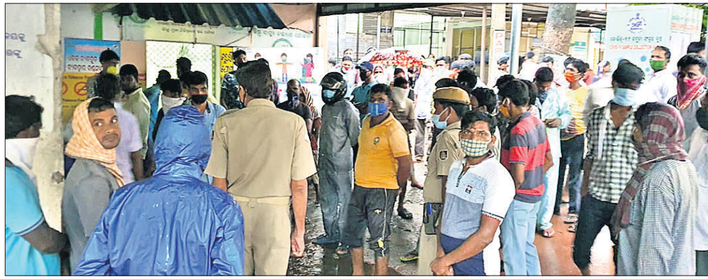
ମେଡିକାଲ ଆଉଟ୍ ରୋମ୍ ନିକଟରେ ଲୋକେ ହୋଇଛନ୍ତି କରୁଛନ୍ତି।

ଭଦ୍ରକ ଜିଲ୍ଲା ମୁଖ୍ୟ ଡାକ୍ତରଖାନାରେ ଜଣେ ରୋଗୀଙ୍କୁ ମୃତ୍ୟୁକୁ ନେଇ ଶୁକ୍ରବାର ଅପରାହ୍ନରେ ଉଦ୍ଦେଶ୍ୟ ପ୍ରକାଶ ପାଇଥିଲା। ମୃତକଙ୍କ ସମ୍ପର୍କୀୟମାନେ ମେଡିକାଲ ପରିସରରେ ହୋଇଛନ୍ତି କରୁଛନ୍ତି। ଆୟକର ପ୍ରଦାନ କରିବାକୁ ସମ୍ମତ ନ ଥିବା ପରିବାରଗୁଡ଼ିକୁ ସରକାର ସିଧାସଳଖ ବ୍ୟାଙ୍କାକାଉଣାକୁ ଅର୍ଥରାଶି ପ୍ରେରଣ କରିବା ନେଇ ସଙ୍ଘଠନଗୁଡ଼ିକ ଦାବି ଉଠାଇଛନ୍ତି। ନୂଆ ଶ୍ରମ କୋଡ୍ ଦ୍ୱାରା ସଂସ୍କାରଗୁଡ଼ିକ ଶ୍ରମିକଙ୍କ ଉପରେ କୋର ଜବରଦସ୍ତି କରିବା ସହ ଦାସତ୍ୱ ଭଳି ପ୍ରଥା ପୁଣି ଥରେ ଦେଖିବାକୁ ମିଳିବ ବୋଲି ଦାବିରେ କୁହାଯାଇଛି। ସେହିଭଳି ଧର୍ମଯତ୍ନ କରିବା ଅଧିକାରକୁ ମଧ୍ୟ ନୂଆ ଆଇନରେ ଛଡ଼ାଳି ଦିଆଯାଇଛି। ନୂଆ ଆଇନରେ ଅଣସଙ୍ଘଠନ ଶ୍ରେଣୀଗୁଡ଼ିକର ଶ୍ରମିକଙ୍କୁ ଅଣଦେଖା କରାଯାଇଥିବା ଅଭିଯୋଗ ହୋଇଛି। ସରକାର ଯେଉଁ ୩ ଶ୍ରମ କୋଡ୍ ବିଲକୁ ପାସ୍ କରାଇଛନ୍ତି, ତାହା ଅଗଣତାନ୍ତ୍ରିକ ବିରୋଧୀ ଦଳର ଅନୁପସ୍ଥିତିରେ ଏହାକୁ ସରକାର ପାସ୍ କରାଇଥିବାରୁ ସଙ୍ଘଠନଗୁଡ଼ିକ ଏହାକୁ ବିରୋଧ କରିଛନ୍ତି। ଶ୍ରମିକ ସଙ୍ଘଠନଗୁଡ଼ିକର ଏହି ଧର୍ମଯତ୍ନ ତାକରାରେ ଆରମ୍ଭ ସମ୍ପର୍କ ସହବନ୍ଧିତ ଭାରତୀୟ ମଜଦୁର ସଂଘ ସାମିଲ ହେବ ନାହିଁ ବୋଲି ଜଣାପଡ଼ିଛି। ଆୟକର ପରିସରରେ ଆସୁ ନ ଥିବା ପରିବାରଗୁଡ଼ିକୁ ମାସିକ ୭,୫୦୦ ଟଙ୍କା ପ୍ରଦାନ, ନାଗରୀ ନିଶ୍ଚିତ କର୍ମନିୟୁକ୍ତି ଯୋଜନାରେ ଅଧିକ କାମ ଯୋଗାଣ, ଶ୍ରମ କୋଡ୍ ଏବଂ ଫାର୍ମ ବିଲକୁ ପ୍ରତ୍ୟାହାର ଭଳି ଅନ୍ୟ ଦାବି ରଖାଯାଇଛି।