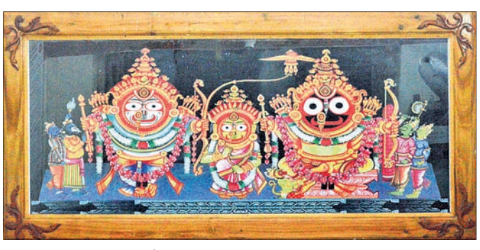
ମହାପ୍ରଭୁଙ୍କ ରଘୁନାଥ ବେଶ।