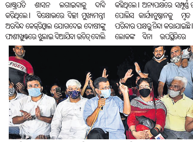
ନୂଆଦିଲ୍ଲୀର ଯତ୍ନମୟରେ ଦିଲ୍ଲୀ ମୁଖ୍ୟମନ୍ତ୍ରୀ ଅରବିନ୍ଦ କେଜ୍ରିୱାଲ ବିକ୍ଷୋଭକାରୀଙ୍କ ସହ ସାମିଲ ହୋଇଛନ୍ତି।

ନୂଆଦିଲ୍ଲୀ/ଲକ୍ଷ୍ନୌ, ୨୧୧୦ ହାଥରସରେ ଜଣେ ଦଳିତ ମହିଳାଙ୍କୁ ଗଣବଳାକାର ଓ ହତ୍ୟା ଘଟଣାକୁ ନେଇ ଶୁକ୍ରବାର ଯତ୍ନମୟରେ ଜୋରଦାର ବିକ୍ଷୋଭ ଦେଖିବାକୁ ମିଳିଛି। ଭିମ୍ ଆର୍ମି ମୁଖ୍ୟ ରଘୁଶେଖର ଆଜାଦଙ୍କ ନେତୃତ୍ୱରେ ହାଥରସ ଘଟଣାକୁ ନେଇ ବିକ୍ଷୋଭ ପ୍ରଦର୍ଶନ କରାଯିବା ସହ ଏହି ଘଟଣାରେ ପ୍ରଧାନମନ୍ତ୍ରୀ ନରେନ୍ଦ୍ର ମୋଦି ଉତ୍ତର ଦେବାକୁ ଦାବି କରିଛନ୍ତି। ଉତ୍ତରପ୍ରଦେଶ ସରକାରଙ୍କଠାରୁ ନ୍ୟାୟ ଆଣା କରାଯାଇ ନ ପାରେ ବୋଲି ମଧ୍ୟ ଦାବି କରାଯାଇଛି। ଚୁକ୍ତର ସେ ରାଜ୍ୟରେ