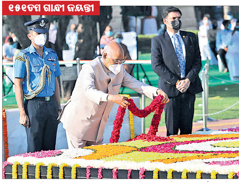
ନୂଆଦିଲ୍ଲୀର ରାଜସ୍ୱାୟତ୍ତ ମହାମାଳା ଗାନ୍ଧୀ ସମାଧିକ୍ଷକରେ ଶୁକ୍ରବାର ରାଷ୍ଟ୍ରପତି ରାମନାଥ କୋବିନ୍ଦ ଶ୍ରଦ୍ଧା ସୁମନ ଅର୍ପଣ କରୁଛନ୍ତି।

ଜାନୁଆରୀ ପହିଲାକୁ ନଭେମ୍ବର ୬ ତାରିଖ ମଧ୍ୟରେ ମାତ୍ର ୧୪ଟି ପ୍ରକଳ୍ପ ପାଇଁ ଓଡ଼ିଶାରେ ସର୍ବାଧିକ ୪,୫୧୫ ହେକ୍ଟର ଜଙ୍ଗଲ ଜମିକୁ ଅଣଜଙ୍ଗଲ କିସମରେ ପରିବର୍ତ୍ତନ କରିବାକୁ ମନ୍ତ୍ରାଳୟ ଅନୁମତି ଦେଇଛି। ମନ୍ତ୍ରାଳୟ ପକ୍ଷରୁ ପ୍ରକଳ୍ପ କରାଯାଇଥିବା ରିପୋର୍ଟ ଅନୁଯାୟୀ ସମଗ୍ର ଦେଶରେ ଏହି ସମୟ ମଧ୍ୟରେ ୨୨ ରାଜ୍ୟରେ ୯୩୨୮ଟି ପ୍ରକଳ୍ପ ପାଇଁ ୧୧୪୬୬.୩୩ ହେକ୍ଟର (୧୧୪.୬୮ ବର୍ଗ କିଲୋମିଟର) ଜଙ୍ଗଲ ଜମିକୁ ଅଣଜଙ୍ଗଲ କିସମରେ ପରିବର୍ତ୍ତନ କରିବାକୁ ଅନୁମତି ଦିଆଯାଇଛି। ବିଶେଷ କରି ଜଳସେଚନ ପ୍ରକଳ୍ପ ଓ ଖଣି ପାଇଁ ଏତେ ପରିମାଣର ଜଙ୍ଗଲକୁ ନଷ୍ଟ କରିବାକୁ ପଡ଼ିବ ବୋଲି ରିପୋର୍ଟରେ କୁହାଯାଇଛି। ଏତେ ନଷ୍ଟ ହେବା ପରେ ରାଜ୍ୟରେ ଜଙ୍ଗଲ ପରିମାଣ ଅଧିକ ରହିଥିବା ଜଙ୍ଗଲ ଓ ପରିବେଶ ବିଭାଗ କହୁଛି। ବିଭାଗୀୟ ମନ୍ତ୍ରୀ ବିକ୍ରମ କେଶରୀ ଆହୁଣ୍ଡି ପୃଷ୍ଠା-୪