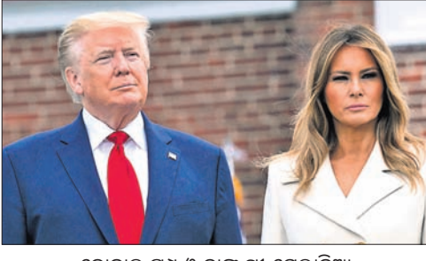
ଡୋନାଲ୍ ଟ୍ରମ୍ପ ଓ ତାଙ୍କ ସ୍ତ୍ରୀ ମେଲାନିଆ