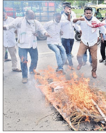
ମାଷ୍ଟର କ୍ୟାଣ୍ଡନ ଛକଠାରେ ପ୍ରଧାନମନ୍ତ୍ରୀ ନରେନ୍ଦ୍ର ମୋଦିଙ୍କ କୁଶପୁରଲିକା ଦାହ କରାଯାଇଛି।