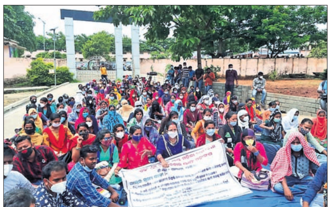
ଛତ୍ରପୁର, ୨୧୧୦ (ଡି.ଏନ୍.ଏ.)