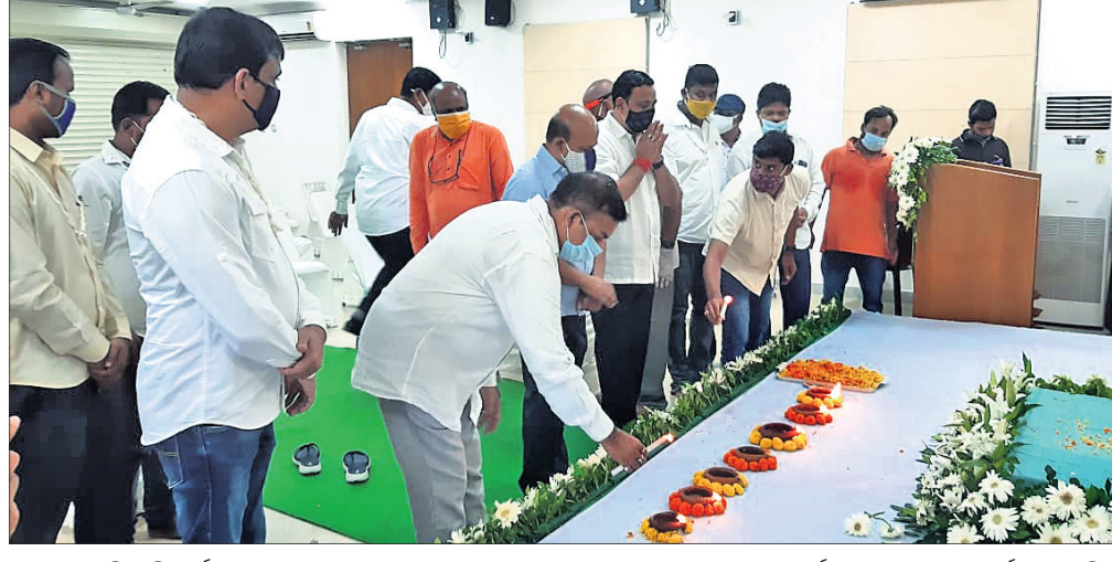
ଭୁବନେଶ୍ୱର ବିଜେଡି କାର୍ଯ୍ୟକ୍ରମରେ ଶୁକ୍ରବାର ଗାନ୍ଧୀ ଜୟନ୍ତୀ ଅବସରରେ ମହାତ୍ମା ଗାନ୍ଧୀଙ୍କୁ ନେତା ଓ କର୍ମୀମାନେ ଶ୍ରଦ୍ଧାଞ୍ଜଳି ଅର୍ପଣ କରୁଛନ୍ତି।

କରୁଥିବାବେଳେ ଜମି ହରାଇଥିବା ମାଲିକଙ୍କୁ ସ୍ୱଳ୍ପ ଉପାୟରେ କ୍ଷତିପୂରଣ ପ୍ରଦାନ କରାଯିବା ଆବଶ୍ୟକ। ଲୋକଙ୍କ ଜୀବନ ଜୀବିକା ନେଇ ହୋଇଥିବା ସାମାଜିକ ସର୍ବେକ୍ଷଣରେ ସଂଗ୍ରହ କରାଯାଇଥିବା ସୂଚନାର ପୁନର୍ବିଚାର ଲାଗି ସେ କହିଛନ୍ତି। ଠିକଣା ସୂଚନା ସଂଗ୍ରହ କରାଗଲେ ଲୋକଙ୍କ ଅଧିକାରକୁ ଅଣବେଶା କରାଯାଇପାରିବ ନାହିଁ ଏବଂ ସେମାନେ କ୍ଷତିପୂରଣ ପାଇପାରିବେ। କେବଳ ଏହି କୋଲିଙ୍ଗା ଖଣି ନୁହେଁ, ବିଭିନ୍ନ କମ୍ପାନୀର ଜମି ଅଧିଗ୍ରହଣ ସମୟରେ ଲୋକେ ଆଇନ ପୂର୍ବାବକ କ୍ଷତିପୂରଣ ପାଇ ନ ଥିବା ଅଭିଯୋଗ ସାମୁଦ୍ରିକ ଆହୁଥିବା ବିଧାନସଭା କହିଛନ୍ତି।