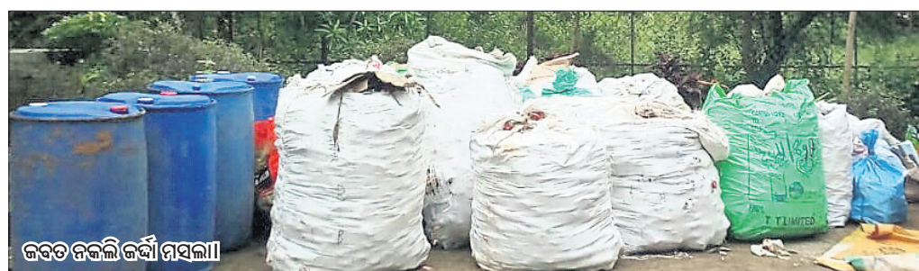
ଜବତ ନକଲି ଜର୍ଦ୍ଦା ମସଲା

ଭୁବନେଶ୍ୱର, ୨୧୧୦ (ବ୍ୟୁରୋ)/ ଚଣ୍ଡିଖୋଲ/ ଛତିଆ (ଡି.ଏନ୍.ଏ.)