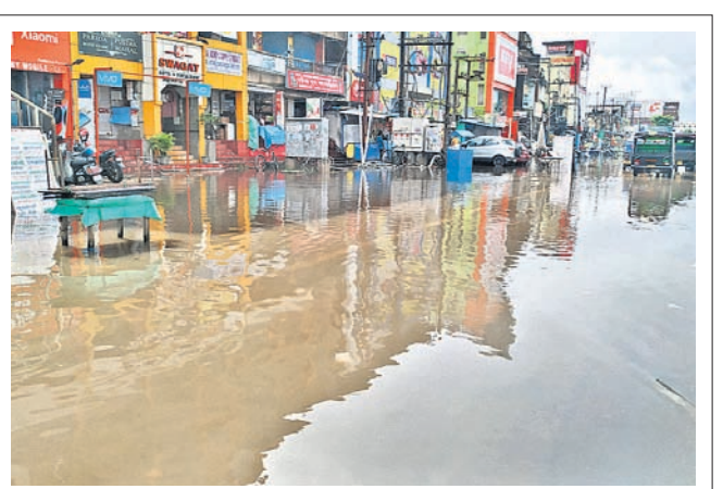
କଟକ ପ୍ରଫେସରପଡ଼ା ଓ ବାବାନବାଡ଼ି ରାସ୍ତାରେ ଜମି ରହିଥିବା ବର୍ଷା ପାଣି ।