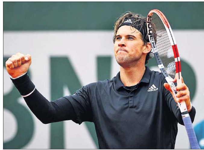
ମ୍ୟାଚ୍ ଛିଟିବା ପରେ ଡୋମିନିକ୍ ଥିମ୍।

ଅଗ୍ରଗତି କରିଛନ୍ତି। ଫ୍ରେଞ୍ଚ୍ ଓପନ୍‌ର ଗତ ଦୁଇଟି ସଂସ୍କରଣରେ ଥିମ୍ ଫାଇନାଲରେ କ୍ଲେମେଣ୍ଟ ଚାକା କୁହାଯାଉଥିବା ସେନେର ରାଫାଲ ନାଡାଲଙ୍କଠାରୁ ପରାସ୍ତ ହୋଇ ରନର୍ସଅପରେ ସବୁଷ୍ଟ ହୋଇଥିଲେ। ସେ ଚାକାଙ୍କ ଶ୍ରେଷ୍ଠ ପ୍ରଦର୍ଶନ କରିପାରି ନ ଥିଲେ ମଧ୍ୟ