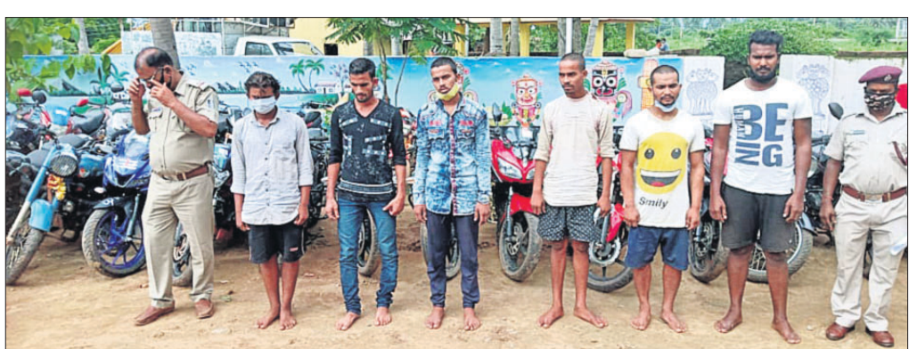
ପୋଲିସ୍ ହେପାକଟରେ ଗିରଫ ଅଭିଯୁକ୍ତ ଓ ଜବତ ଗାଡ଼ି।