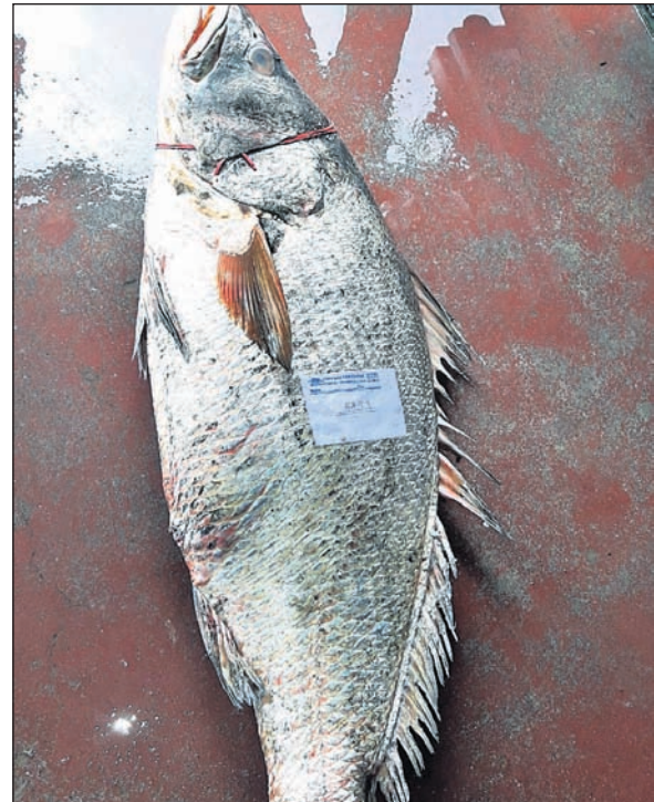
ଜାଲରେ ପଡ଼ିଥିବା ମାଛ।

ଭଦ୍ରକ ଜିଲ୍ଲା ଧାମରା ଚନ୍ଦନୀପାଳରେ ମତ୍ସ୍ୟଜୀବୀଙ୍କ ଜାଲରେ ୨୨ କି.ଗ୍ରା. ଓଜନର ଏକ ତେଲିଆ ମାଛ ପଡ଼ିଥିଲା। ଶୁକ୍ରବାର କି.ଗ୍ରା ପିଛା ସାତେ ୬ ହଜାର ଦାମରେ ମୋଟ ୧ଲକ୍ଷ ୪୩ ହଜାର ଟଙ୍କାରେ ମାଛଟି ନିଲାମ ହୋଇଛି। କୋଲକାତାର ଜଣେ ମାଛ ବ୍ୟବସାୟୀ ଏହାକୁ କିଣିଛନ୍ତି। ତେବେ ମାଛଟି ଖାଇବା ଅପେକ୍ଷା ଏହାର ଅଧିକ ଔଷଧୀୟ ଗୁଣ ଥିବାରୁ ଏହାକୁ ଶିଳ୍ପ ଶ୍ରେଣୀରେ ବେଶୀ ବ୍ୟବହାର କରାଯାଏ ବୋଲି ମତ୍ସ୍ୟଜୀବୀମାନେ କହିଛନ୍ତି।