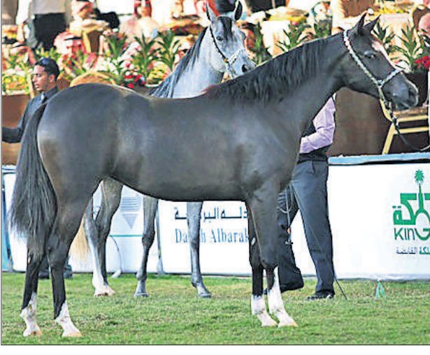
Al-Ussail horse farm

ନୂଆଦିଲ୍ଲୀ: ଘୋଡ଼ାମାନେ ବି ରହି ଅଲିଶାନ ବଞ୍ଚିଲେ। ସେମାନଙ୍କ ପାଇଁ ସ୍ୱଚ୍ଛ ସୁଇମିଂ ପୁଲ୍, ସ୍ୱଚ୍ଛ ପଶୁ ଚିକିତ୍ସକ ଆଇ ରହିଛି ସମସ୍ତ ଆଧୁନିକ ସୁବିଧାସୁଯୋଗ। ଏମିତିକି ଏଠାରେ ଘୋଡ଼ାମାନେ ମଣିଷଙ୍କ ଠାରୁ ବି ଅଧିକ ସୁବିଧାସୁଯୋଗ ଥିବା ବିକାସଜୀବନବିତାଳିଆ ଘୋଡ଼ାମାନଙ୍କ ପାଇଁ ଏମିତିକି ଶେଷ ସୁବିଧା ମିଳୁଥିବା ସ୍ଥାନଟି ହେଉଛି ସାଉଦି ଆରବର ଅଲ-ଅସା। ଖାସ୍ କିସମର ଘୋଡ଼ାମାନଙ୍କ ପାଇଁ ଅଲ-ଅସାରେ ସ୍ୱଚ୍ଛ ପରିଚୟ ରହିଛି। ଏଠାରେ ବହୁ ଅଧିକ ସଂଖ୍ୟାରେ ଘୋଡ଼ା ପାଳନ କରାଯାଏ। ଏଠାରେ ଘୋଡ଼ାମାନଙ୍କୁ ମଣିଷଙ୍କ ଭଳି ଆରାମଦାୟକ ଜୀବନ ବଞ୍ଚିବାର ସୁଯୋଗ ଦିଆଯାଇଥାଏ। ଘୋଡ଼ା ପାଳନ ନିମନ୍ତେ ଏହି ଅଞ୍ଚଳର ସ୍ୱଚ୍ଛ ପରିଚୟ ବି ରହିଛି। ବିଶେଷକରି ନୀଳ ରଙ୍ଗର ଘୋଡ଼ାମାନଙ୍କ ପାଇଁ ଏଠି ସବୁସ୍ୱକାରର ସୁବିଧା ସୁଯୋଗ ଦିଆଯାଇଥାଏ। ଘୋଡ଼ାମାନଙ୍କ ପାଇଁ ସ୍ୱଚ୍ଛ ସୁବିଧା ଥିବା ଘର ତିଆରି କରାଯାଇଥାଏ। ଏମାନଙ୍କ ପାଇଁ ପ୍ରତି ମୁହୂର୍ତ୍ତରେ ପଶୁ ଚିକିତ୍ସକ ଜରି ରହିଥାନ୍ତି। ଘୋଡ଼ାମାନଙ୍କର ଏଭଳି ଲାଲ୍ ଷ୍ଟାଇଲକୁ ନେଇ ଡେଫ୍ ଚର୍ଚ୍ଚା ବି ହୋଇଥାଏ। ତେବେ ଏଠାରେ ଏହି ନୀଳ ଘୋଡ଼ାମାନଙ୍କ ପାଇଁ କିଛି ଦିନ ତଳେ ତିଆରି ହୋଇଛି ଏକ ସୁନ୍ଦର ସୁଇମିଂ ପୁଲ୍। ଘୋଡ଼ାମାନଙ୍କର ମାଂସପେଶୀକୁ ମଜବୁତ କରିବା ପାଇଁ ଏହି ସୁଇମିଂ ପୁଲ୍ ତିଆରି