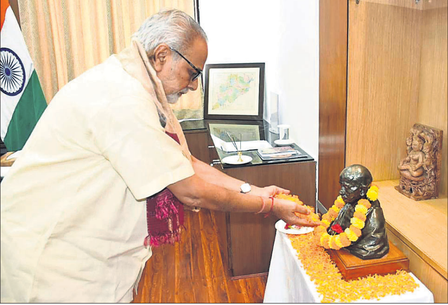
ମହାତ୍ମା ଗାନ୍ଧୀଙ୍କ ୧୫୧ତମ ଜୟନ୍ତୀ ଅବସରରେ ରାଜଭବନରେ ରାଜ୍ୟପାଳ ପ୍ରଫେସର ଗଣେଶୀ ଲାଲ ଗାନ୍ଧୀଙ୍କ ପ୍ରତିମୂର୍ତ୍ତିରେ ପୁଷ୍ପମାଲ୍ୟ ଅର୍ପଣ କରୁଛନ୍ତି।