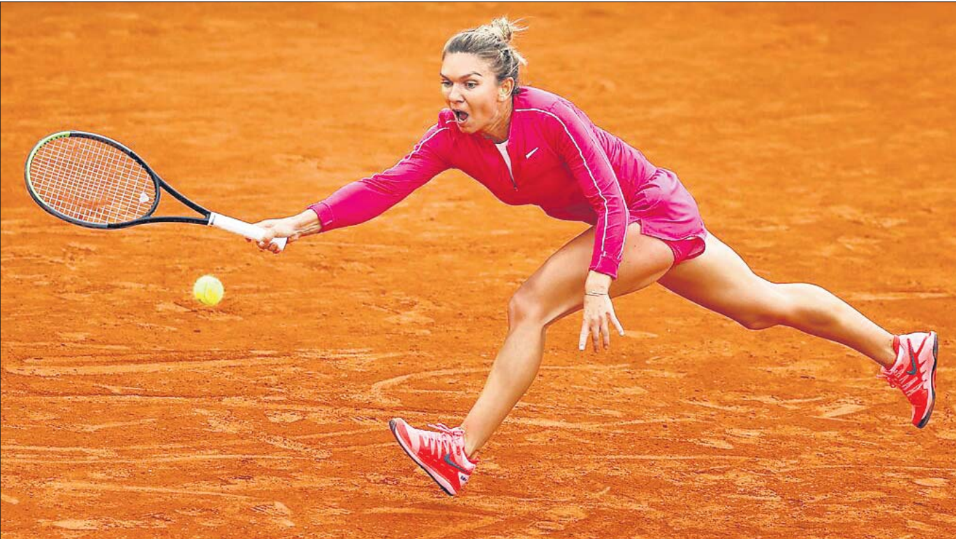
ଫ୍ରେଞ୍ଚ୍ ଓପନ୍ ଗ୍ରାଣ୍ଡସ୍ଲାମ୍ ଟେନିସ୍ ମହିଳା ସିଙ୍ଗଲ୍ସ ଚୂଡ଼ାୟ ରାଉଣ୍ଡରେ ଖେଳିବା ଅବସରରେ ସିମୋନା ହାଲେପ୍।