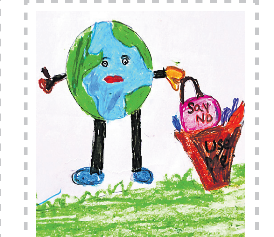
ଦେବାଂଶୁ ଆଚାର୍ଯ୍ୟ, କ୍ଲାସ-୧, ଏସ୍.ଆର୍. ଚିରି ସ୍କୁଲ, ପୁଡ଼ିପୁ, ହାଇଦ୍ରାବାଦ