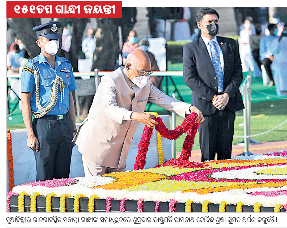
ନୂଆଦିଲ୍ଲୀର ରାଜସ୍ୱାୟତ୍ତ ମହାମାଳୀ ଗାନ୍ଧୀଙ୍କ ସମାଧିଭୂମିରେ ଶୁକ୍ରବାର ରାଷ୍ଟ୍ରପତି ରାମନାଥ କୋବିନ୍ଦ ଶ୍ରଦ୍ଧା ସୁମନ ଅର୍ପଣ କରୁଛନ୍ତି।