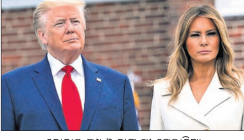
ଡୋନାଲ୍ଡ ଟ୍ରମ୍ପ ଓ ତାଙ୍କ ସ୍ତ୍ରୀ ମେଲାନିଆ