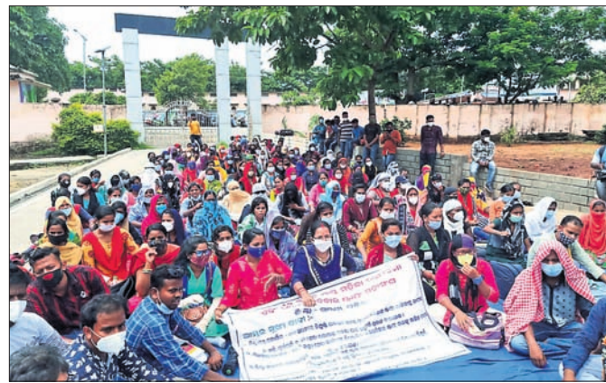
ଛତ୍ରପୁର, ୨୧୧୦ (ଡି.ଏନ୍.ଏ.)