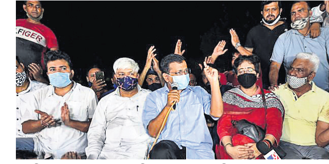
ନୂଆଦିଲ୍ଲୀର ଯତ୍ନମୟରେ ଦିଲ୍ଲୀ ପୁଞ୍ଜୀମନ୍ତ୍ରୀ ଅରବିନ୍ଦ କେକରିଫୁଲ ବିକ୍ଷୋଭକାରୀଙ୍କ ସହ ସାମିଲ ହୋଇଛନ୍ତି।