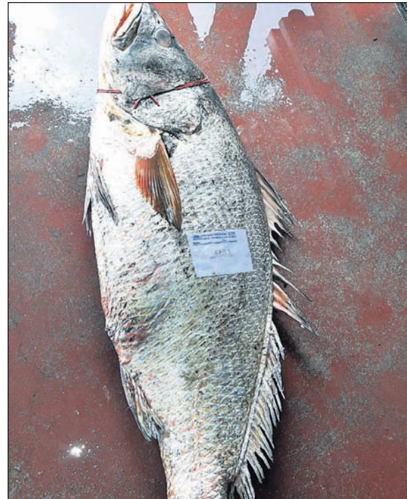
ଜାଲରେ ପଡ଼ିଥିବା ମାଛ।

ଭଦ୍ରକ ଜିଲ୍ଲା ଧାମରା ଚନ୍ଦନୀପାଳରେ ମତ୍ସ୍ୟଜୀବୀଙ୍କ ଜାଲରେ ୨୨ କି.ଗ୍ରା. ଓଜନର ଏକ ତେଲିଆ ମାଛ ପଡ଼ିଥିଲା। ଶୁକ୍ରବାର କି.ଗ୍ରା ପିଛା ସାତେ ୬ ହଜାର ଦାମରେ ମୋଟ ୧ଲକ୍ଷ ୪୩ ହଜାର ଟଙ୍କାରେ ମାଛଟି ନିଲାମ ହୋଇଛି। କୋଲକାତାର ଜଣେ ମାଛ ବ୍ୟବସାୟୀ ଏହାକୁ କିଣିଛନ୍ତି। ତେବେ ମାଛଟି ଖାଇବା ଅପେକ୍ଷା ଏହାର ଅଧିକ ଔଷଧୀୟ ଗୁଣ ଥିବାରୁ ଏହାକୁ ଶିଳ୍ପ ଶ୍ରେଣୀରେ ବେଶୀ ବ୍ୟବହାର କରାଯାଏ ବୋଲି ମତ୍ସ୍ୟଜୀବୀମାନେ କହିଛନ୍ତି।