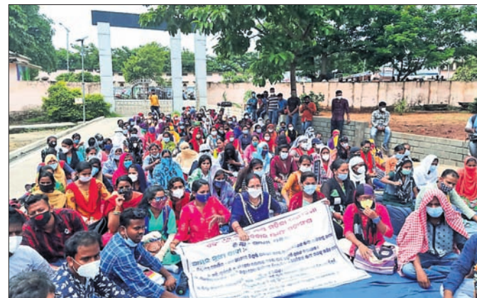
ଛତ୍ରପୁର, ୨୧୧୦ (ଡି.ଏନ୍.ଏ.)