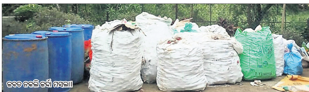
ଜବତ ନକଲି ଜର୍ଦ୍ଦା ମସଲା

ଭୁବନେଶ୍ୱର, ୨୧୧୦ (ବ୍ୟୁରୋ)/ ଚଣ୍ଡିଖୋଲ/ ଛତିଆ (ଡି.ଏନ୍.ଏ.)