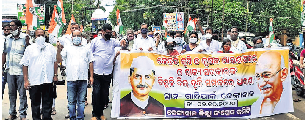
କଂଗ୍ରେସ ପକ୍ଷରୁ କୃଷକ ପଦଯାତ୍ରା।