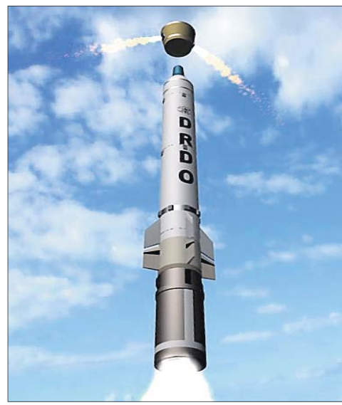
ଅବଦୁଲ କଲାମ ବ୍ରାପ୍‌ପୁ ଉଦ୍‌ଘୋଷଣାରେ ସେପଟାସ୍ତ୍ର ଶୈର୍ଯ୍ୟ।

ସହଯୋଗ ମଧ୍ୟ ରୁଖାଇବେ। ରାପିଡ୍ ରେସପନ୍ସ ଟିମ୍ ଫାଭିପିରାଭିରକୁ ୫ ଦିନ ପର୍ଯ୍ୟନ୍ତ ଖାଇବାକୁ ପରାମର୍ଶ ଦେବା ସହ ଚାର୍ଲଟର ଖାଇବା ନେଇ ଥିବା ସୂଚନାପତ୍ର ମଧ୍ୟ ପ୍ରଦାନ କରିବେ। ଯଦି ପାର୍ଶ୍ୱପ୍ରତିକ୍ରିୟା ହେଲା ତେବେ କାହାକୁ ଜଣାଇବେ ସେ ନେଇ ଟିମ୍ ସହଯୋଗୀମାନେ ଅବଗତ କରାଇବେ। ଯଦି ଔଷଧ ଖାଇବା ପରେ ରୋଗୀ ଗୁରୁତର ହେଲେ ଉକ୍ତ ଟିମ୍ ଚାର୍ଲଟକୁ କୋଭିଡ୍ ହାସିଲ ନେବା ପାଇଁ ସହଯୋଗ କରିବେ। ରୋଗୀଙ୍କୁ ନିୟମିତ ନକର ରଖାଯିବା ସହ ଚେଲିଫୋନ କିମ୍ବା ଅନୁଲୋଚନରେ ଯୋଗାଯୋଗ କରିବାକୁ କୁହାଯାଇଛି। ସେଥିପାଇଁ ପ୍ରତ୍ୟେକ ଜିଲ୍ଲାରେ ଏକ ସ୍ୱତନ୍ତ୍ର ଚେଲିଫୋନ ନମ୍ବର ପାଇଁ ନିର୍ଦ୍ଦେଶ ଦିଆଯାଇଛି। ଏ ନେଇ ଆରୁଆର୍‌ଟିର ଚାଲିମ କାର୍ଯ୍ୟ ତୁରନ୍ତ ଆରମ୍ଭ କରିବାକୁ କୁହାଯାଇଛି। ଚାର୍ଲଟ କିପରି ଗ୍ରହଣ କରିବେ ସେ ନେଇ ମଧ୍ୟ ଏସ୍‌ଓପିରେ ରୋଗୀମାନଙ୍କୁ ପରାମର୍ଶ ଦିଆଯାଇଛି। ଯେଉଁ ରୋଗୀମାନଙ୍କର ଫାଭିପିରାଭିର ଚାର୍ଲଟ ଆବଶ୍ୟକ ହେବ ସେମାନେ ଲିଖିତ ଆକାରରେ ଆରୁଆର୍‌ଟିକୁ ଜଣାଇବେ। ତାତ୍କାଳିନ ଦିନା ପରାମର୍ଶରେ ଔଷଧ ନ ଖାଇବାକୁ ପରାମର୍ଶ ଦିଆଯାଇଛି। ଏହି ଚାର୍ଲଟର ପାର୍ଶ୍ୱ ପ୍ରତିକ୍ରିୟା ଥିବାରୁ ରୋଗୀମାନେ ତାତ୍କାଳିନ ଦିନା ପରାମର୍ଶରେ ନ ଖାଇବାକୁ କୁହାଯାଇଛି।