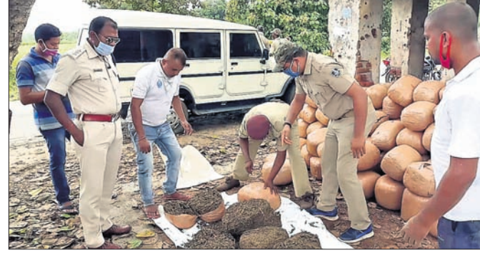
ଜବତ ଗଞ୍ଜେଇ ଓକନ କରାଯାଇଛି।

କୁଣ୍ଡା ଟ୍ରକ୍‌ରୁ ୪୦ଲକ୍ଷର ଗଞ୍ଜେଇ ଜବତ: ୨ ଗିରଫ