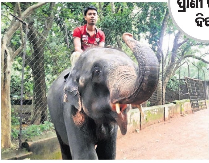
ହାତୀ ଉପରେ କଣେ ମାହୁଡ଼ ବସିଛନ୍ତି।

ଶିଳ୍ପିପାଳ ପରେ ରାଜ୍ୟର ଦ୍ୱିତୀୟ ହସ୍ତୀସଂସ୍କୃତି ଲିଙ୍ଗ ଭାବେ ସାରା ଦେଶରେ ସ୍ୱତନ୍ତ୍ର ପରିଚୟ ହାସଲ କରିଛି ଢେଙ୍କାନାଳ। ଲିଙ୍ଗର ସଂରକ୍ଷିତ ଜଙ୍ଗଲ ଏବଂ ଥଣ୍ଡା ଜଳବାୟୁ ହାତୀଙ୍କ ପାଇଁ ବେଶ୍ ଉପଯୋଗୀ ସାବ୍ୟସ୍ତ ହୋଇଛି।