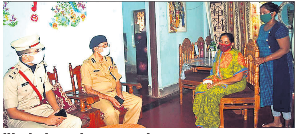
ଡିଜିପି, ଏସ୍ପି ମୃତ ତିଏସ୍ଆଇଙ୍କ ପରିବାର ସହ ଆଲୋଚନା କରୁଛନ୍ତି।

ଢେଙ୍କାନାଳ ଅଫିସ, ୪।୧୦ ଅଧିକାରୀ, କର୍ମଚାରୀଙ୍କ ସହ ବିଭିନ୍ନ ବିଷୟରେ ଆଲୋଚନା କରିଥିଲେ। ଜନସାଧାରଣଙ୍କ ସେବାରେ ନିଷ୍ଠାର ସହ କାର୍ଯ୍ୟ କରିବା ଲାଗି ସେ ବିଭାଗୀୟ କର୍ମଚାରୀଙ୍କୁ ପରାମର୍ଶ ଦେଇଛନ୍ତି।