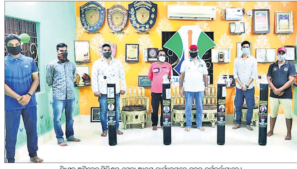
ନିଃଶୁଳ୍କ ଅକ୍ଟୋବର ସିଲିଣ୍ଡର ସେବା ଆରମ୍ଭ କାର୍ଯ୍ୟକ୍ରମରେ କୁବର କର୍ମକର୍ତ୍ତାମାନେ।

ଆରମ୍ଭ କରାଯାଇଛି। ଏହାଦ୍ୱାରା ଏବଂ ଅନୁଷ୍ଠାନ ନିଜର ପ୍ରିୟତମକ କରୋନାରେ ସଂକ୍ରମିତ ହୋଇ ସମ୍ପର୍କରେ ଥିବା ରୋଗୀଙ୍କୁ ଅକ୍ଟୋବର ଯୋଗାଇ ଦିଆଯିବ।