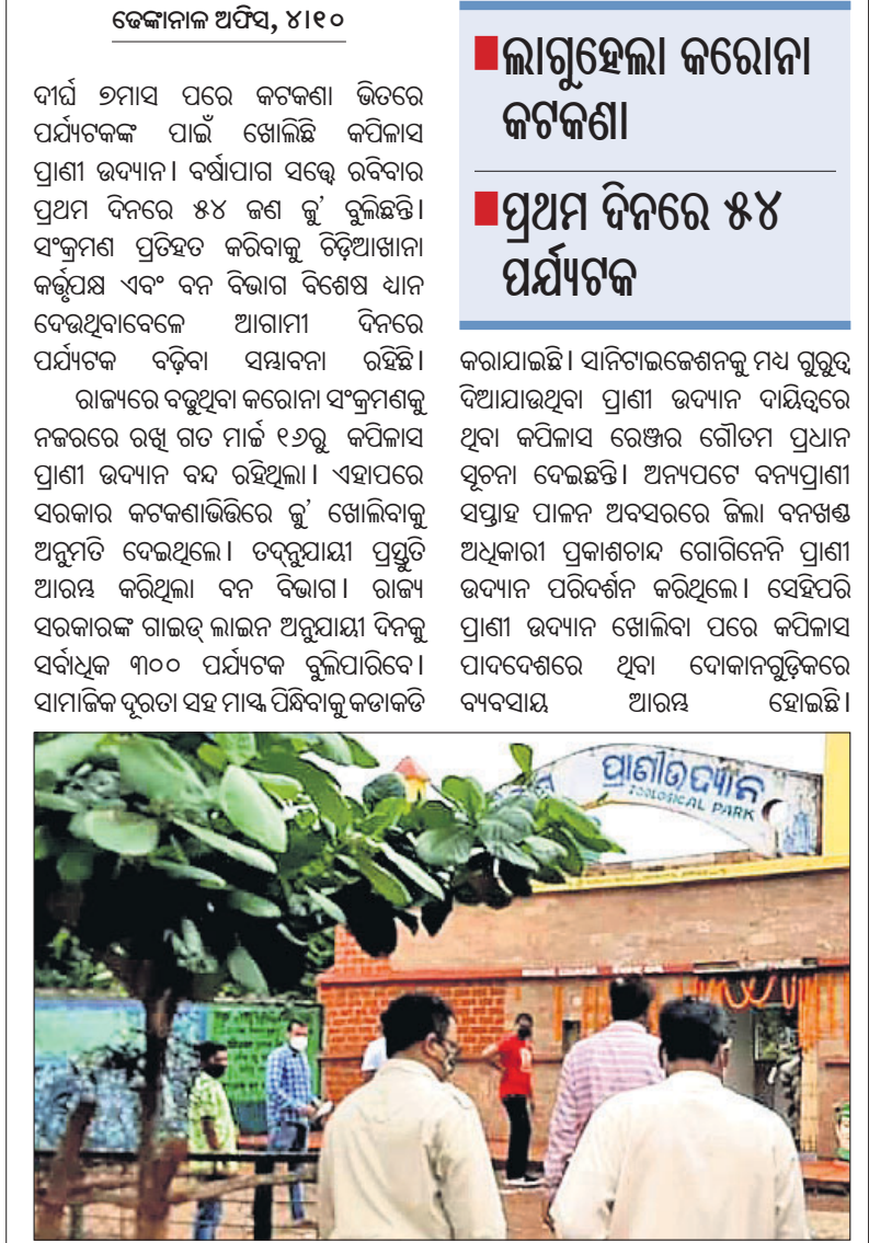
ପ୍ରାଣୀ ଉଦ୍ୟାନ ଫାଟକ ସମ୍ମୁଖରେ ପର୍ଯ୍ୟଟକମାନେ ଅପେକ୍ଷା କରିଛନ୍ତି।

ଢେଙ୍କାନାଳ ଅଫିସ, ୪।୧୦ ଦୀର୍ଘ ୭ମାସ ପରେ କଟକଣା ଭିତରେ ପର୍ଯ୍ୟଟକଙ୍କ ପାଇଁ ଖୋଲିଲା କପିଳାସ ପ୍ରାଣୀ ଉଦ୍ୟାନ। ବର୍ଷାପାତ ସତ୍ତ୍ୱେ ରବିବାର ପ୍ରଥମ ଦିନରେ ୫୪ ଜଣ ଲୁହା ଲୁହା ବୁଲିଛନ୍ତି।