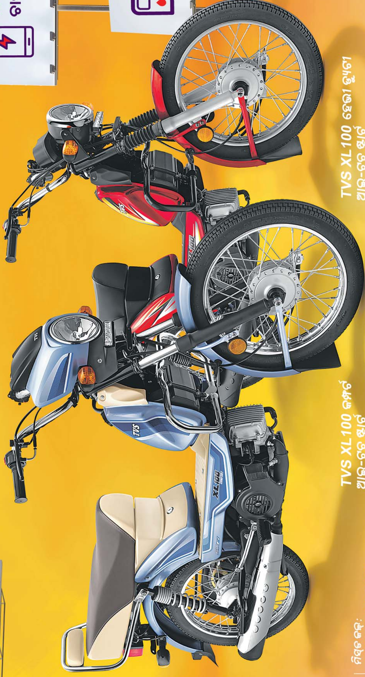
TVS XL100 କମ୍ଫର୍ଟ ଆଇ-ଟେ ଝାର୍