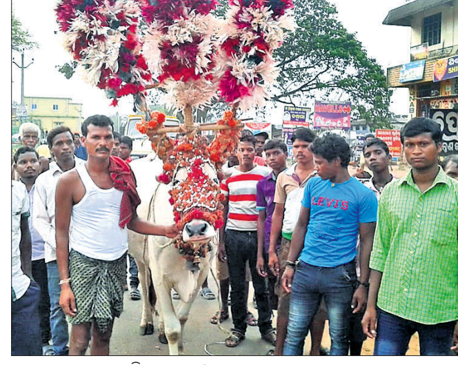
ଅଭ୍ୟାସ ଯାତ୍ରାରେ ବାହାରିଥିବା ବଳଦ।

ବଳଦଗାଡ଼ି ଉପରେ ନିର୍ଦ୍ଧର କରୁଥିଲେ। ଦୀର୍ଘଦିନର ଏକତ୍ର ସହାୟତା ପରେ ଅନୁଷ୍ଠିତ ହେବାକୁ ଥିବାବେଳେ ପ୍ରଶାସନ ଉପରେ ଏହି ପ୍ରସ୍ତାବ ରଖାଯିବ ବୋଲି କମିଟି ପକ୍ଷରୁ କୁହାଯାଇଛି।