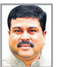
- ଧର୍ମେନ୍ଦ୍ର ପ୍ରଧାନ, କେନ୍ଦ୍ରମନ୍ତ୍ରୀ