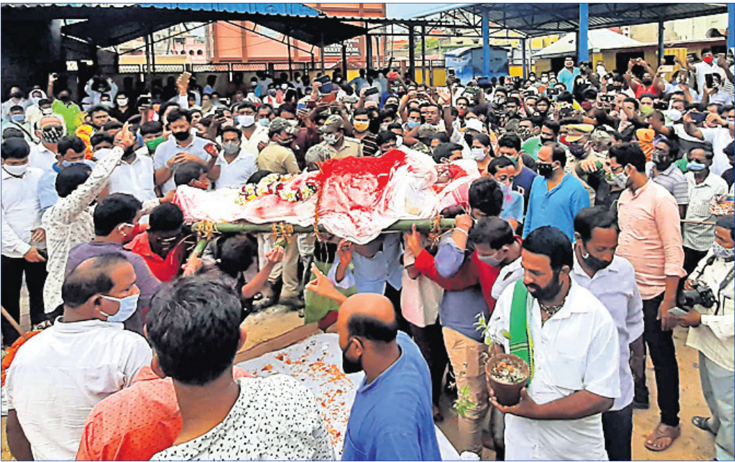
ପୁରୀ ସର୍ବଦ୍ୱାରରେ ମହାରଥୀଙ୍କ ପାର୍ଥିବ ଶରୀରକୁ ଅନ୍ତିମ ସଂସ୍କାର ପାଇଁ ନିଆଯାଇଛି।

ଆବଶ୍ୟକ ଥିବା ପଦବୀ ମଧ୍ୟରୁ ୯୦ପ୍ରତିଶତ ଗ୍ରାମୀଣ ଲୋକଙ୍କ ଦ୍ୱାରା ପୂରଣ କରାଯିବ। କୃଷକ ଗ୍ରାମିଣଙ୍କ ପାଇଁ ଥିବା ପଦବୀ ମଧ୍ୟରୁ ୬୦ପ୍ରତିଶତ ଓ ପରିଚାଳନା କ୍ଷେତ୍ରରେ ଥିବା ପଦବୀ ମଧ୍ୟରୁ ଅତିକମରେ ୩୦ ପ୍ରତିଶତ ଗ୍ରାମୀଣ ମୃଦତୀମୃଦକଙ୍କ ଦ୍ୱାରା ପୂରଣ ହେବାର ନିୟମ ରହିଛି। ଏହି କାରଖାନାଗୁଡ଼ିକ ୭୭,୨୧୮.୬୪ କୋଟି ଟଙ୍କା ବ୍ୟୟରେ ନିର୍ମିତ ହୋଇଛି ବିଧାନସଭାରେ ବିଧାୟିକା କୁସୁମା ଚେଟେକ ଏକ ଲିଖିତ ଉତ୍ତରରେ ବିଭାଗୀୟ ମନ୍ତ୍ରୀ ସୂଚନା ଦେଇଛନ୍ତି।