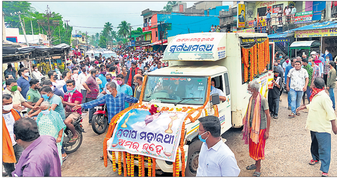
ପିପିଲି ବଜାରରେ ମହାରଥୀଙ୍କ ମରଣୋତ୍ସବ ଶୋଭାଯାତ୍ରାରେ ନିଆଯାଇଛି।