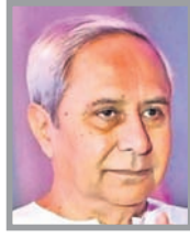
- ନବୀନ ପଟ୍ଟନାୟକ, ମୁଖ୍ୟମନ୍ତ୍ରୀ