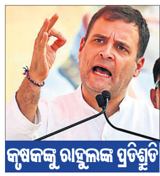
କୃଷକଙ୍କୁ ରାହୁଲଙ୍କ ପ୍ରତିଶ୍ରୁତି

ନୂଆଦିଲ୍ଲୀ, ୪।୧୦ କୃଷକଙ୍କ ବିକାଶ ଲାଗି କଂଗ୍ରେସ ସର୍ବଦା କାମ କରିଆସିଛି। ଦଳ କେନ୍ଦ୍ରରେ କ୍ଷମତାକୁ ଫେରିବା ପରେ ବିବାଦୀୟ କୃଷି ଆଇନକୁ ହଟାଇ ଦିଆଯିବ ବୋଲି ବରିଷ୍ଠ କଂଗ୍ରେସ ନେତା ରାହୁଲ ଗାନ୍ଧୀ ରବିବାର ପ୍ରକାଶ କରିଛନ୍ତି। କେନ୍ଦ୍ର ସରକାର କୃଷକଙ୍କ ବିକାଶ ନୁହେଁ ବିନାସ ଚାହୁଁଛି ବୋଲି ସେ କହିଛନ୍ତି। ଖାଦ୍ୟଶସ୍ୟ ସଂଗ୍ରହ, ଏମ୍ଏସ୍‌ପି, ହୋଲ୍‌ସେଲ୍ ମାର୍କେଟ ଦେଶର ୩ ପ୍ରାୟ। କେନ୍ଦ୍ର ସରକାର ଏଥିରୁ ଦୂରେଇ ଯାଇ କୃଷକଙ୍କୁ ବୋକା ବନାଇଛନ୍ତି। କଂଗ୍ରେସ ଏହା କେବେ କରାଇ