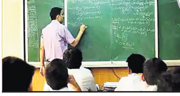
ଅସମାପିକା ସାବୁ ଭୁବନେଶ୍ୱର, ୪୧୦

ଶିକ୍ଷକଙ୍କ ପାଇଁ ସେତେବେଳେ କଷ୍ଟକର ନ ଥିଲା। କିନ୍ତୁ ସରକାରୀ ବିଶେଷକରି ଓଡ଼ିଆ ମାଧ୍ୟମ ସ୍କୁଲର ଶିକ୍ଷକଙ୍କ ପାଇଁ ଏହା ଆଉ ଏକ ଚ୍ୟାଲେଞ୍ଜ ଥିଲା। ତଥାପି ସବୁ ପିଲାଙ୍କ ପାଖରେ ପହଞ୍ଚିବା ଓ ନୂଆ ଧାରାରେ ନିଜକୁ ସାମିଲ କରି ପିଲାଙ୍କ ଭବିଷ୍ୟତ ଗଢ଼ିବା ପାଇଁ ନୂଆ ଚ୍ୟାଲେଞ୍ଜର ସଫଳତାର ସହ ଆଗେଇ ନେବାରେ ଲାଗିଛନ୍ତି। ଓଡ଼ିଆ ସରକାରୀ ସ୍କୁଲର ଶିକ୍ଷକମାନେ କୌଣସି ପୂର୍ବ ପ୍ରଶିକ୍ଷଣ ନେଇ ନ ଥିଲେ ମଧ୍ୟ ସରକାରୀ ଅନୁମୋଦିତ ଆପ୍ ସବୁ ଡାଉନଲୋଡ୍ କରି ଅତି ଉନ୍ନତ ମାଧ୍ୟମରେ ଶିକ୍ଷାଦାନ କରିବା ଲାଗି ରଖିଛନ୍ତି। ଏନିତି ପିଲାଙ୍କୁ ଏକ୍ସେପ୍ଟରେ ଗପ ମୁକ୍ତ କରିବା ପାଇଁ ସରକାରଙ୍କ ନିର୍ଦ୍ଦେଶକୁ ମଧ୍ୟ ପାଳନ କରୁଛନ୍ତି।