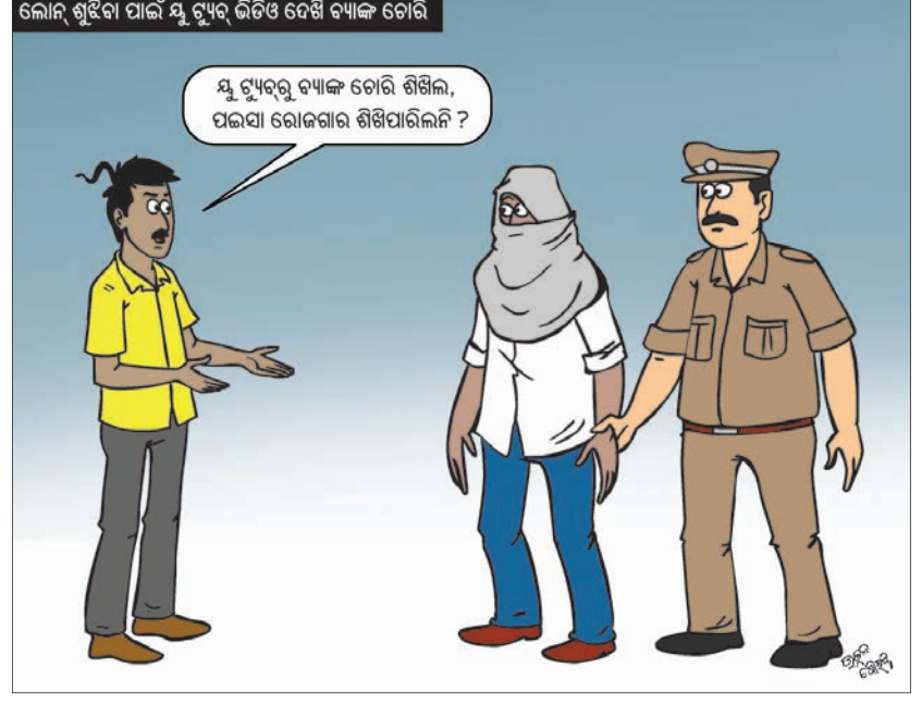
ଲୋକ ଶୁଣିବା ପାଇଁ ସୁ ଚ୍ୟୁର୍ ଗିରିଓ ଡେଖି ବ୍ୟାଙ୍କ ଗୋଟି