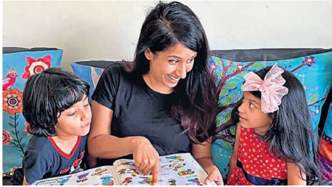
ଲାଙ୍ଗୁଏଲ୍ ସିଲ୍ ବା ଭାଷା ଜ୍ଞାନର ପିଲାମାନେ ଗପ ଶୁଣିବେ ସେହି ଭାଷାକୁ ବିକାଶ ହୋଇଥାଏ। ଯେଉଁ ଭାଷାରେ ସେମାନେ ସହଜରେ ବୁଝି ପାରନ୍ତି।

► ଗପ ଶୁଣିବା ଫଳରେ ପିଲାଙ୍କର ଭୋକାବୁଲାରା ଅର୍ଥାତ୍ ଶବ୍ଦ ଜାଣିବାର କ୍ଷମତା ବି ବୃଦ୍ଧି ପାଇଥାଏ। ଶବ୍ଦକୁ ପଢ଼ି ମନେରଖିବା ବଦଳରେ ଗପ ମାଧ୍ୟମରେ ଶୁଣିବା ଫଳରେ ସେମାନେ ସହଜରେ ମନେ ରଖିଥାନ୍ତି। ► ପିଲାମାନଙ୍କ ପକ୍ଷେ ବଡ଼ି ଲାଙ୍ଗୁଏଲ୍ ଜାଣିବା ପାଇଁ ବି ଗପ ସହାୟକ ହୋଇଥାଏ। ଖରାପ, ଭଲ କିମ୍ବା ପ୍ରତିକୃତ୍ୟା ପ୍ରକାଶ କରିବା ଶୈଳୀକୁ ମଧ୍ୟ ପିଲାମାନେ ଗପ ଶୁଣିବା ଦ୍ଵାରା ଶିଖିଥାନ୍ତି। ► କୌଣସି ଘଟଣାରେ ମୁହଁର ଭାବକୁ ଦେଖି ସହଜରେ ବୁଝିପାରିବା ଏବେ ସହଜ ନୁହେଁ। କିନ୍ତୁ ବିଭିନ୍ନ ପ୍ରକାରର କାହାଣୀ ଶୁଣିବା ପରେ ପିଲାଙ୍କ ମଧ୍ୟରେ ଏହି କ୍ଷମତା ବି ବିକଶିତ ହୋଇଥାଏ। ► ପିଲାମାନେ ସବୁବେଳେ ଗପ ଶୁଣିବା ଫଳରେ ସେମାନଙ୍କର କହିବା କ୍ଷମତା ବି ବୃଦ୍ଧି ପାଇଥାଏ। ତେଣୁ ସେମାନଙ୍କର କମ୍ୟୁନିକେସନ୍ ସ୍କିଲ୍ ବା ଅନ୍ୟମାନଙ୍କ ସହିତ ଯୋଗାଯୋଗ କରିବା କ୍ଷମତା ବୃଦ୍ଧି ପାଇଥାଏ। ଭବିଷ୍ୟତରେ ଏହି ଗୁଣ ସେମାନଙ୍କୁ ସାହାଯ୍ୟ କରିଥାଏ। ► ସବୁଦିନ ଭିନ୍ନ ଭିନ୍ନ ପ୍ରକାରର ଗପ ଶୁଣିବା ଫଳରେ ପିଲାଙ୍କର ଭଲ ଗୁଣର ଅଧିକ ବିକାଶ ହୋଇଥାଏ। କାହାଣୀ ମାଧ୍ୟମରେ ପିଲାଙ୍କୁ ବିଭିନ୍ନ କଥାର ଉଦାହରଣ ଦେଇ ବହୁତ କିଛି ଶିକ୍ଷା ଦିଆଯାଇପାରେ।