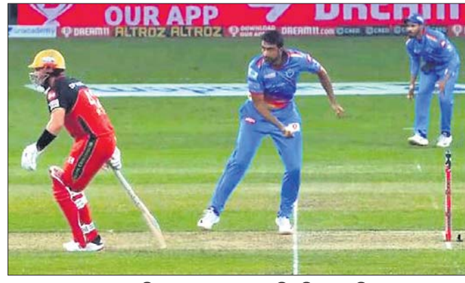
ଆରୋନ୍ ଫିଞ୍ଜୁ ସଚେତନ କରାଇଛନ୍ତି ରବିନ୍ଦ୍ରନ୍ ଅଶ୍ୱିନ।

ଭାରତ ତଥା ଦିଲ୍ଲୀ କ୍ୟାପିଟାଲ୍ସ୍ ଅଫ୍ ସିନର ରବିନ୍ଦ୍ରନ୍ ଅଶ୍ୱିନ ମଙ୍ଗଳବାର ନିଜର ପ୍ରଥମ ଓ ଅଧିକ ଚେତାବନୀ ଦେଇଛନ୍ତି। ଦିଲ୍ଲୀ ଓ ରୟାଲ ଚ୍ୟାଲେଞ୍ଜର୍ସ୍ ବାଙ୍ଗାଲୋର ମୁକାବିଲାରେ ଅଶ୍ୱିନ ପୁଣି ଥରେ ସମପ୍ରକାଶ ନକରନ୍ତୁ ଆସିଛନ୍ତି। ଏହି ମ୍ୟାଚରେ ଅଶ୍ୱିନ ଯେତେବେଳେ ବୋଲିଂ କରୁଥିଲେ ସେତେବେଳେ ବାଙ୍ଗାଲୋରର ଓପନର ଆରୋନ ଫିଞ୍ଜୁ ମଙ୍ଗଳବାର ଦ୍ୱାରା ଆଉଟ୍ କରିବା ସୁଯୋଗ ଥିଲା। କିନ୍ତୁ ଅଶ୍ୱିନ ଫିଞ୍ଜୁ ମଙ୍ଗଳବାର ନ କରି ଚେତାବନୀ ଦେଇ ଛାଡ଼ି ଦେଇଥିଲେ। ଉଲ୍ଲେଖଯଥା ଡି, ବୋଲିଂ କରିବା ବେଳେ ନନ୍ ଷ୍ଟାଇକର ଏଣ୍ଡରେ ଥିବା ବ୍ୟାଟ୍ସମ୍ୟାନ ବଲ୍ ପଡ଼ିବା ପୂର୍ବରୁ କ୍ରିକ୍ସ୍ କିଛି ବାଟ ଆଗକୁ ଚାଲିଯାଇପାଡ଼ି। ଏହାର ସୁଯୋଗ ନେଇ ବୋଲର ଯଦି ସମ୍ପୂର୍ଣ୍ଣ ବ୍ୟାଟ୍ସମ୍ୟାନଙ୍କୁ ରନ୍ ଆଉଟ୍ କରିଛି ତାହେଲେ ତାକୁ ମଙ୍ଗଳବାର କୁହାଯାଇଥାଏ। ଏବେ ଏନେଇ ଅଶ୍ୱିନଙ୍କ ଚେତାବନୀର ଯଥେଷ୍ଟ ଗୁରୁତ୍ୱ ରହିଛି। ନନ୍ ଷ୍ଟାଇକର ଏଣ୍ଡରେ ଥିବା