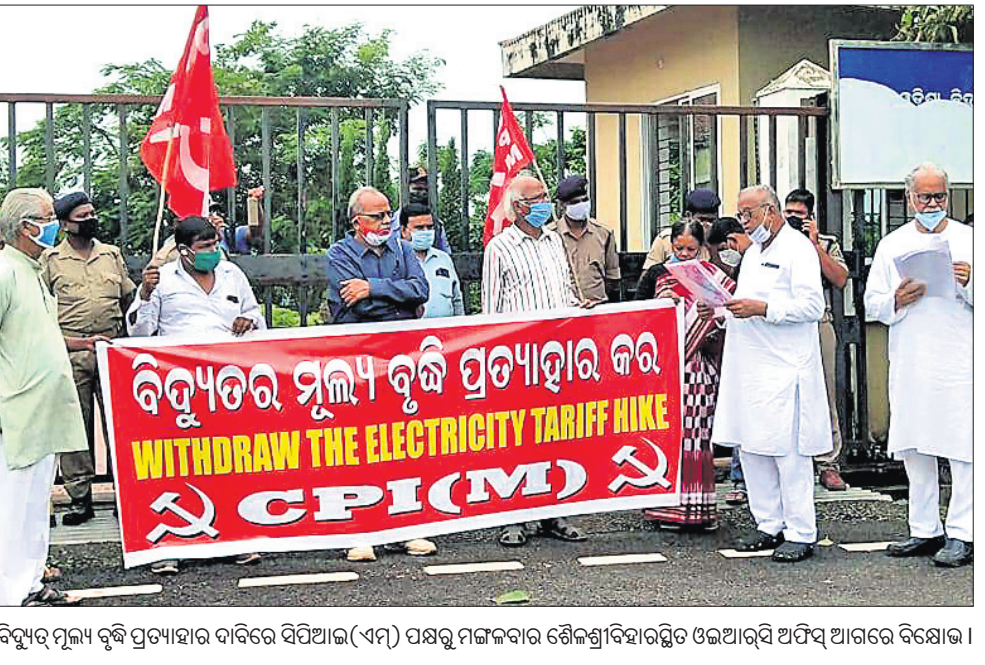
ବିଦ୍ୟୁତ୍ ମୂଲ୍ୟ ବୃଦ୍ଧି ପ୍ରତ୍ୟାହାର ଦାବିରେ ସିପିଆଇ(ଏମ) ପକ୍ଷରୁ ମଙ୍ଗଳବାର ଶୈଳଶ୍ରୀବିହାରସ୍ଥିତ ଓଇଆର୍‌ସି ଅଫିସ୍ ଆଗରେ ବିକ୍ଷୋଭ।