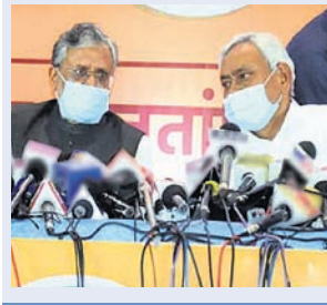
କେଡିମୁ- ଭାଙ୍ଗିବା ମଧ୍ୟରେ ମଙ୍ଗଳବାର ଆସନ ରୁଝାମଣା ଦୂତାନ୍ତ ହୋଇଛି। କେଡିମୁ ୧୨୨ ଓ ଭାଙ୍ଗିପା ୧୨୧ ଆସନରେ ନିର୍ବାଚନ ଲଢ଼ିବେ। ଜିତନ୍ତ୍ରାମ ମାନ୍‌ଷୀଙ୍କୁ କୋଟାରେ ଏନ୍ଡିଏରୁ ୭ ଆସନ ଛଡ଼ାଯିବ ବୋଲି ଜଣାପଡ଼ିଛି।

ପାଟନା, ୬।୧୦ ବିହାର ବିଧାନସଭା ନିର୍ବାଚନ ପୂର୍ବରୁ ଏନ୍ଡିଏରେ ଦେଖାଦେଇଥିବା ଫାଟ କ୍ରମଶଃ ମଜିନ ପଡ଼ିଯାଇଛି। ତିରାଣ ପାଶ୍ଚାତ୍ୟ ଲୋକ ଜନଶକ୍ତି ପାର୍ଟି(ଏଲ୍‌ଜେପି) କେଡିମୁକୁ ବିରୋଧ କରିବ ଓ ଏନ୍ଡିଏ ସହ ରହିବ ବୋଲି କହି ବ୍ରହ୍ମ ସୃଷ୍ଟି କରିଥିବାବେଳେ ଭାଙ୍ଗିପା ଅକଳରେ ପଡ଼ିଥିଲା। ଏବେ ଏହା ଦୂର ହୋଇଛି। ପ୍ରଦେଶ ଭାଙ୍ଗିବା ପ୍ରକ୍ଷୟ ସଞ୍ଜୟ ଜିଶିଠ୍ଠାଲ ପକ୍ଷରୁ ନିଜର ନୀତିଗତ ସ୍ଵପ୍ନ କରାଯିବା ସହ ଏଲ୍‌ଜେପି ସହ କୌଣସି ଭିତ୍ତିରୁ ରୁଝାମଣା କରାଯିବ ବୋଲି ମଙ୍ଗଳବାର ସ୍ଵପ୍ନ କରିଛି। ଏଥିସହ ପାଳନ କରିବା ଲାଗି କୁହାଯାଇଛି।