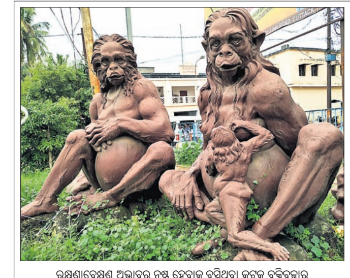
ରକ୍ଷଣାବେକ୍ଷଣ ଅଭାବରୁ ନଷ୍ଟ ହେବାକୁ ବସିଥିବା କଟକ ବକ୍ସିବଜାର ଅଗ୍ରଣୀୟ ବିଭାଗ କାର୍ଯ୍ୟାଳୟ ସମ୍ମୁଖରେ ଫାଇବରରେ ନିର୍ମିତ ବଣମଣିଷ।