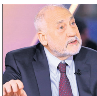
ଭାରତର କରୋନା ଲଢେଇ ନିକ୍ଷୁ: କୋସେପ୍ଟ୍ ଷ୍ଟିଗଲିଜ୍

ପ୍ରଧାନମନ୍ତ୍ରୀ ନରେନ୍ଦ୍ର ମୋଦିଙ୍କୁ ନୋବେଲ ବିଜେତା ସ୍ୱରୂପେ ଅର୍ଥନୀତିଜ୍ଞ କୋସେପ୍ଟ୍ ଷ୍ଟିଗଲିଜ୍ ସମାଲୋଚନା କରିଛନ୍ତି। କରୋନା ମହାମାରୀ ବିରୋଧରେ ଭାରତର ଲଢେଇ ଅତି ନିକ୍ଷୁ ଧରଣର ବୋଲି ସେ ବିବେଚନା କରିଛନ୍ତି। ପିକ୍ ଇଣ୍ଟର୍ନାସନାଲ ପକ୍ଷରୁ ଅନୁଷ୍ଠିତ ଏକ ଫ୍ରେବନାରରେ ଷ୍ଟିଗଲିଜ୍ କୋସେପ୍ଟ୍ ସରକାରଙ୍କ ଆର୍ଥିକ ନୀତିକୁ ମଧ୍ୟ ସମାଲୋଚନା କରିଛନ୍ତି। ଧନୀଙ୍କ ଉପରେ ଚିକିତ୍ସା କରାଯାଏ ଏବଂ ନିମ୍ନ ସ୍ତରରେ ରହିଥିବା ଲୋକଙ୍କ ସହାୟତା ସପକ୍ଷରେ ସେ ଯୁକ୍ତି ବାଢ଼ିଛନ୍ତି। ଭାରତୀୟ ଅର୍ଥ ବ୍ୟବସ୍ଥାକୁ ଗ୍ରାହକ ଆଣିବା ଲାଗି କେଉଁଭଳି ଦିଗକୁ ଧ୍ୟାନ ଦେବାକୁ ପଡିବ ବୋଲି ତାଙ୍କୁ ପ୍ରଶ୍ନ କରାଯାଇଥିଲା। ଏହାର ଉତ୍ତର ରଖି ସେ କହିଛନ୍ତି ଯେ, ଭାରତରେ ଅତି