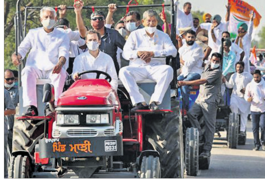
କୃଷି ବିଲକୁ ବିରୋଧ କରି ପଟିଆଲାରେ ଅନୁଷ୍ଠିତ 'କ୍ଷେତି ବଟାଓ' ଆନ୍ଦୋଳନ ବେଳେ କଂଗ୍ରେସ ନେତା ରାହୁଲ ଗାନ୍ଧୀ ଗ୍ରାହ୍ୟ ଚଳାଇଛନ୍ତି।

ବିଚାର କରିବ ବୋଲି ସିଜେଆଇ କହିଥିଲେ। ଏଥିସହ ଘଟଣାର ଉଚିତ ତଦନ୍ତ ହେବ ବୋଲି କୋର୍ଟ ଆବେଦନକାରୀଙ୍କୁ ପ୍ରତିଶ୍ରୁତି ଦେଇଛନ୍ତି। ଅନ୍ୟପକ୍ଷରେ ଉତ୍ତରପ୍ରଦେଶ ସରକାର ସତ୍ୟପାଠ ମାଧ୍ୟମରେ କହିଛନ୍ତି, ହିଂସାକାଣ୍ଡକୁ ରୋକିବା ଲାଗି ପାଟିଡ଼ାଙ୍କ ମରଣରୀରକୁ ଅଧରାତିରେ ପୋଡ଼ିଦିଆଯାଇଥିଲା। ବାପି ମସଜିଦ୍ ରାୟ ପରଦିନ ଆଇନଶୁଖିଲା ପରିସ୍ଥିତି ଦେଖାଦେବ ବୋଲି ଚୋଇକା ସୂଚନା ମିଳିଥିଲା। ଦଣ୍ଡାକୁ ଏଡ଼ାଇବା ଲାଗି ଲିଲାବ୍ୟାପୀ ହାଇଆଲର୍ଟ ଜାରି କରାଯାଇଥିଲା ବୋଲି ରାଜ୍ୟ ସରକାର କହିଛନ୍ତି। ପ୍ରକାଶପାତ୍ର କି, ହାଥୁରସ ଘଟଣାକୁ ନେଇ ବିରୋଧୀ ଦଳଗୁଡ଼ିକ ପକ୍ଷରୁ ସରକାରଙ୍କ ବିରୋଧରେ ବିକ୍ଷୋଭ ଜାରି ରହିଥିବାବେଳେ ଦ୍ଵିତୀୟ ନ୍ୟାୟ ଲାଗି ଦାବି କରାଯାଇଛି।