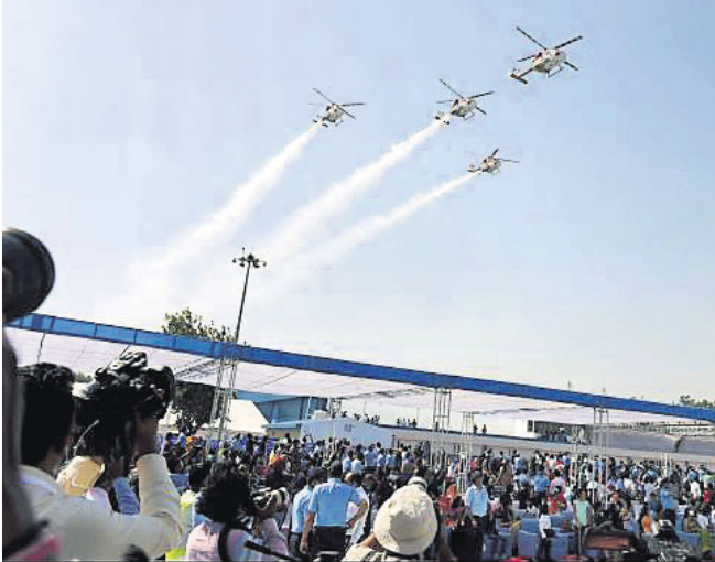
୮୮ତମ ଭାରତୀୟ ବାୟୁସେନା ଦିବସ ପୂର୍ବରୁ ମଙ୍ଗଳବାର ଗାଜିଆବାଦର ହିନ୍ଦୀ ଏୟାରବେସରେ ବାୟୁସେନା ହେଲିକପ୍ଟର ଶକ୍ତି ପ୍ରଦର୍ଶନ କରିବା ସହ ରିହସ୍ୟାଳ କରୁଛନ୍ତି।