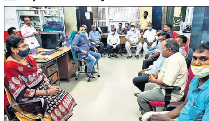
ବୈଠକରେ ଉପସ୍ଥିତ କର୍ମକର୍ତ୍ତା।

ରାଜ୍ୟ ବାହାରେ ଥିବା ଭଞ୍ଜନଗର ଉପଖଣ୍ଡର ଲକ୍ଷ ଲକ୍ଷ ଲୋକ କରୋନା ଯୋଗୁଁ ଭିଗମାଗିତ ହୋଇଥିଲେ।