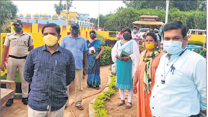
କେଳୁଆପାଳା ଗ୍ରାମ୍ୟ ଉନ୍ନୟନ ପରିଦର୍ଶନ କରୁଛନ୍ତି ଜିଲ୍ଲାପାଳ ଓ ଅନ୍ୟ ଅଧିକାରୀ।