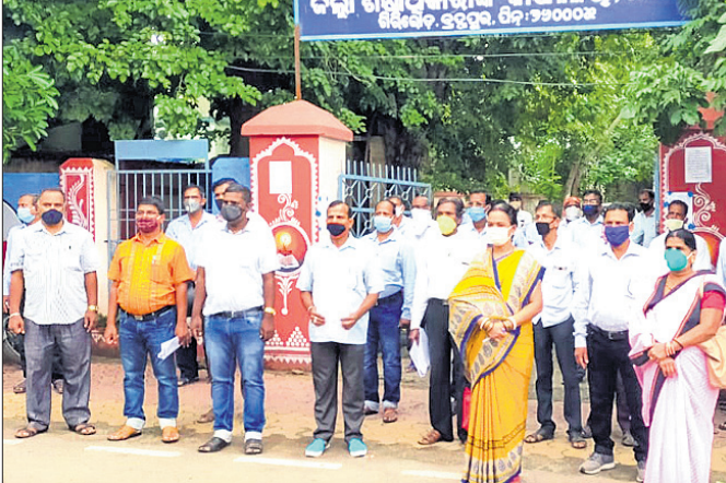
ଦାବିପତ୍ର ପ୍ରଦାନ କରିବାକୁ ଆସିଥିବା ଶିକ୍ଷୟତ୍ରୀ ଓ ଶିକ୍ଷକ।