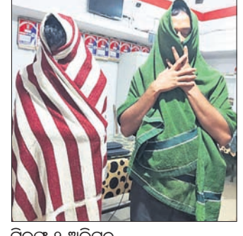
ଗିରଫ ୨ ଅଧିକାରୀ

ବାଲେଶ୍ୱର/ରେଘୁଶା, ୨୧୦ (ଡି.ଏନ.ଏ.) ବାଲେଶ୍ୱର ଜିଲ୍ଲା ଶେରଗଡ଼ ଟୋଲଗେଟ୍ ନିକଟରୁ ଖରାପତା ପୋଲିସ୍ ଦୁଇ ନକଲି ଏସ୍ତିଏସ୍ ଅଧିକାର ଗିରଫ କରିଛି।